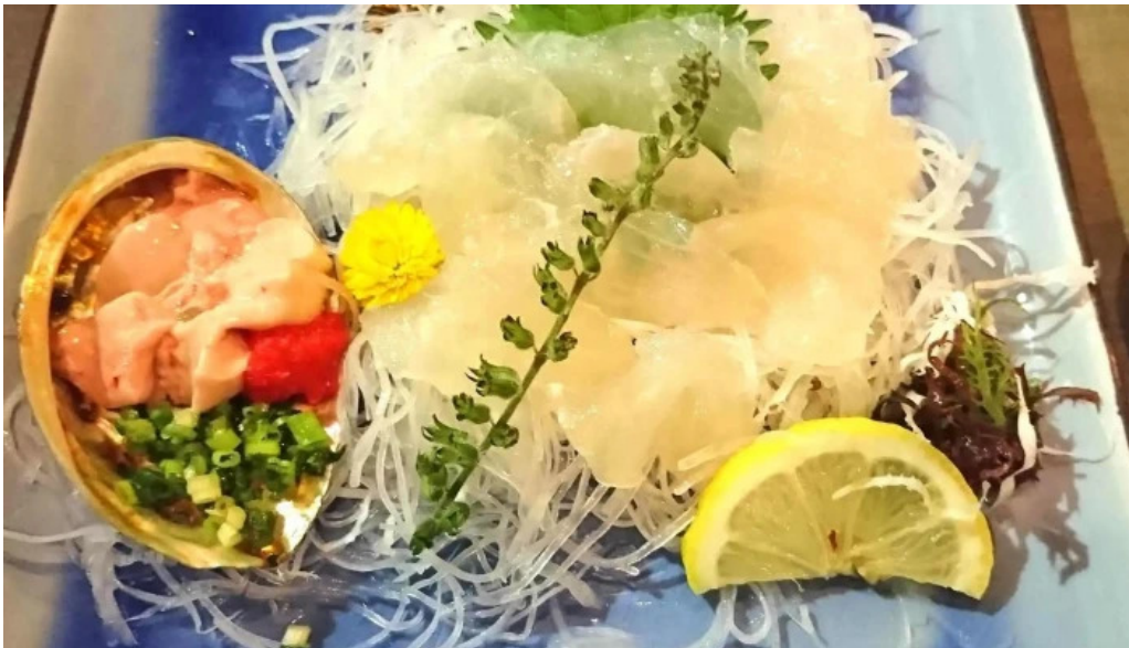
やまがたや 口コミ