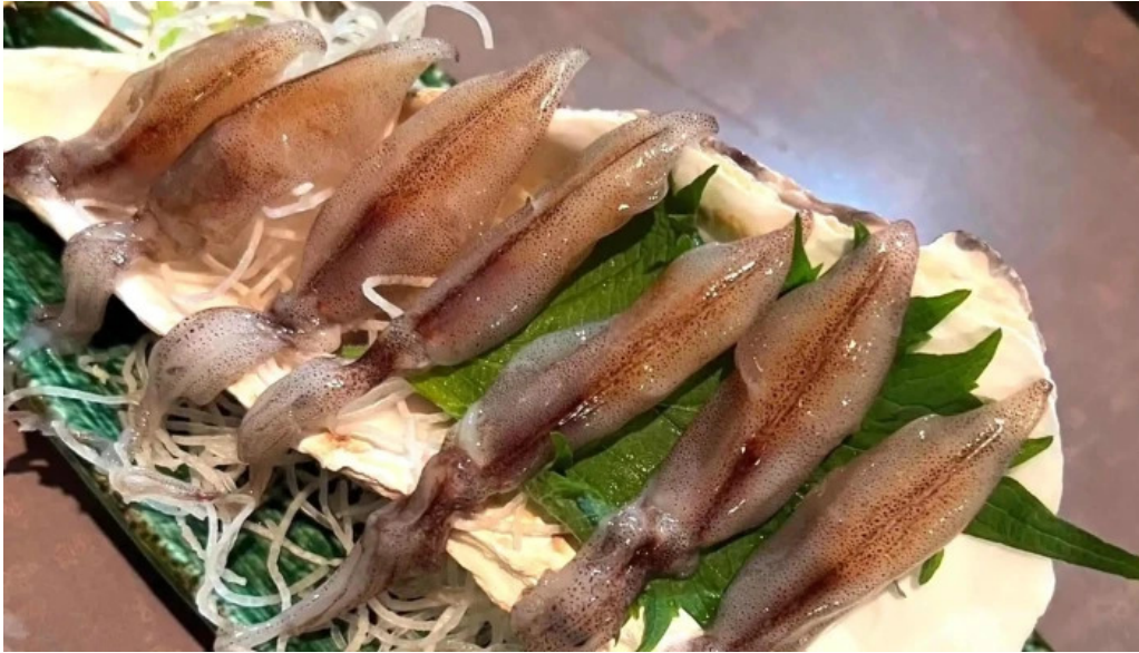
やまがたや コメント