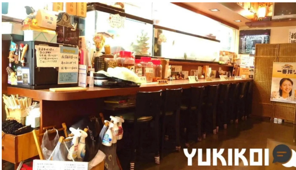
やまがたや 雰囲気