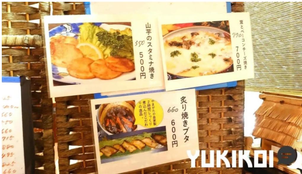
やまがたやメニュー