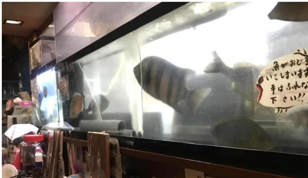
やまがたやスコア