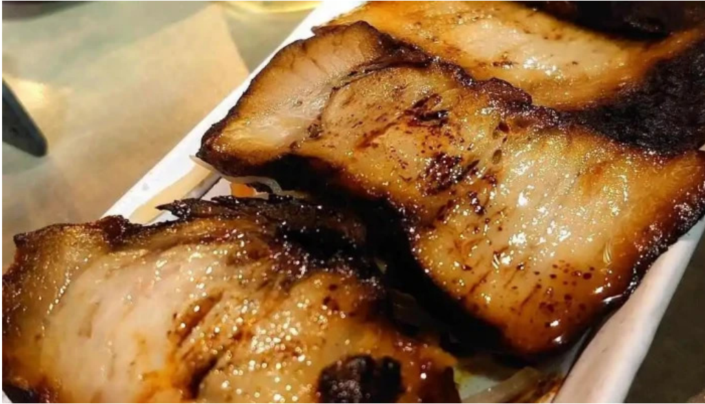
やまがたや 料理飲み物