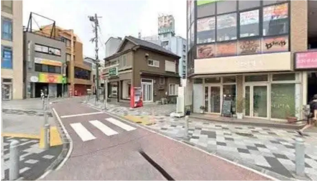
やまがたや さいたま市