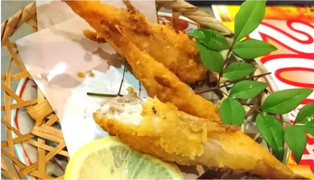
やまがたや 営業時間