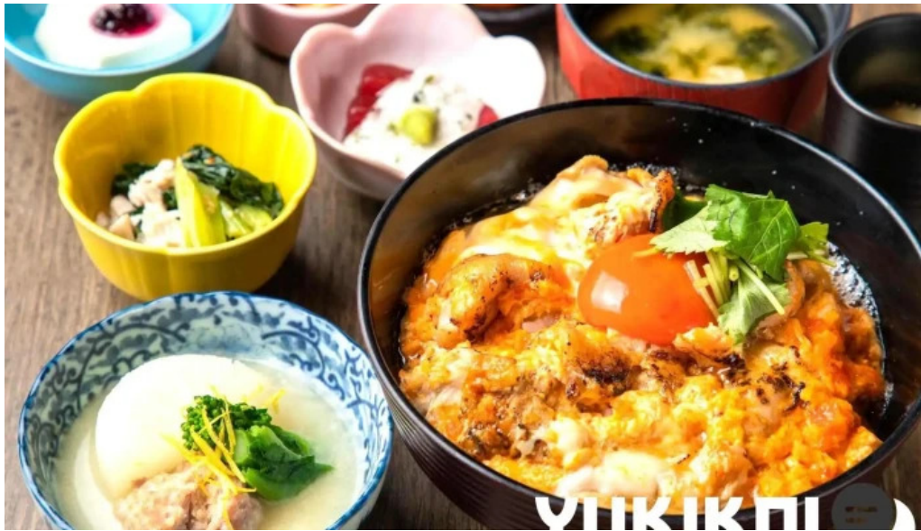
さかえや 浦和パルコ本店 親子丼