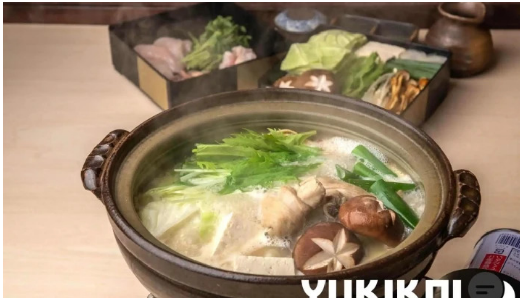
さかえや 浦和パルコ本店 鍋料理