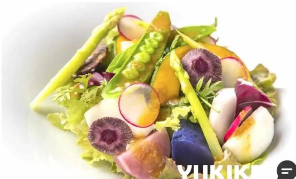
さかえや 浦和パルコ本店 サラダ