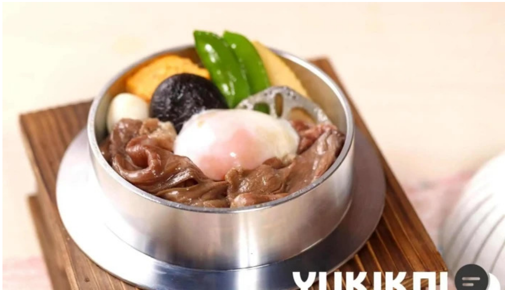
さかえや 浦和パルコ本店 釜飯