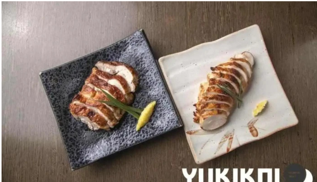
さかえや 浦和パルコ本店 イカ焼き