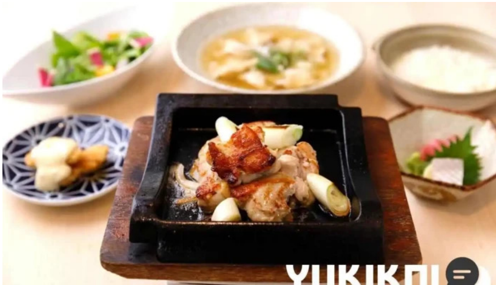
さかえや 浦和パルコ本店 すき焼き