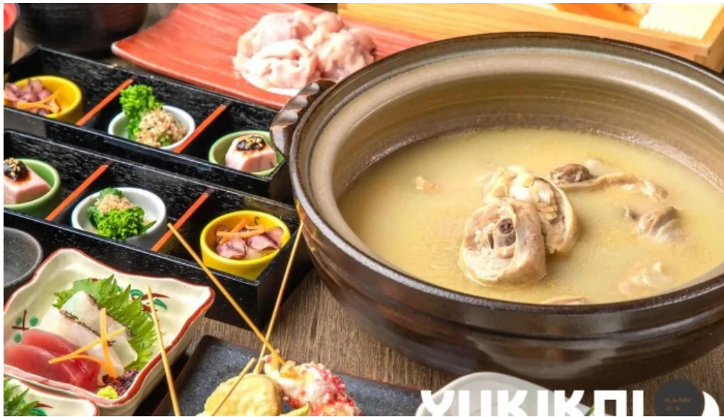
さかえや 浦和パルコ本店 スープ