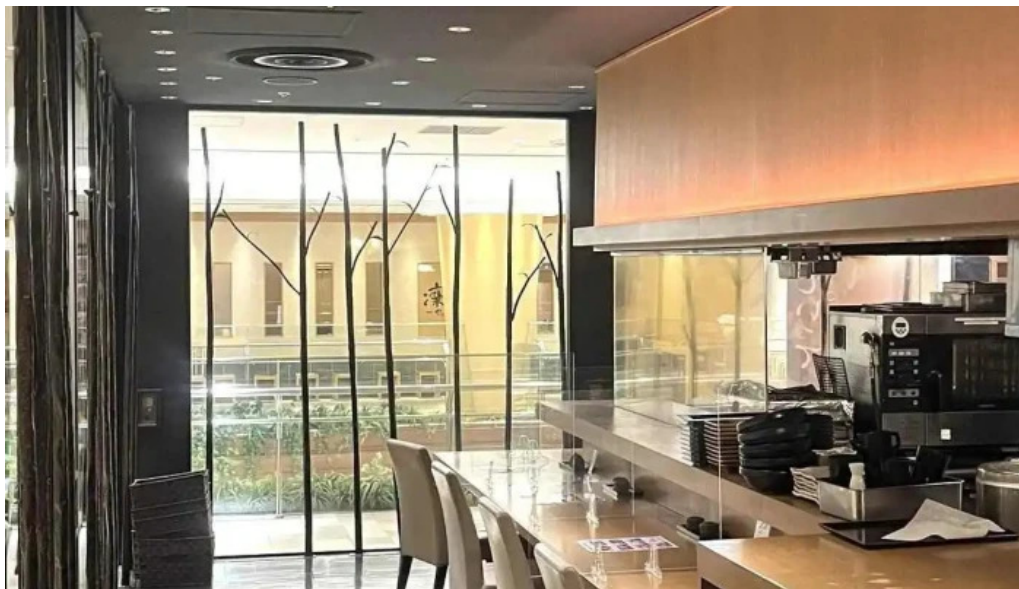
さかえや 浦和パルコ本店 雰囲気