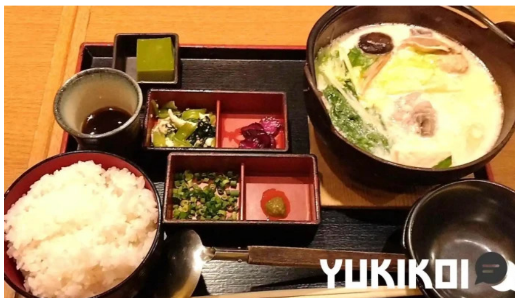
さかえや 浦和パルコ本店 動画