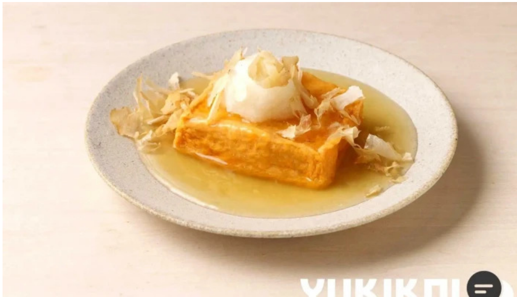
さかえや 浦和パルコ本店 クレープシュゼット