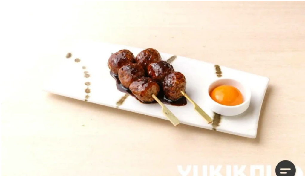
さかえや 浦和パルコ本店 焼き鳥