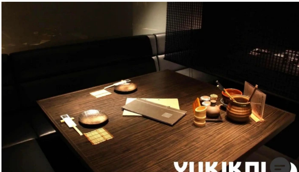
さかえや 浦和パルコ本店 さいたま市