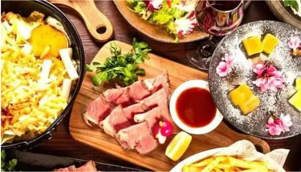
さいたま肉の会 浦和駅前店 オーナー提供