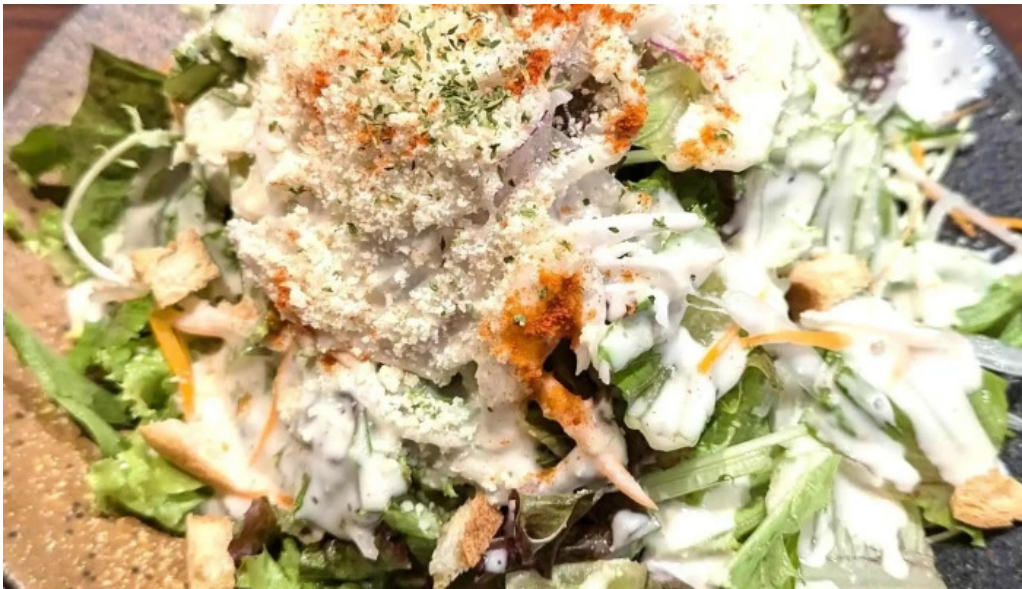
さいたま肉の会 浦和駅前店 エリア