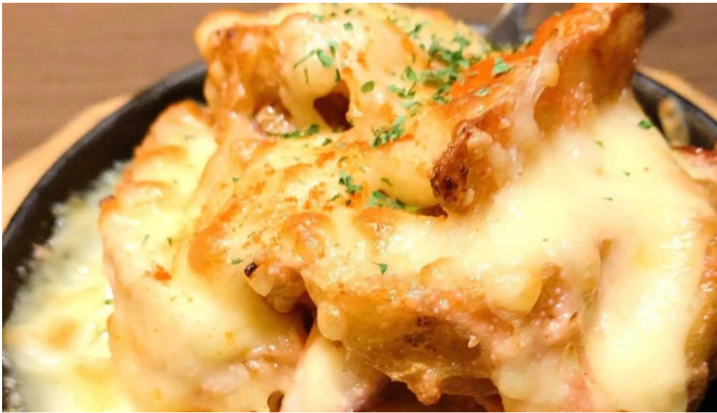
さいたま肉の会 浦和駅前店 割引