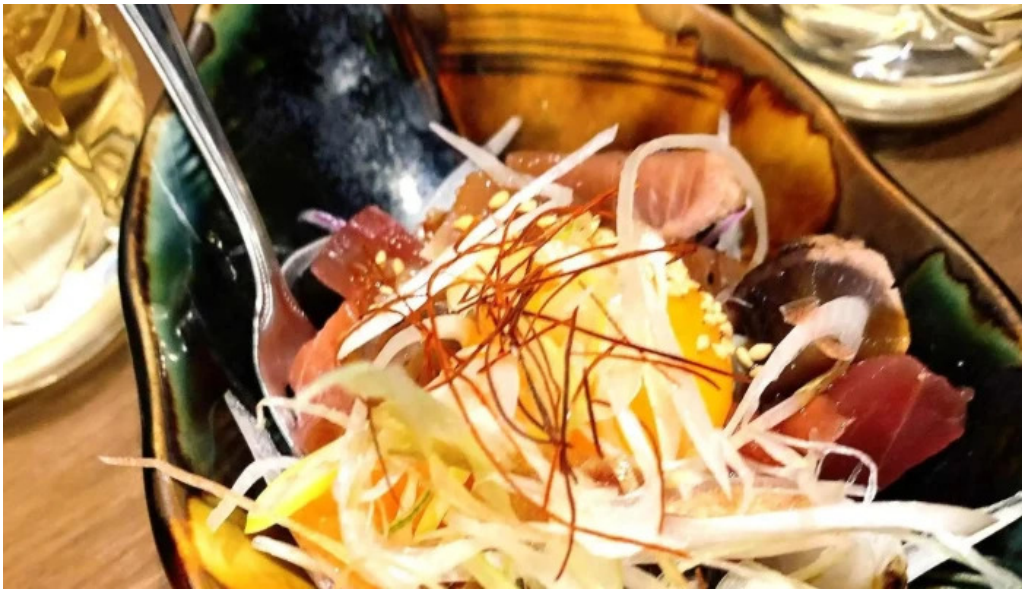
さいたま肉の会 浦和駅前店 スコア