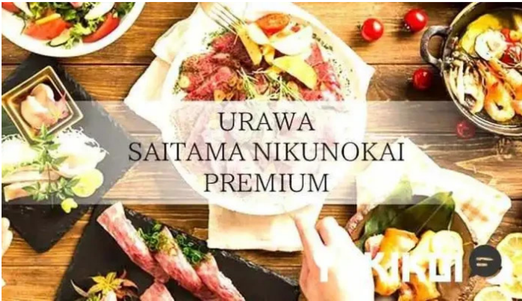
さいたま肉の会 浦和駅前店 料理飲み物