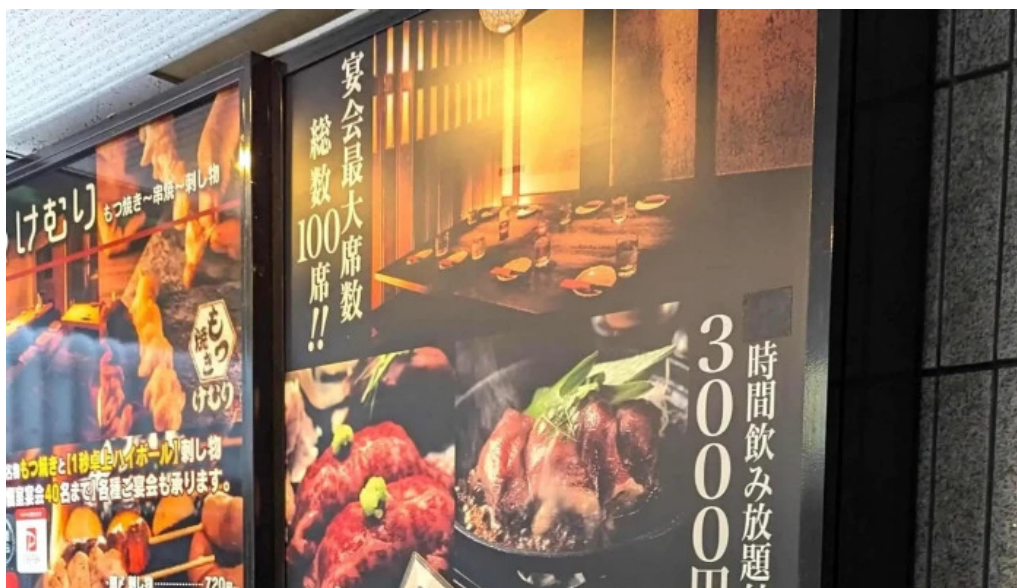
さいたま肉の会 浦和駅前店 電話