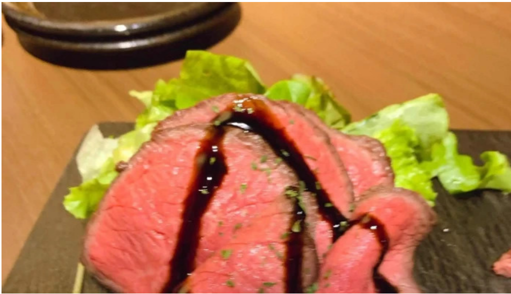
さいたま肉の会 浦和駅前店 ウェブサイト