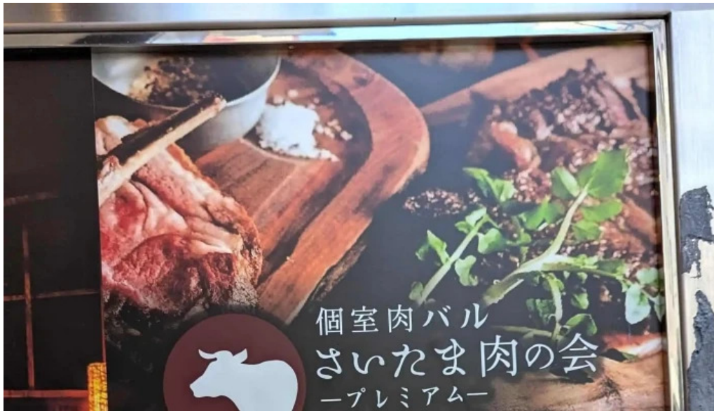
さいたま肉の会 浦和駅前店 instagram