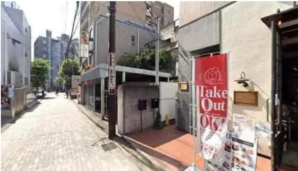
さいたま肉の会 浦和駅前店 さいたま市