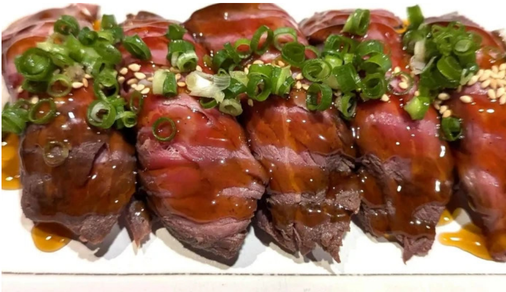
さいたま肉の会 浦和駅前店 営業時間