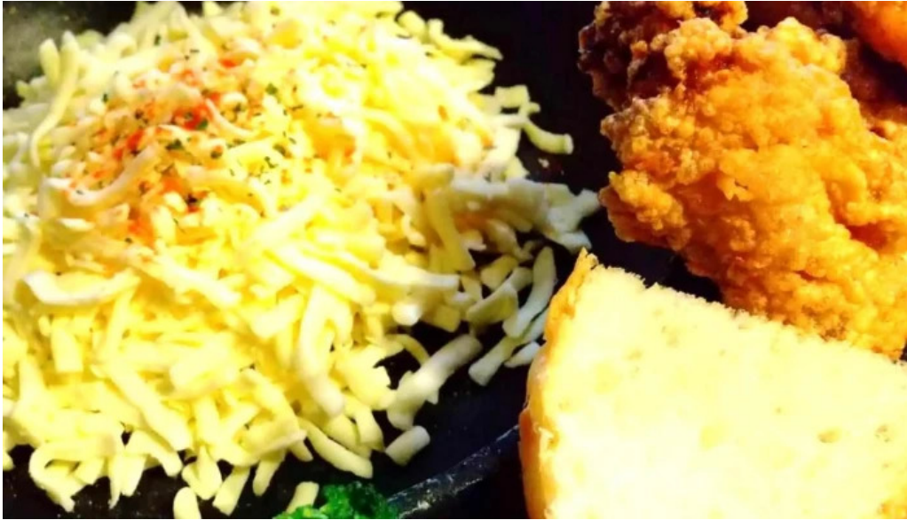
さいたま肉の会 浦和駅前店 番号