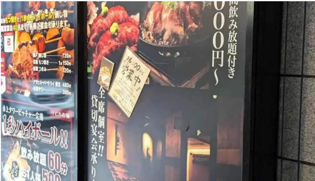
さいたま肉の会 浦和駅前店 メニュー