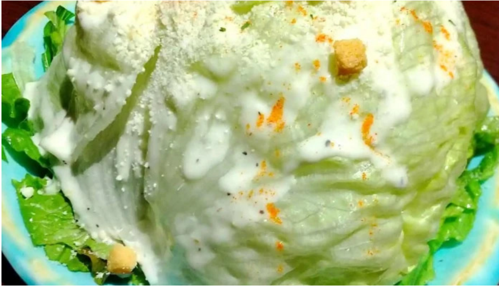
さいたま肉の会 浦和駅前店 プロモーション