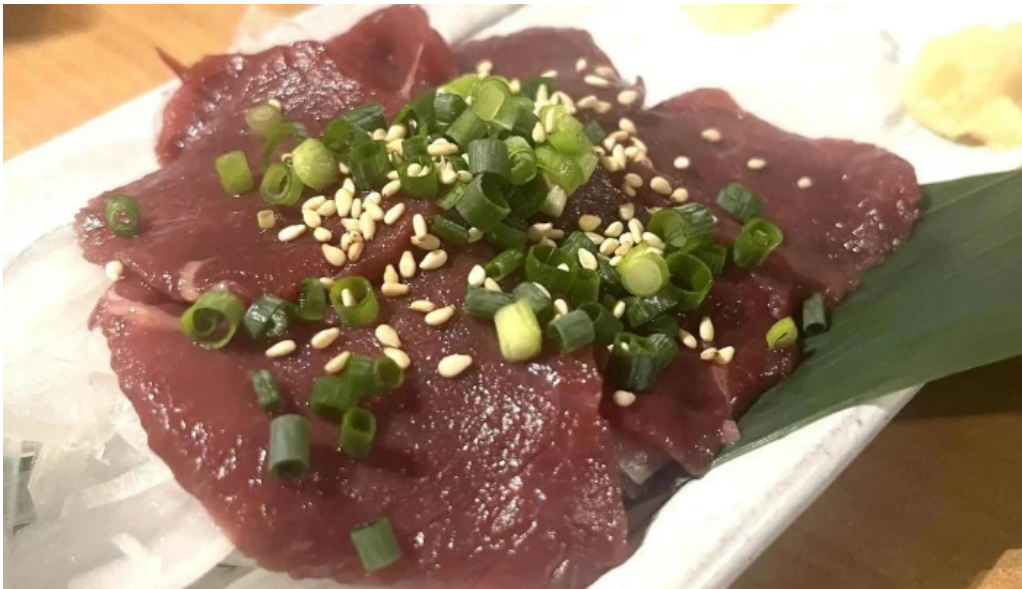
けむり浦和本店 刺身