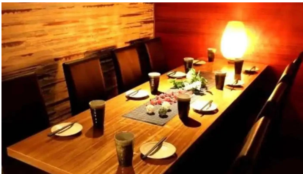
けむり浦和本店 さいたま市