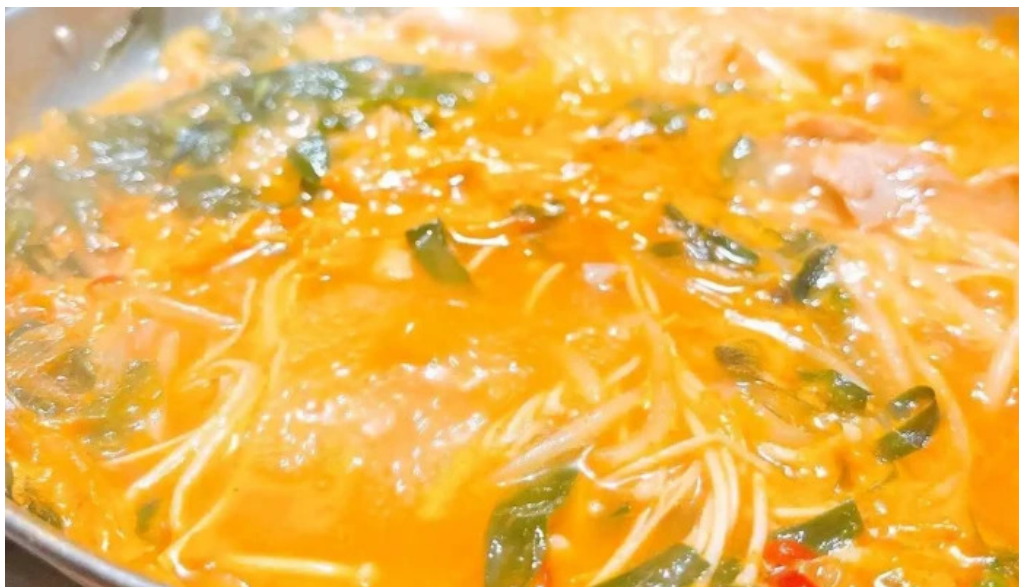
けむり浦和本店 麺