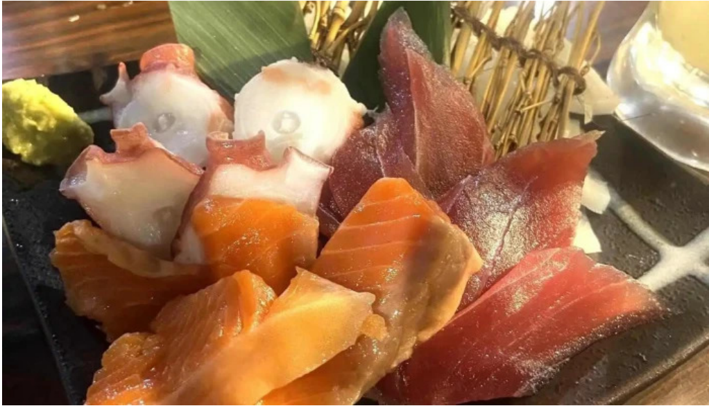
けむり浦和本店 最新