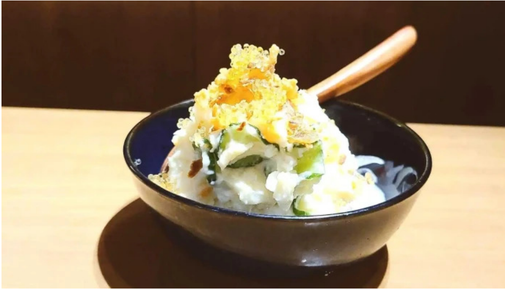
けむり浦和本店 天ぷら