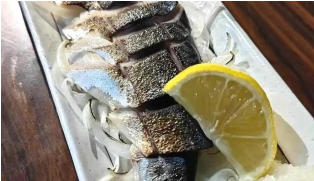
けむり浦和本店 サバ