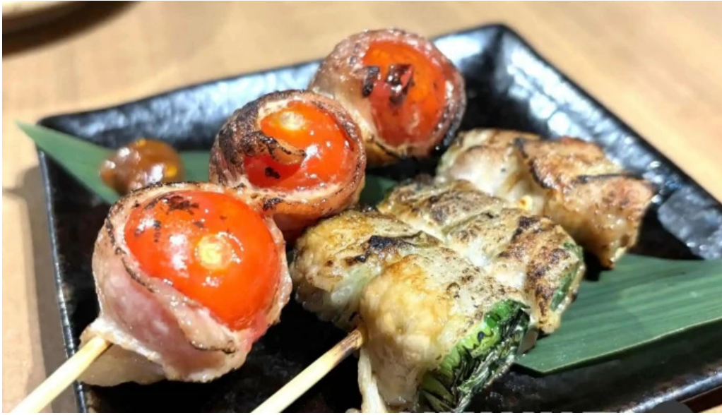
けむり浦和本店 焼き鳥