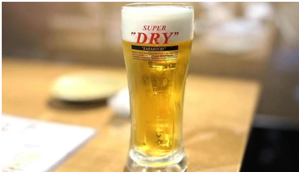
けむり浦和本店 ビール