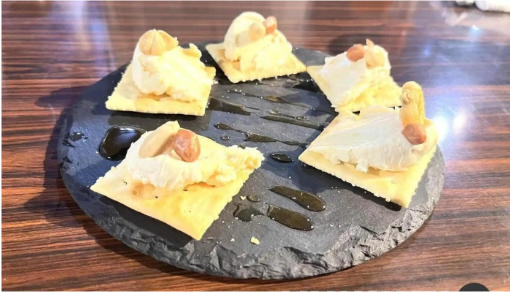
けむり浦和本店 チーズ