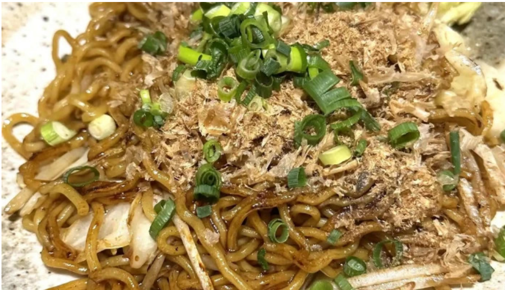
けむり浦和本店 焼きそば