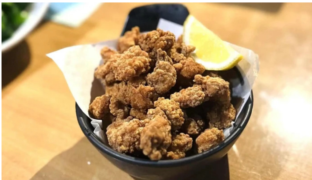
けむり浦和本店 から揚げ