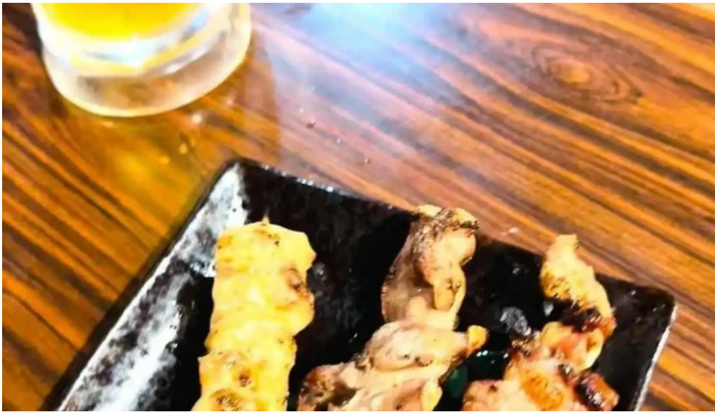
けむり浦和本店 動画