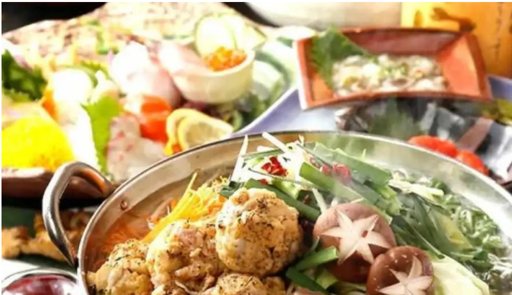
けむり浦和本店 料理飲み物