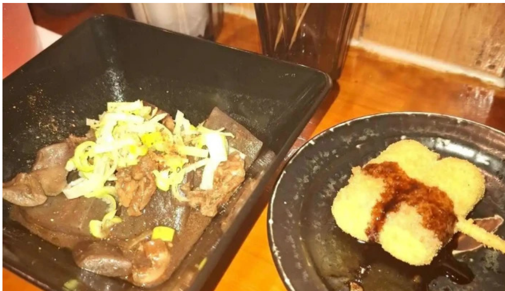
あわら温泉屋台村 湯けむり横丁 最新