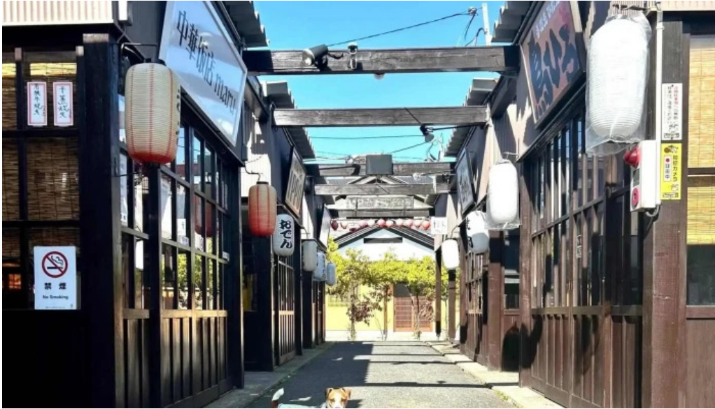
あわら温泉屋台村 湯けむり横丁 comentario 6