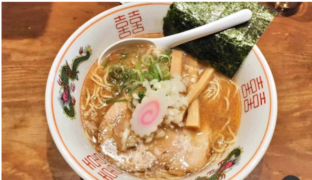
あわら温泉屋台村 湯けむり横丁 料理飲み物