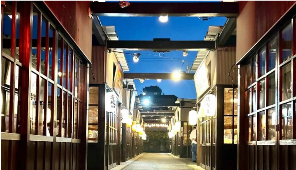
あわら温泉屋台村 湯けむり横丁 comentario 5