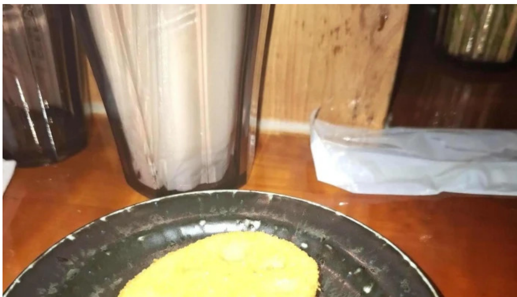
あわら温泉屋台村 湯けむり横丁 comentario 2