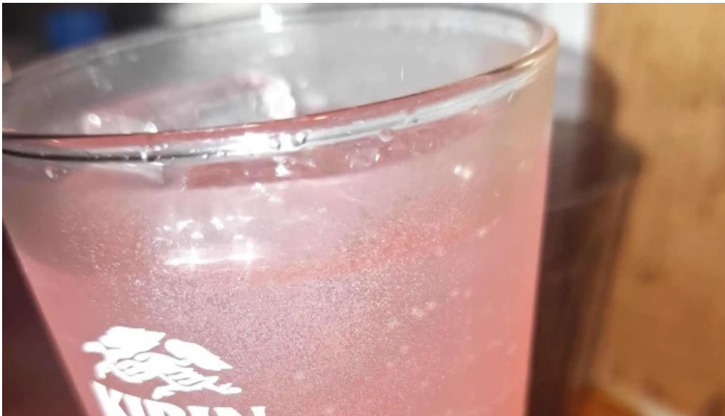
あわら温泉屋台村 湯けむり横丁 comentario 3