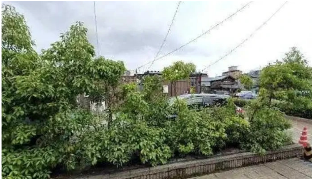
あわら温泉屋台村 湯けむり横丁 ストリートビューと 360 ビュー