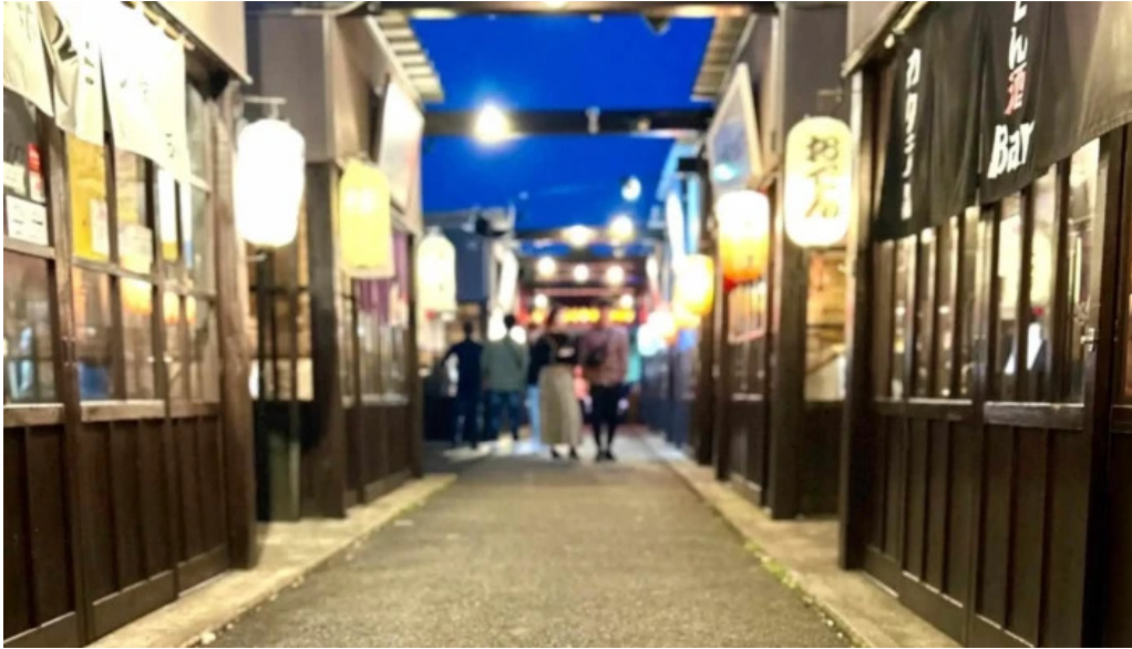
あわら温泉屋台村 湯けむり横丁 comentario 4