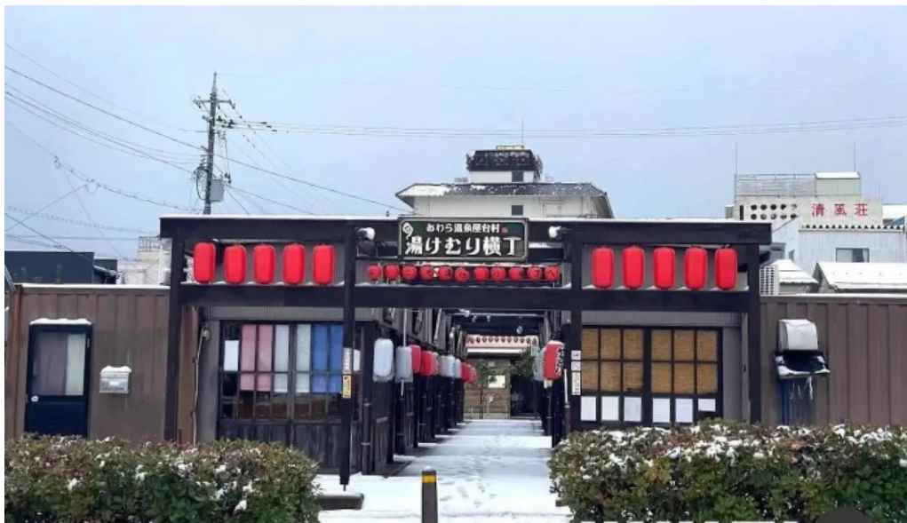
あわら温泉屋台村 湯けむり横丁 あわら市