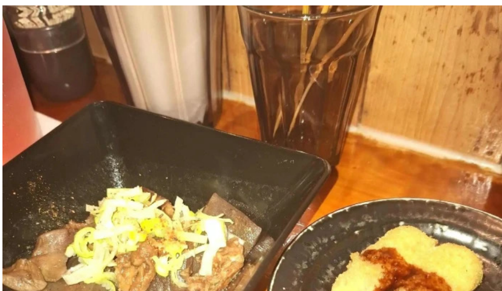
あわら温泉屋台村 湯けむり横丁 comentario 1