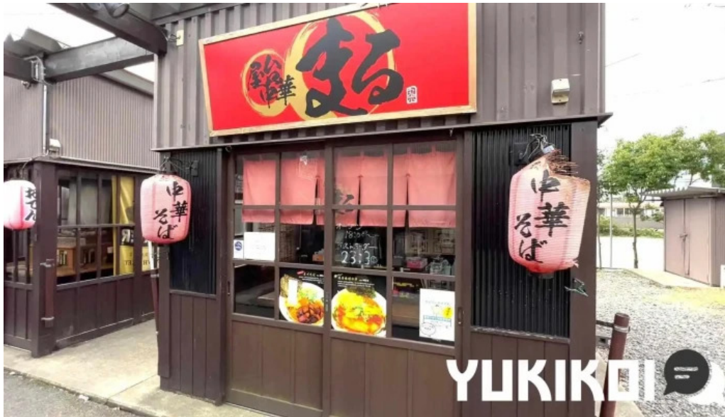
あわら温泉屋台村 湯けむり横丁 動画