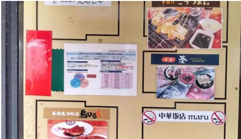
あわら温泉屋台村 湯けむり横丁 メニュー