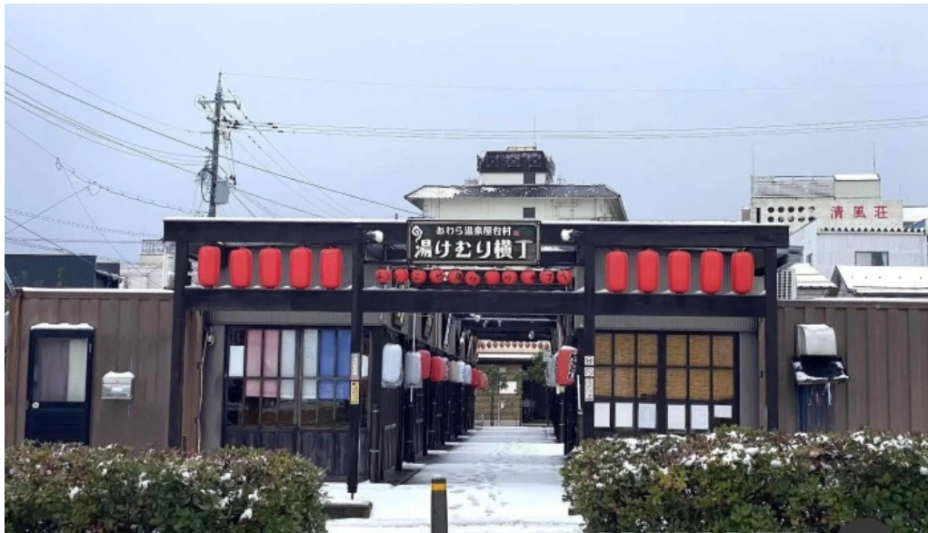
あわら温泉屋台村 湯けむり横丁 すべて