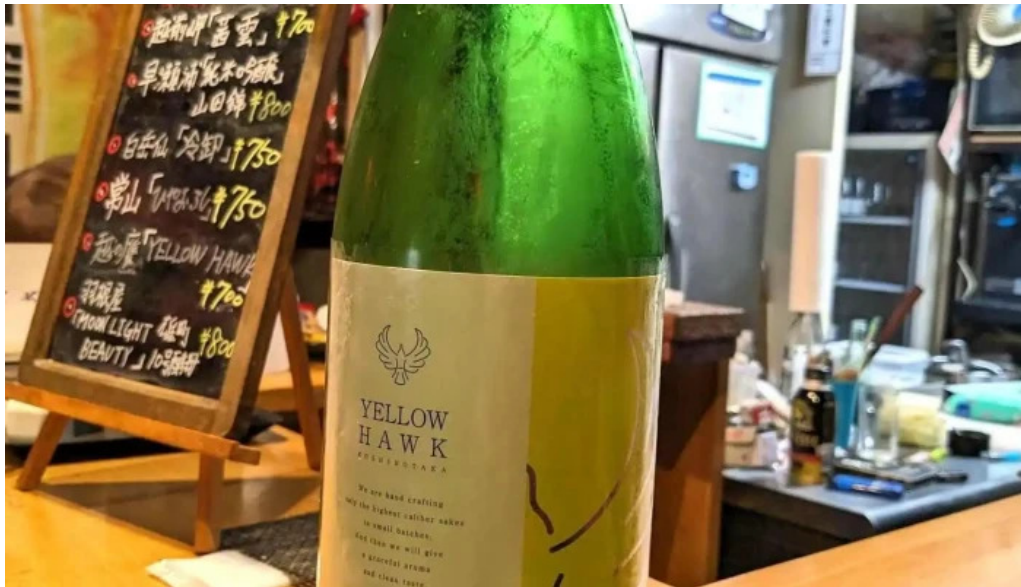
あわら温泉屋台村 湯けむり横丁 日本酒