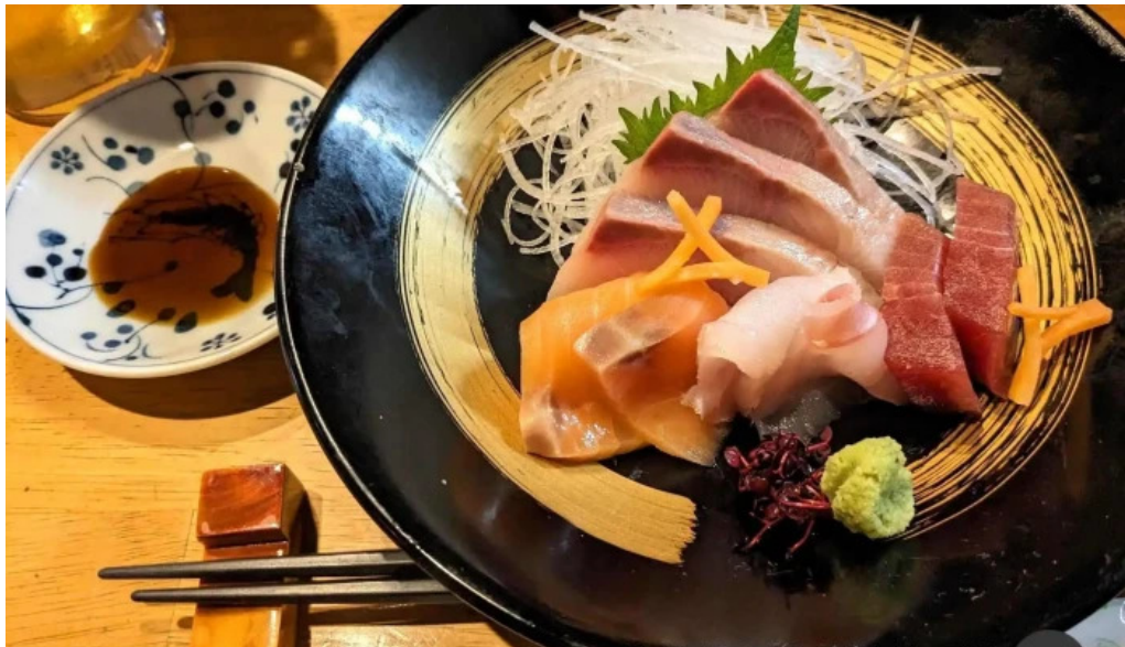
あわら温泉屋台村 湯けむり横丁 刺身