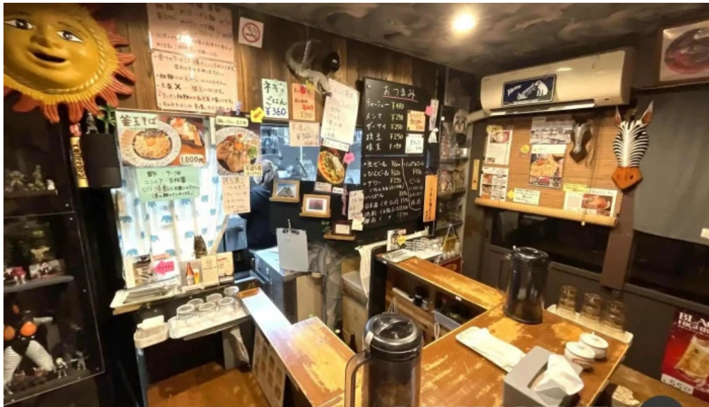
あわら温泉屋台村 湯けむり横丁 雰囲気