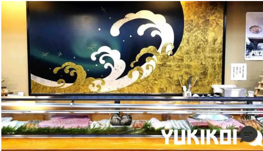
本店 加賀 彌助 金沢市