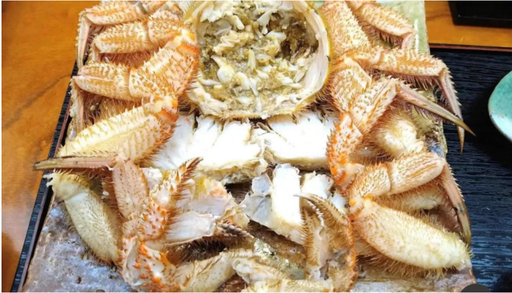
本店 加賀 彌助 ケガ二