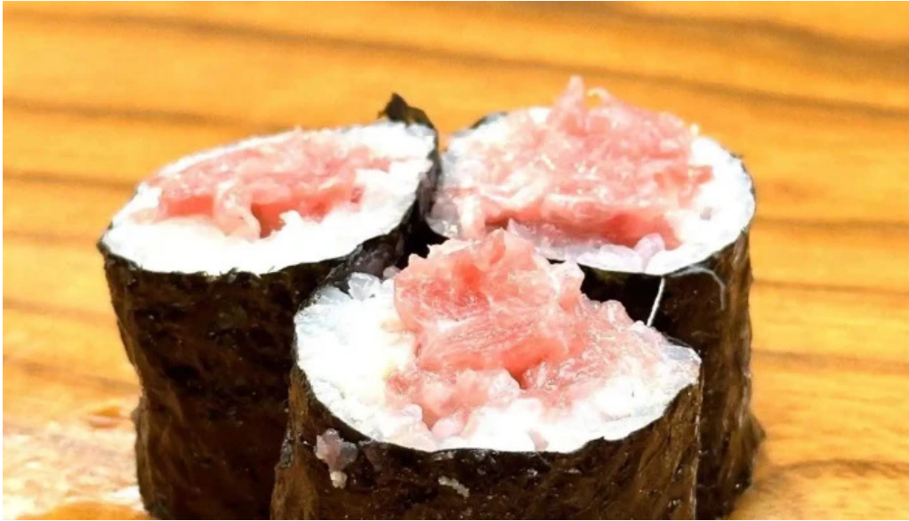
本店 加賀 彌助 最新