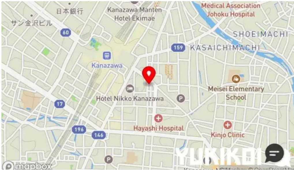
本店 加賀 彌助 地図