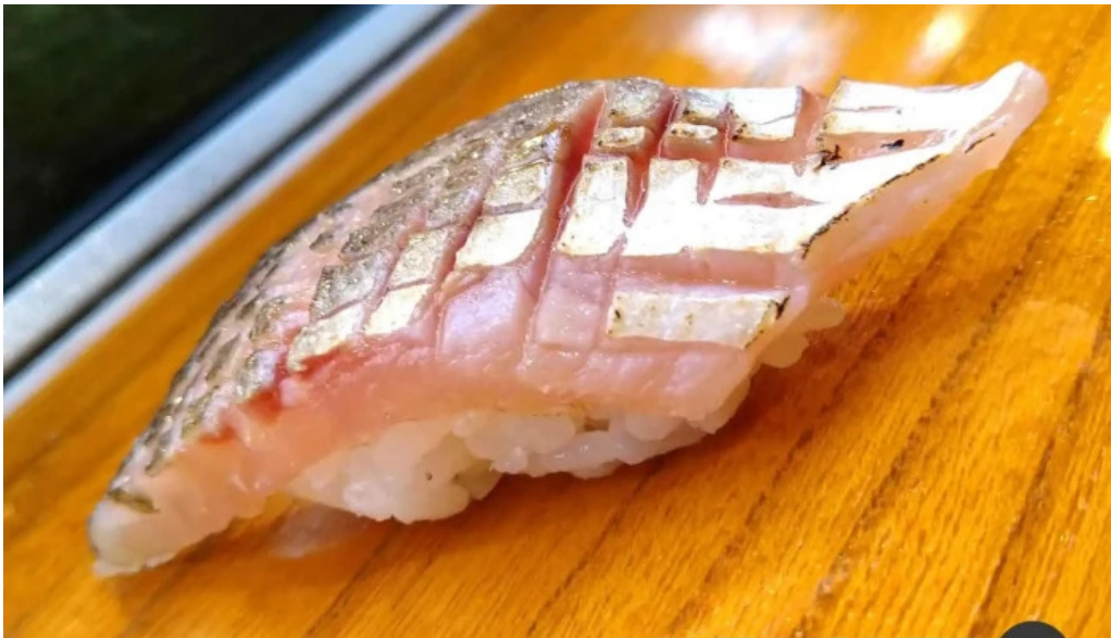
本店 加賀 彌助 寿司