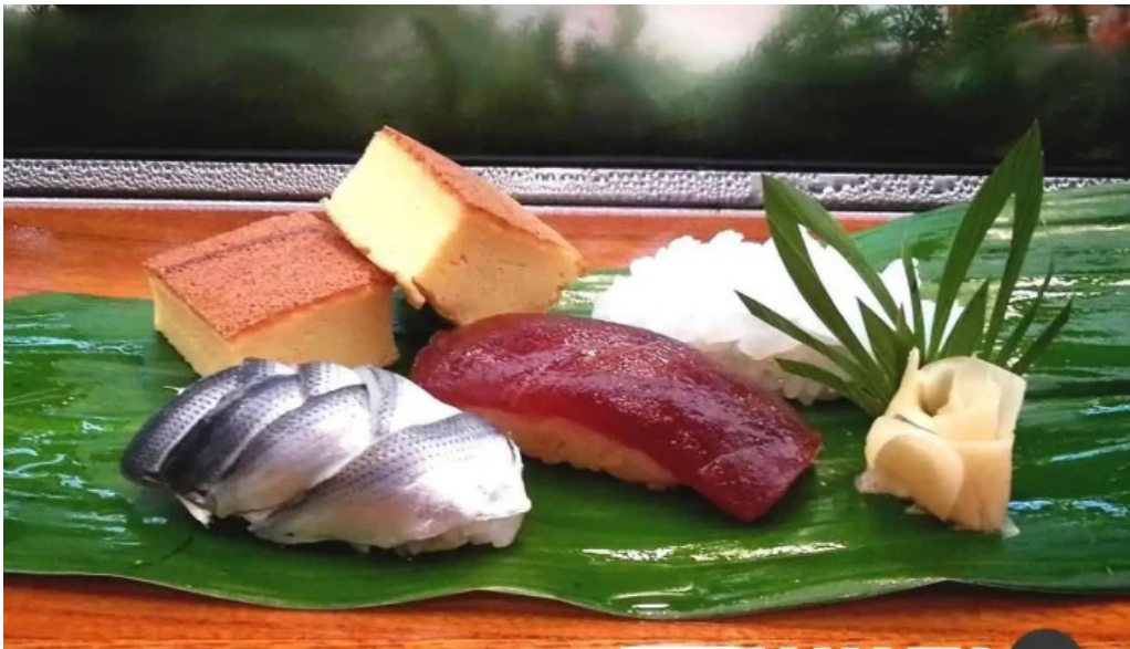
本店 加賀 彌助 刺身