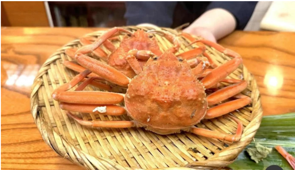
本店 加賀 彌助 カ二