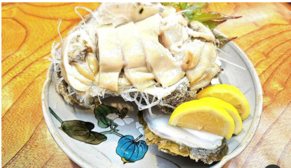
本店 加賀 彌助 カキ