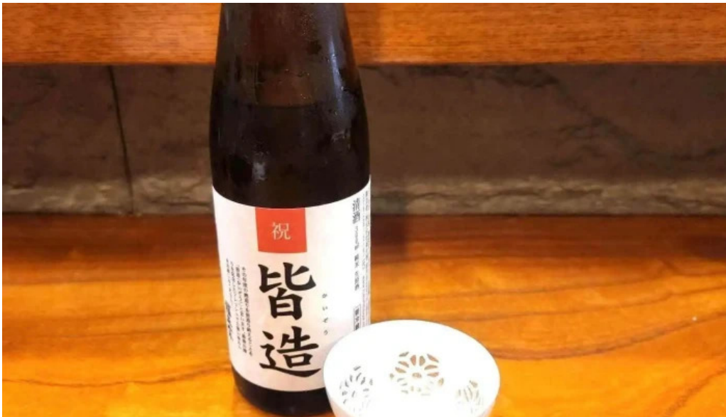
本店 加賀 彌助 日本酒