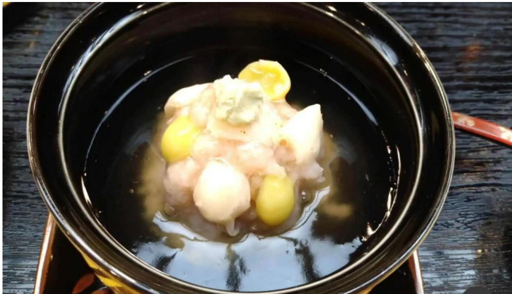
本店 加賀 彌助 点心