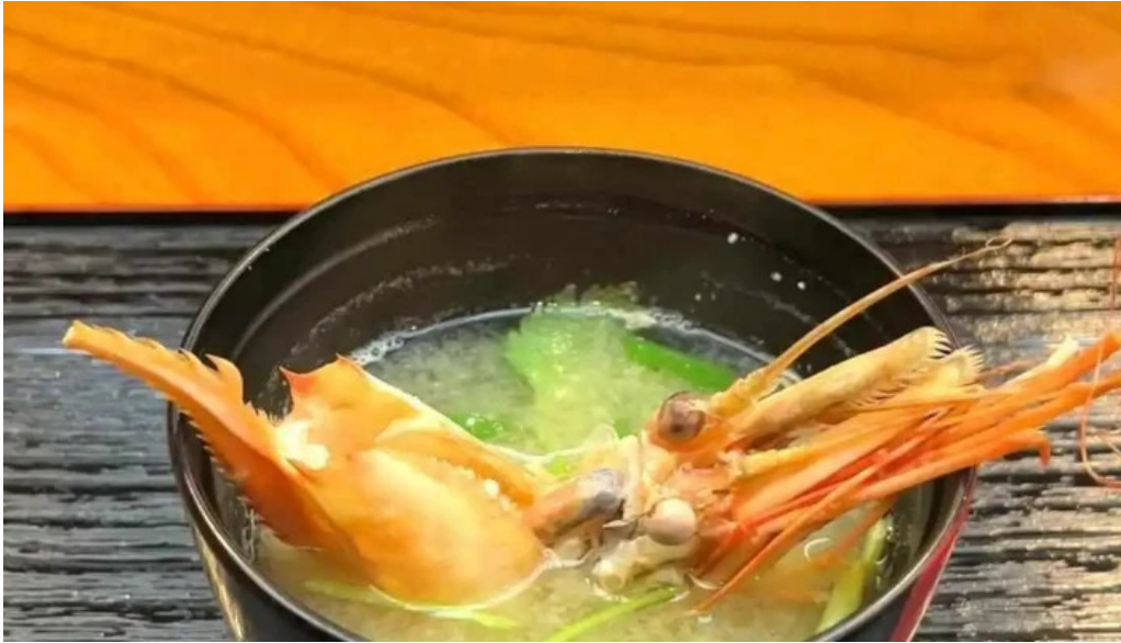
本店 加賀 彌助 動画