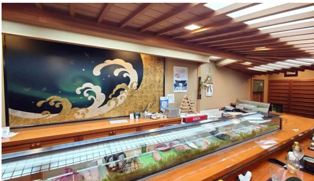
本店 加賀 彌助 雰囲気