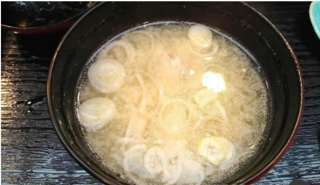
本店 加賀 彌助 味噌汁