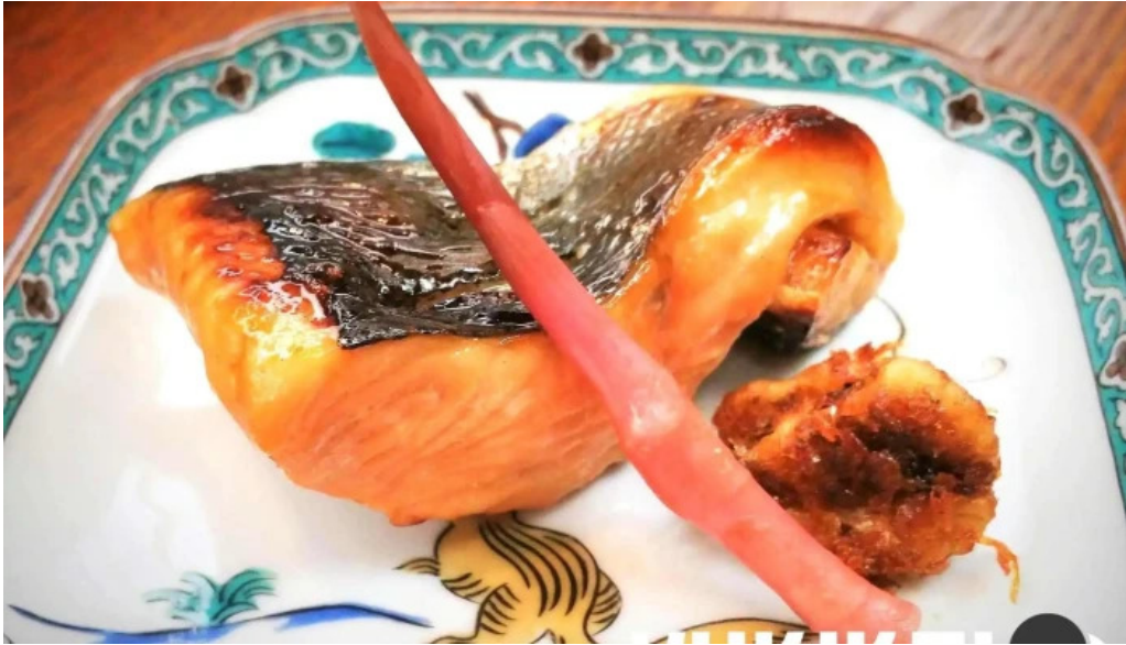
本店 加賀 彌助 料理飲み物