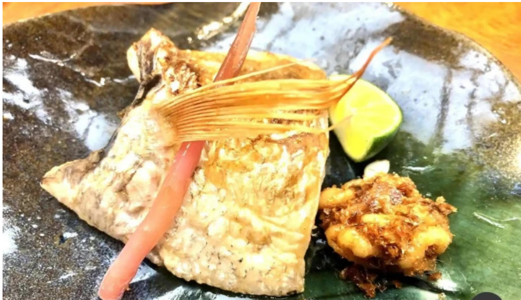
本店 加賀 彌助 サバ