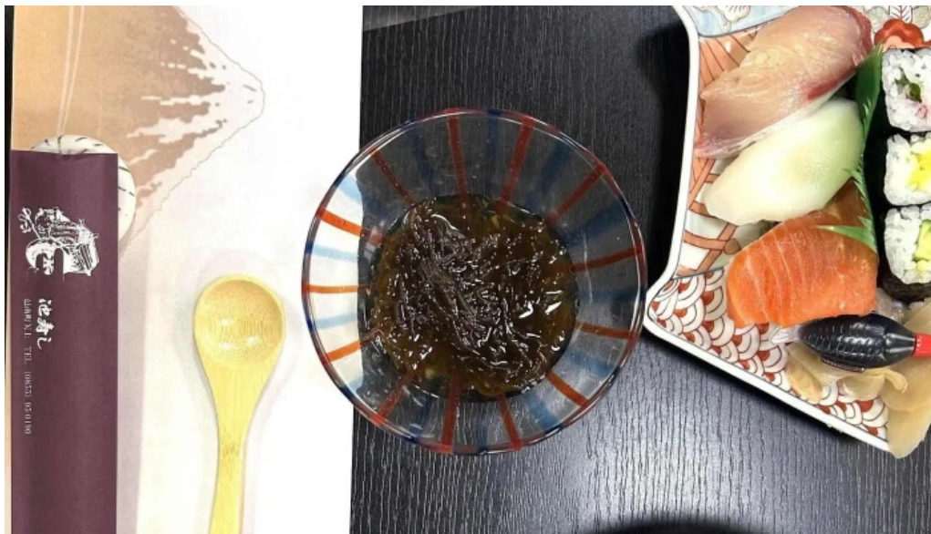
池寿し comentario 1