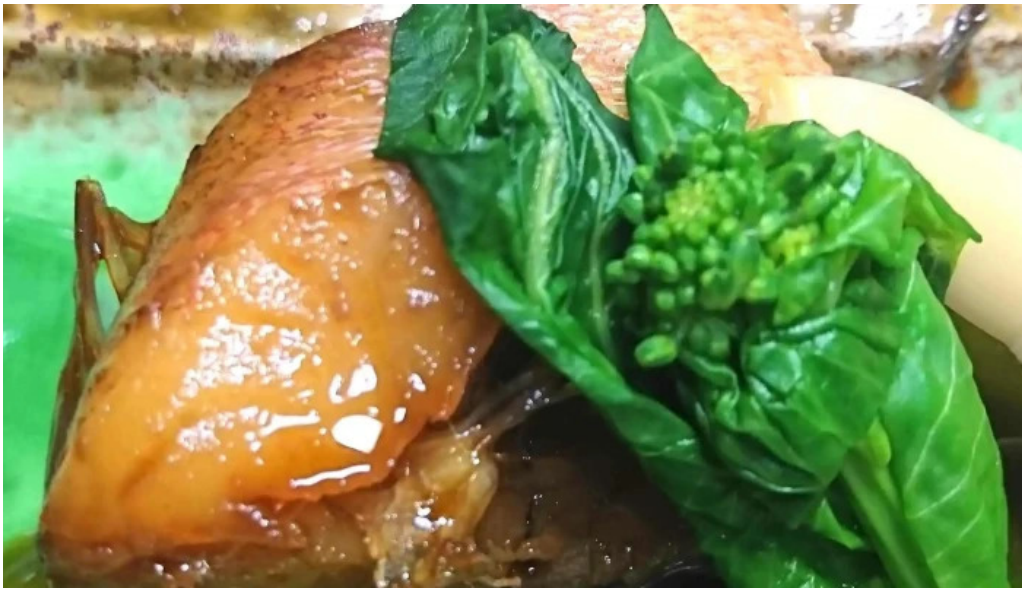
池寿し comentario 6