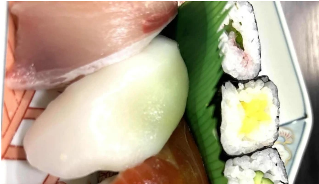
池寿し comentario 4