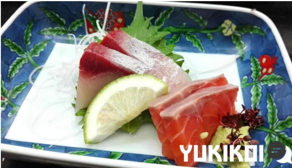
池寿し 料理飲み物