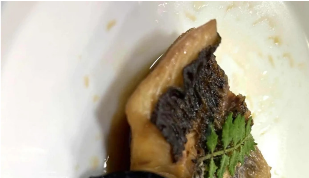
池寿し comentario 3