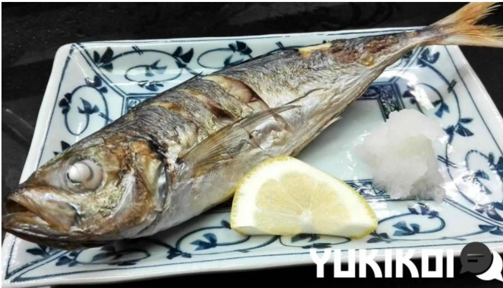
池寿し シーフード