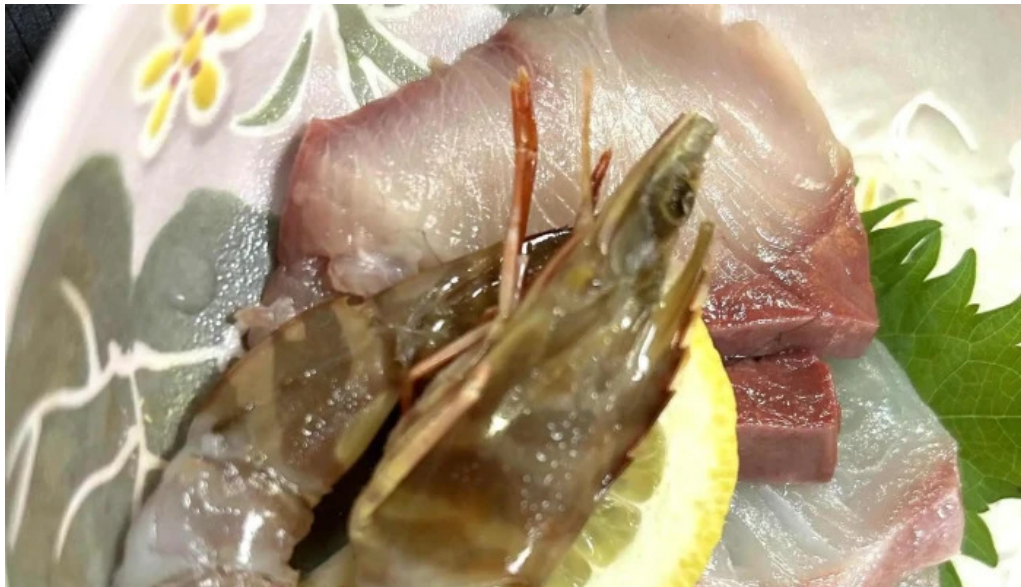
池寿し comentario 2