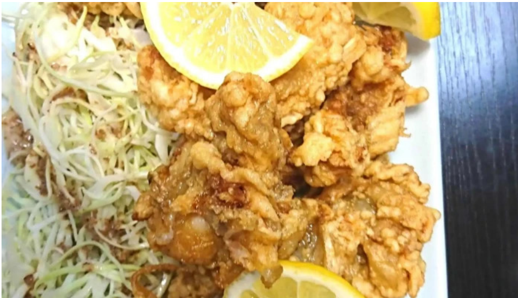
池寿し comentario 5