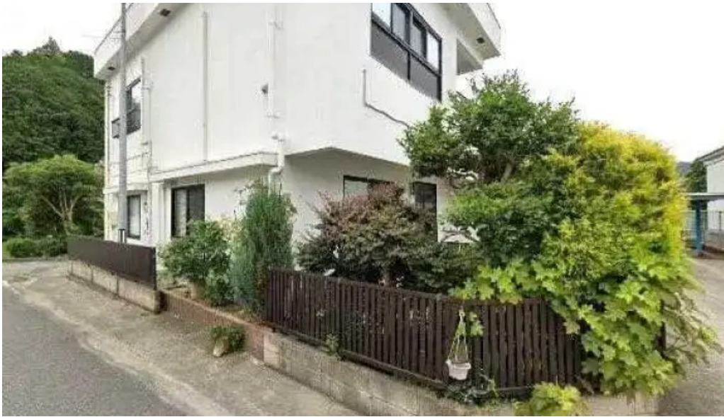
池寿し ストリートビューと 360 ビュー