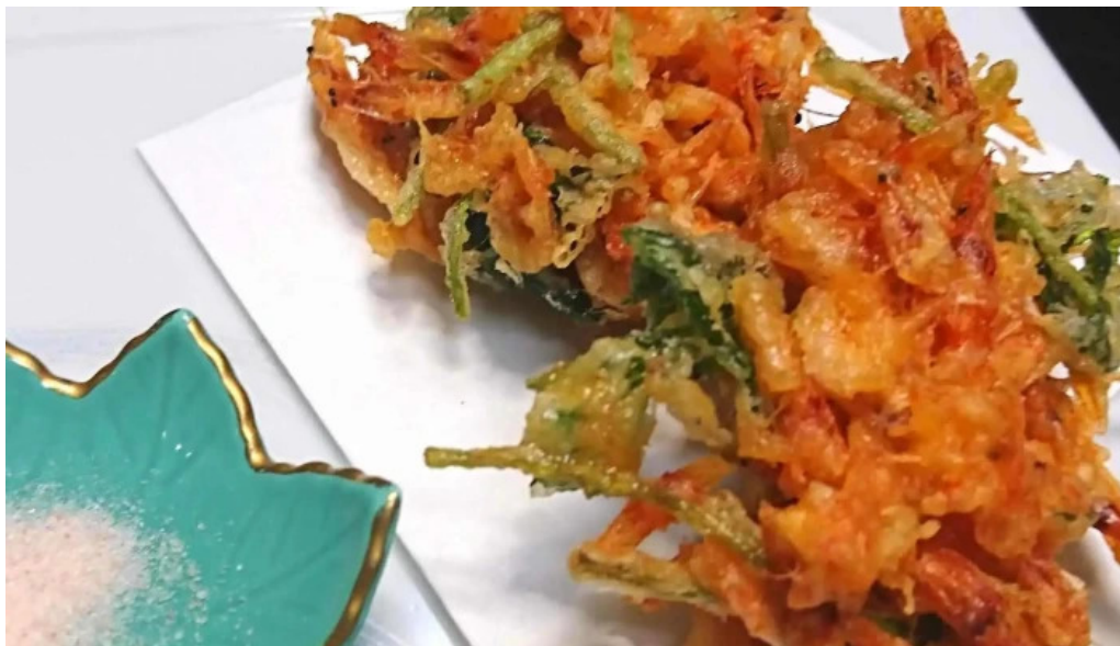
池寿し comentario 7