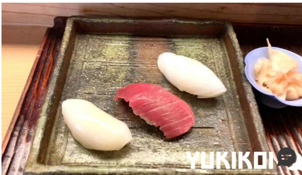
味楽留 料理飲み物