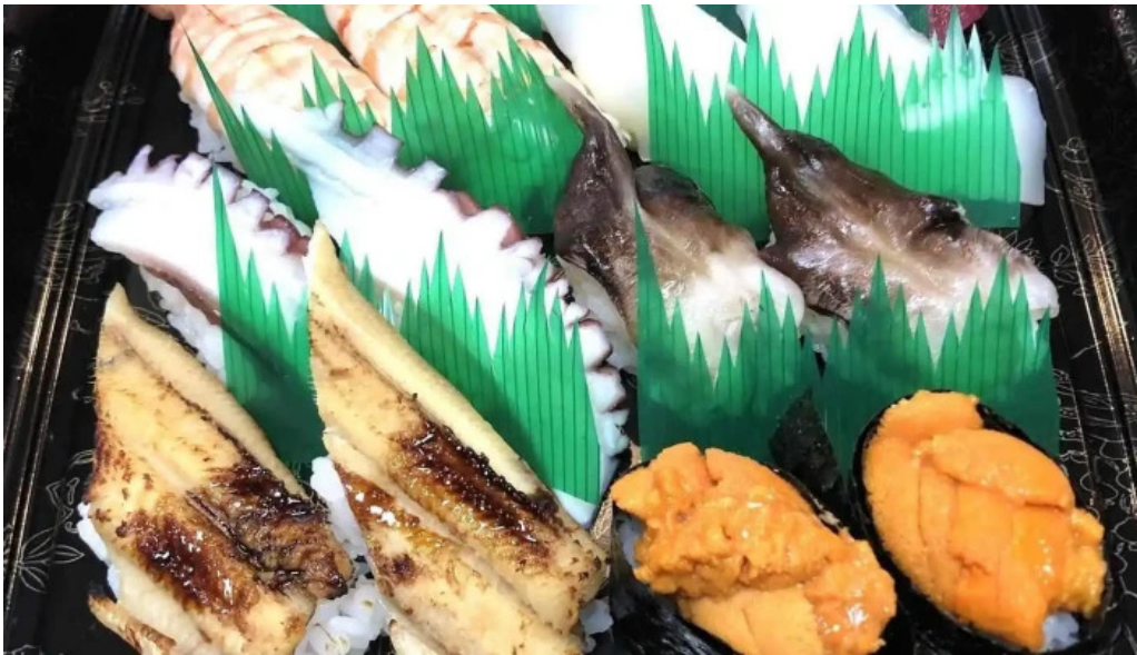
がん太鯨 料理飲み物