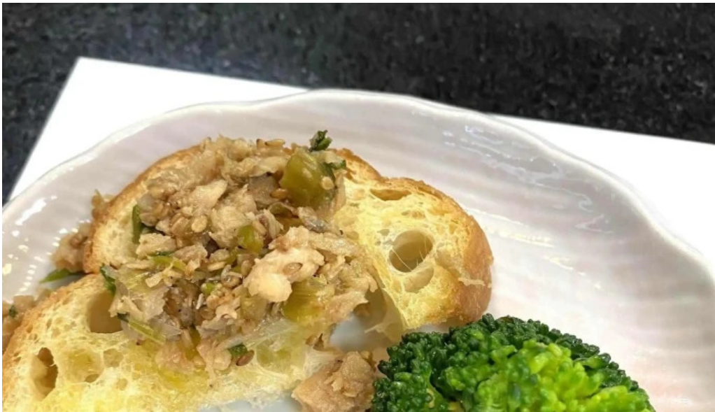
がん太鯧 カタログ