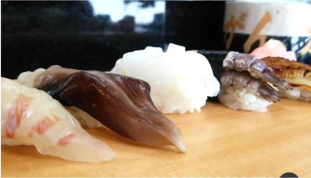
がん太鯧 シーフード