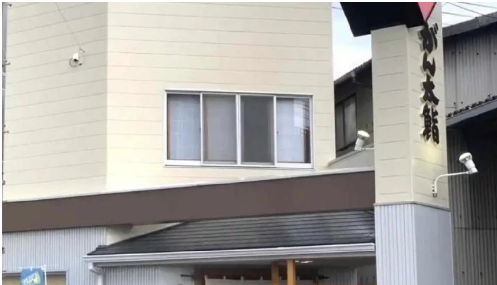
がん太鰯