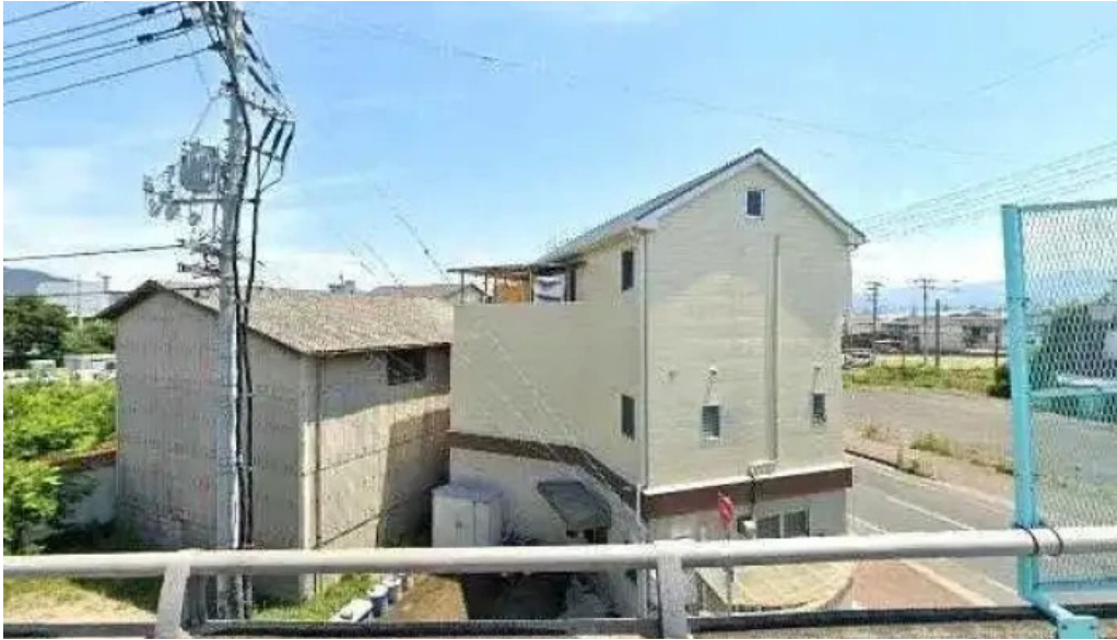
がん太鯨 観音寺市