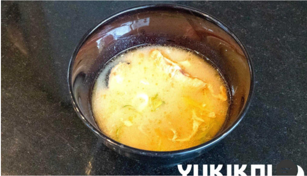
Qi dainingu Yue Wei Cheng Zhi