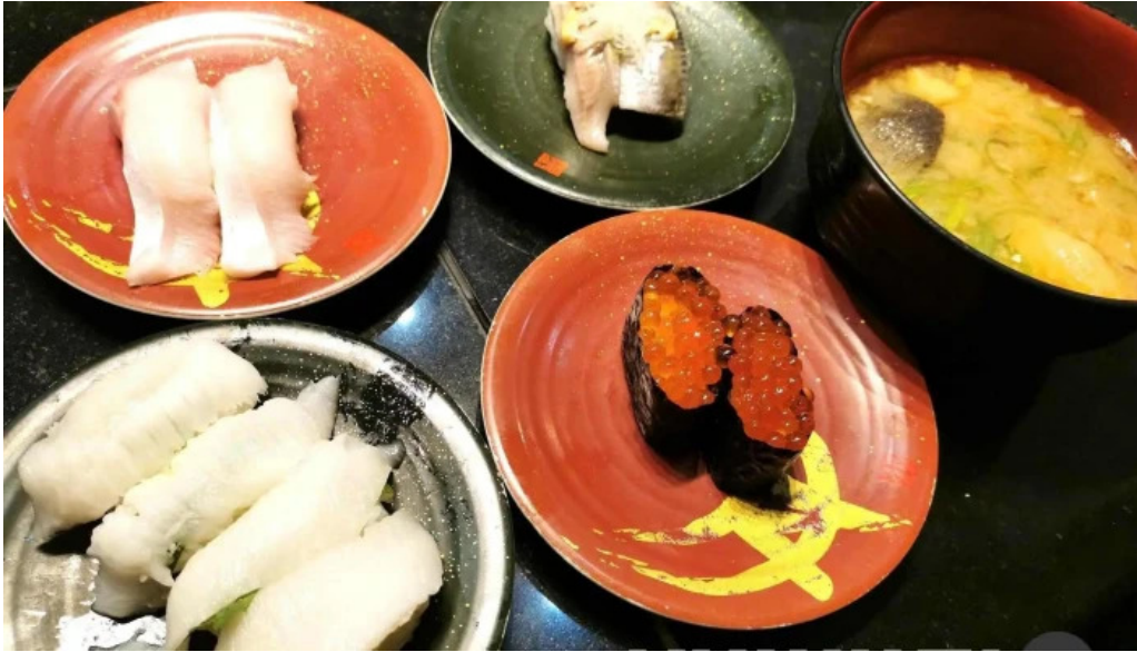
Qi dainingu Yue su pu