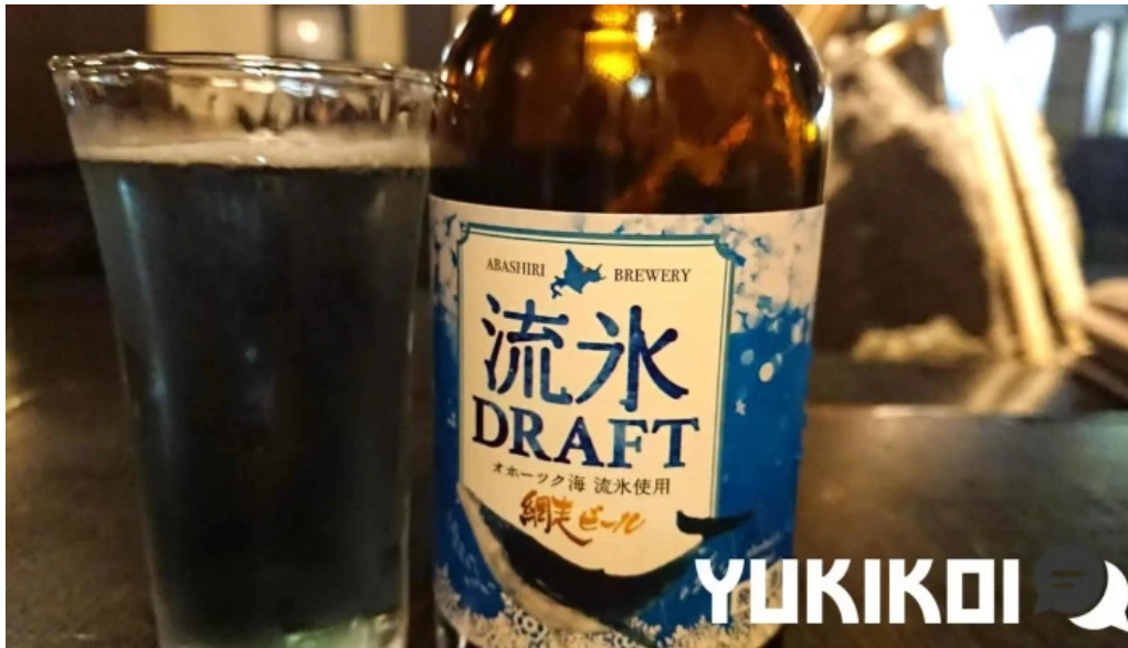
Qi dainingu Yue bi ru