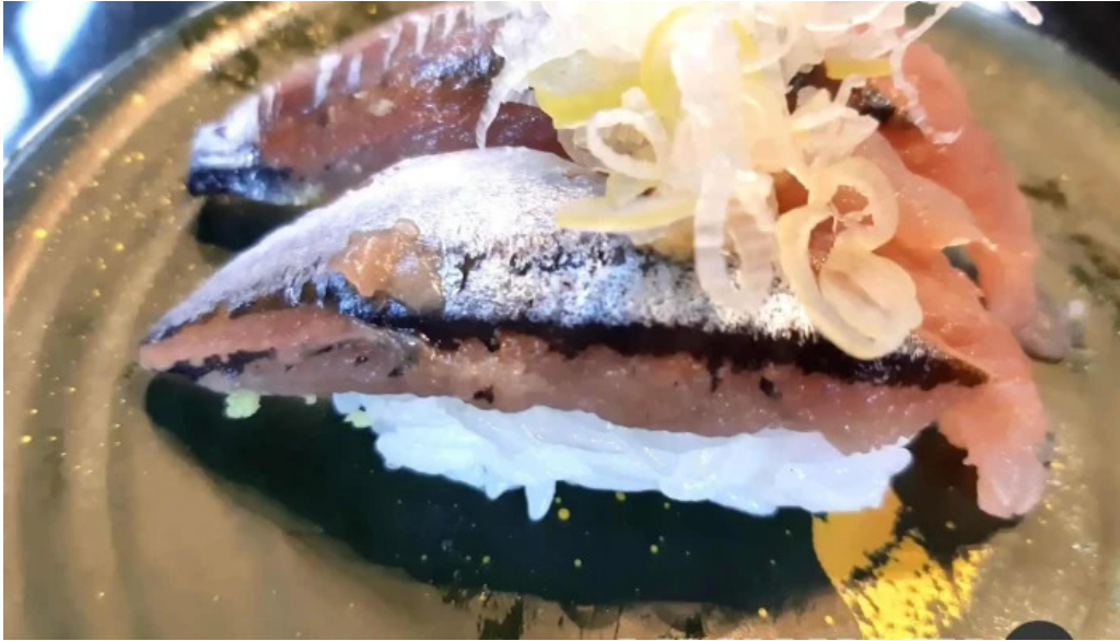
Qi dainingu Yue saba