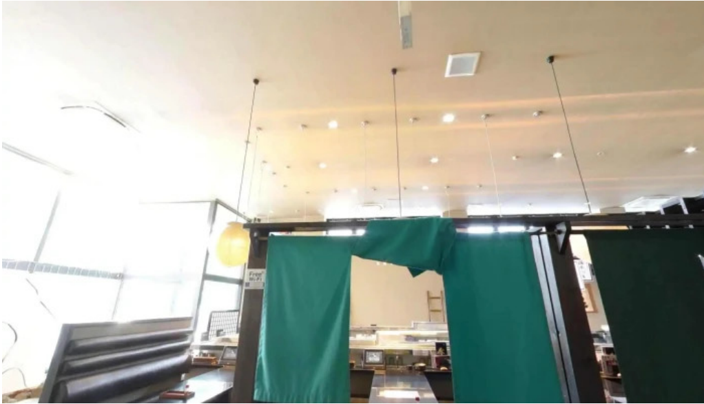
Qi dainingu Yue sutori tobiyu to 360 biyu