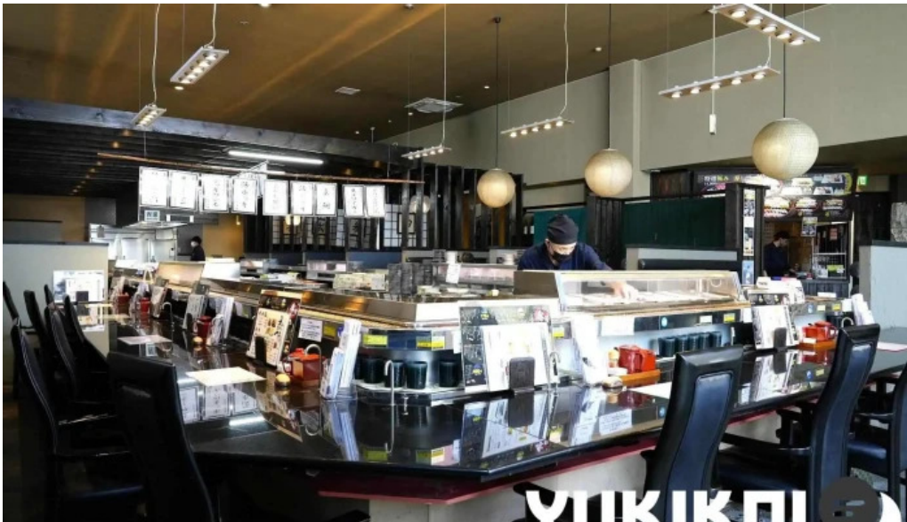
Qi dainingu Yue Fen Wei Qi