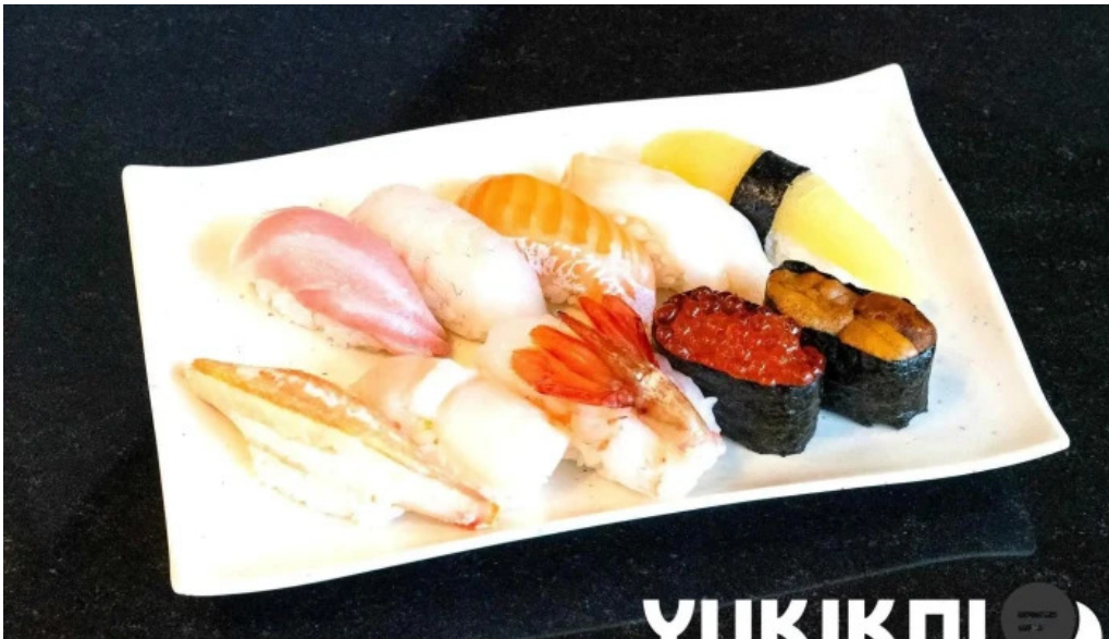
Qi dainingu Yue Liao Li Yin miWu