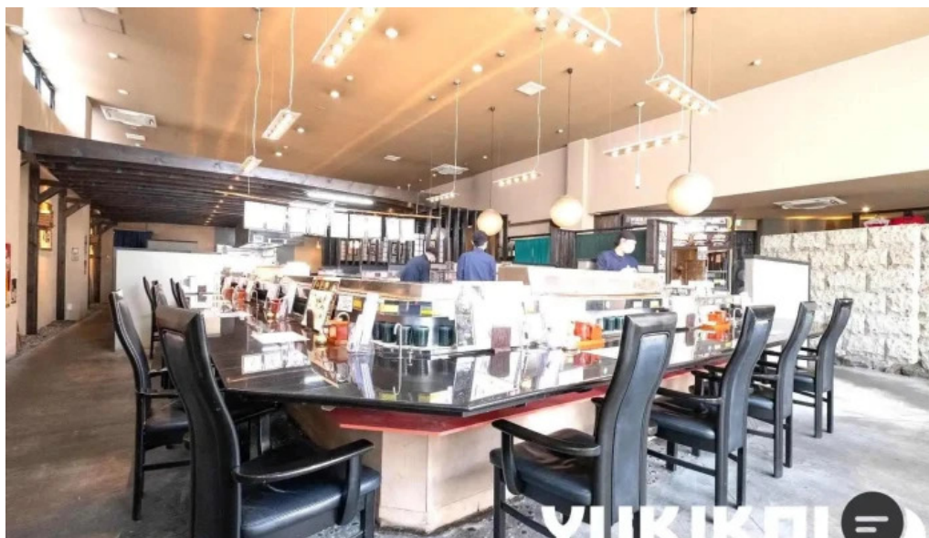
鮭ダイニング 月 網走市