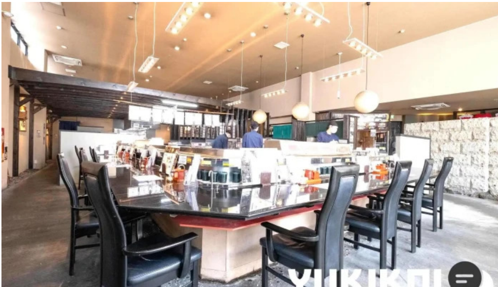
Qi dainingu Yue subete