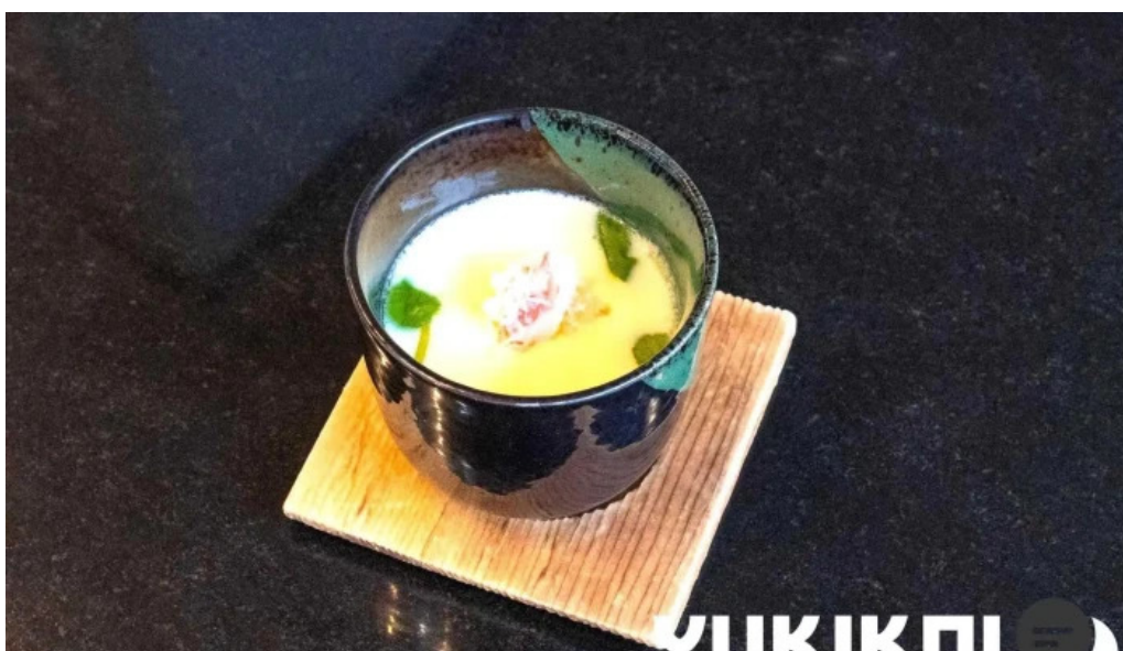
Qi dainingu Yue Cha Wan Zheng shi