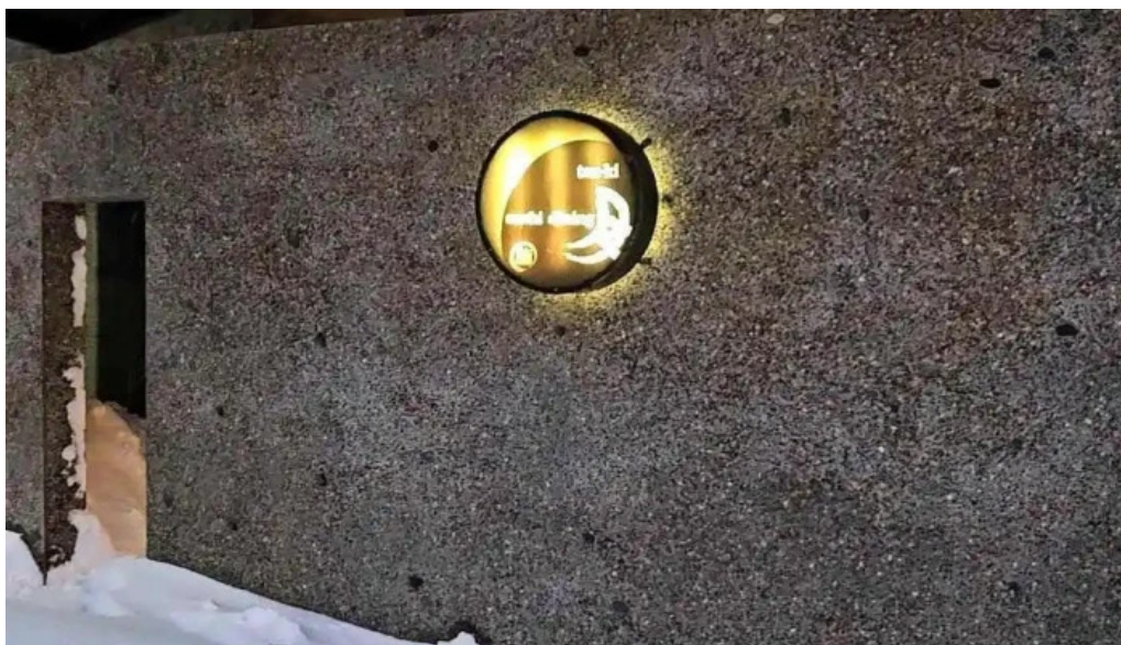
Qi dainingu Yue Dong Hua