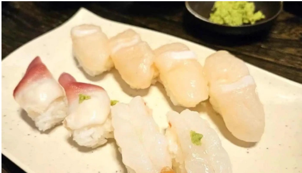
Qi dainingu Yue aburasokomutsu