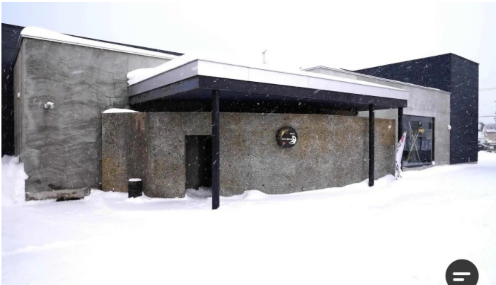
Qi dainingu Yue o na Ti Gong