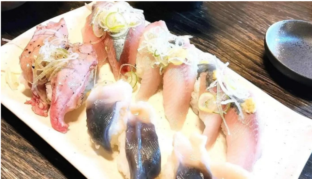
Qi dainingu Yue Shou Si