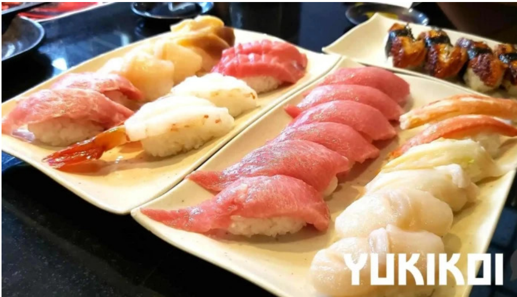
Qi dainingu Yue shi hu do