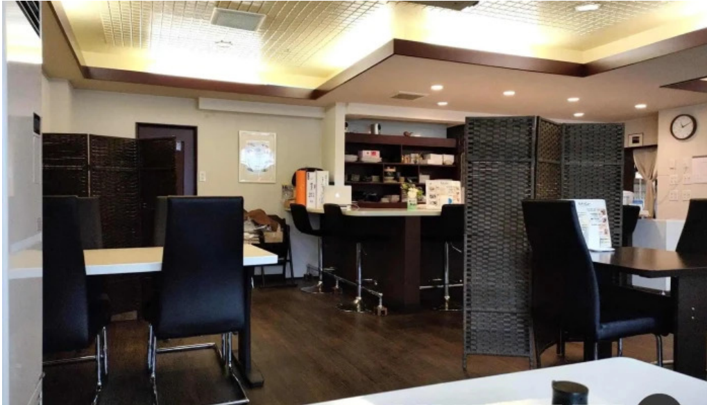
Qi restaurant nabe Fen Wei Qi