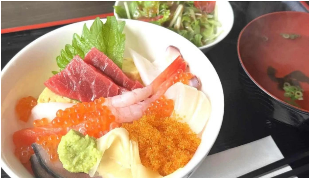
Qi restaurant nabe comentario 2