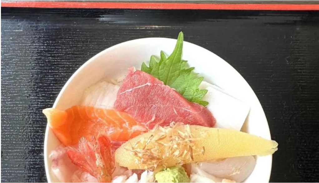
Qi restaurant nabe comentario 1