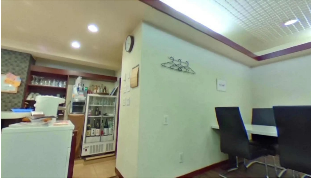
Qi restaurant nabe sutori tobiyu to 360 biyu