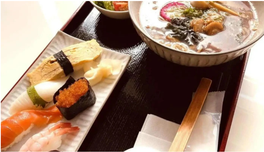
Qi restaurant nabe Shou Si