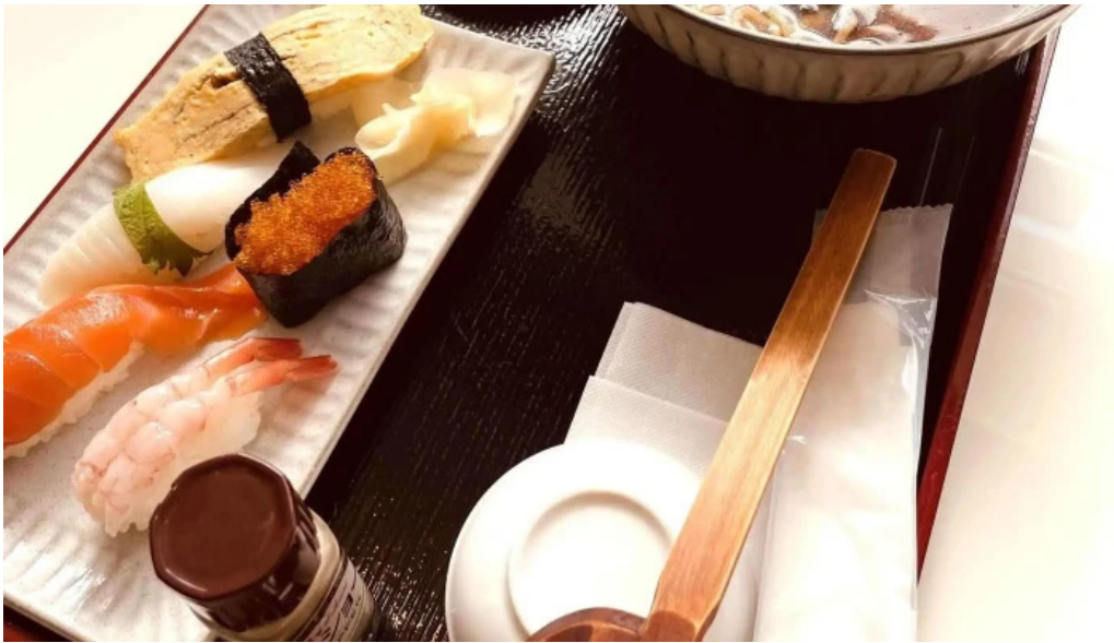
Qi restaurant nabe comentario 5