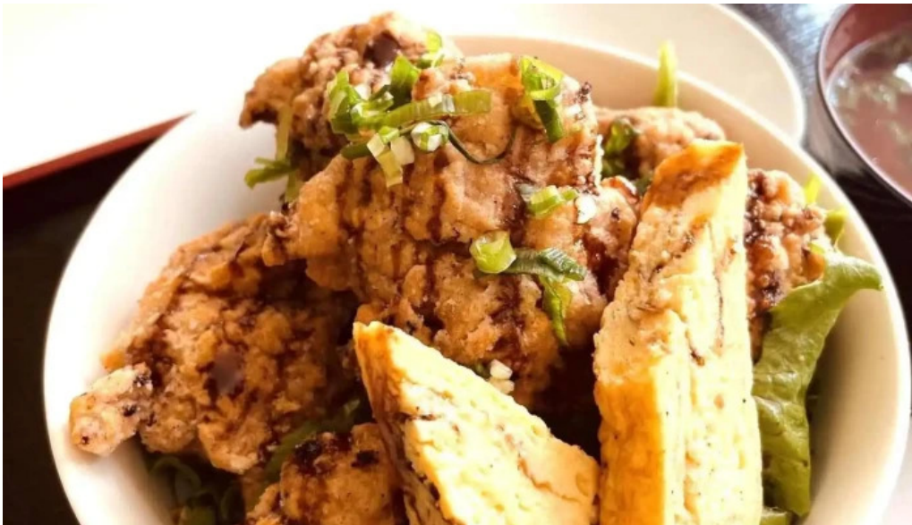
Qi restaurant nabe karaYang ge