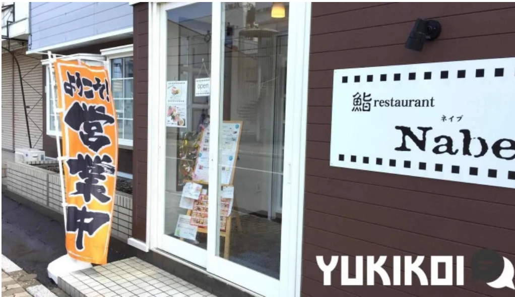
Qi restaurant nabe subete