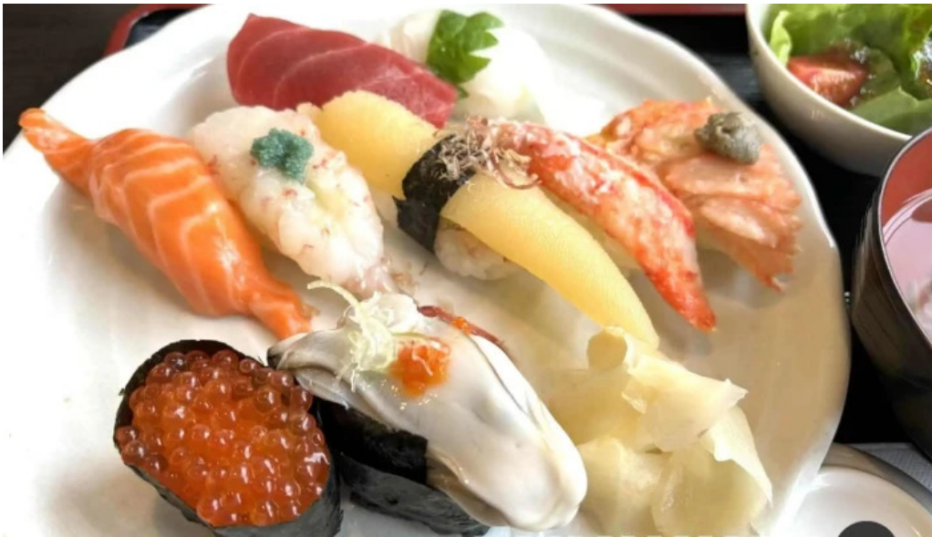
Qi restaurant nabe Liao Li Yin miWu