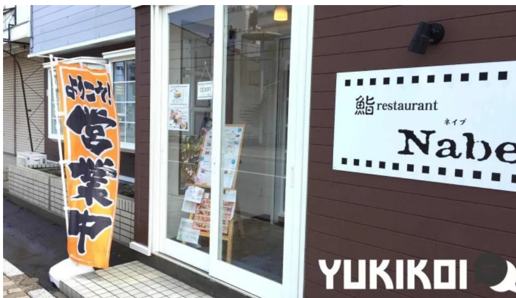
鮭restaurant nabe 網走市