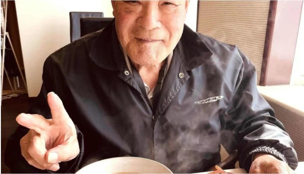
Qi restaurant nabe comentario 3