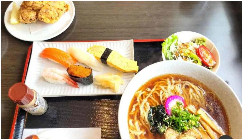
Qi restaurant nabe ra men