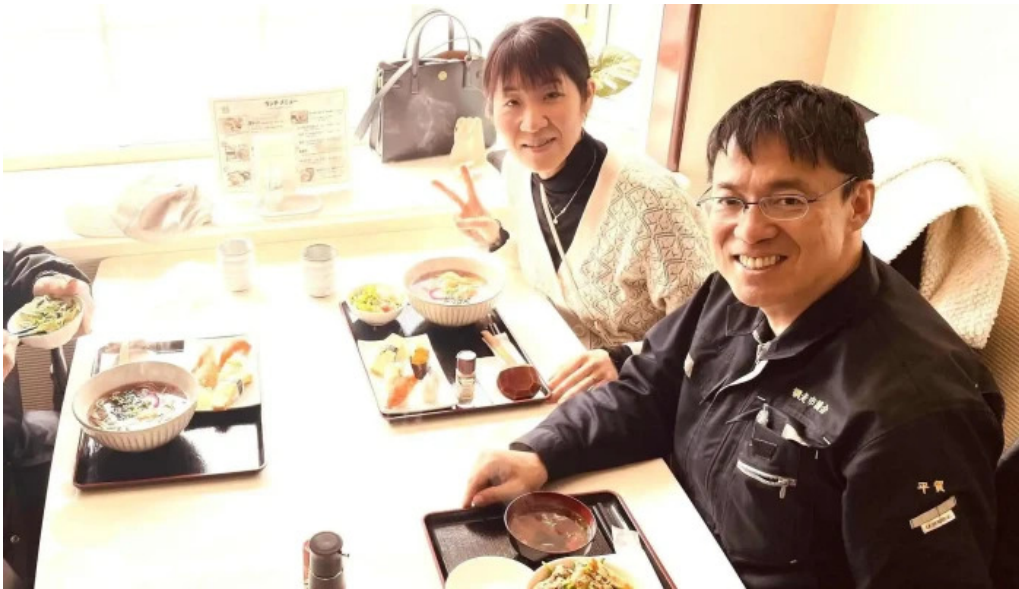
Qi restaurant nabe comentario 4