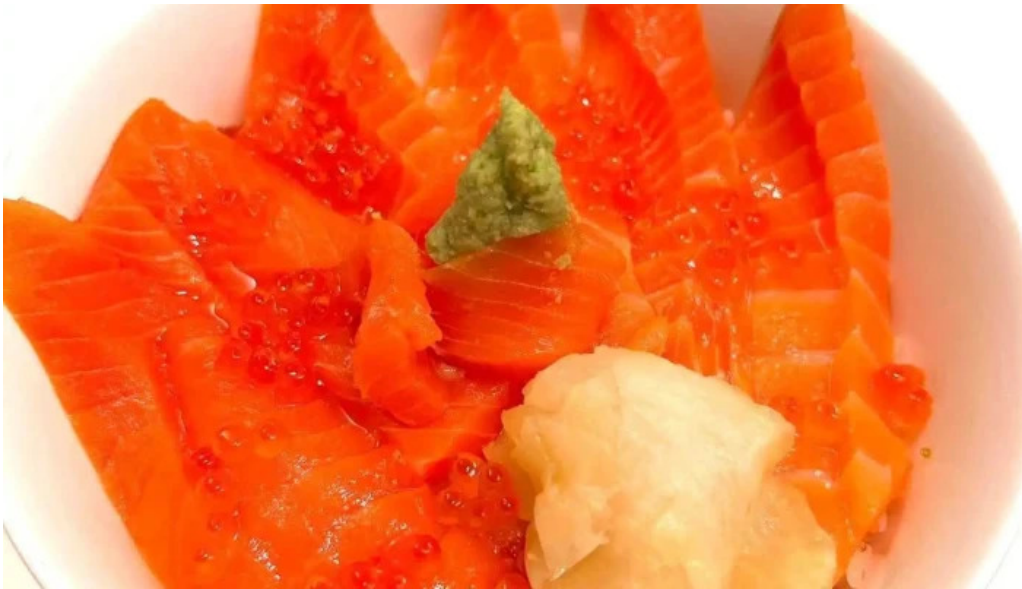
Qi restaurant nabe Zui Xin