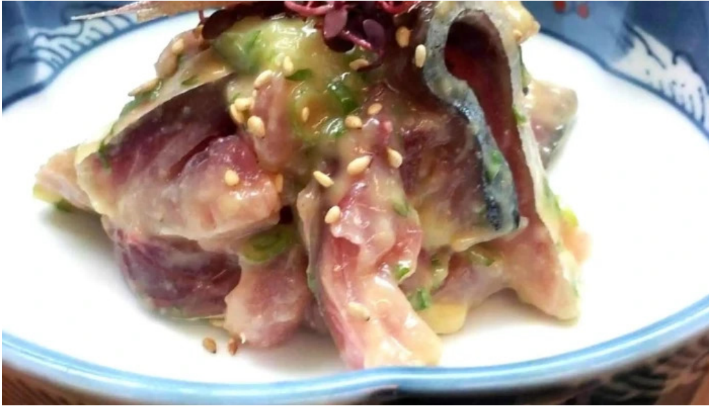
寿し吉 comentario 2