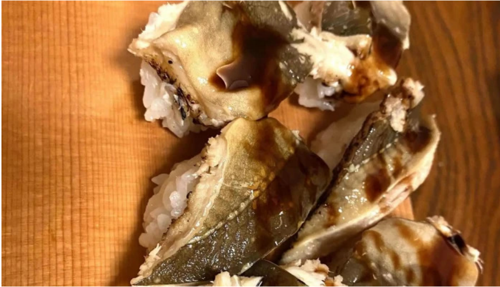
寿し吉 comentario 4