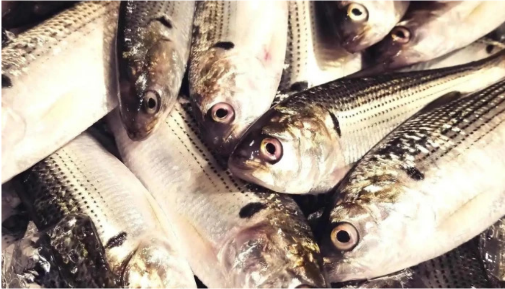
寿し吉 料理飲み物