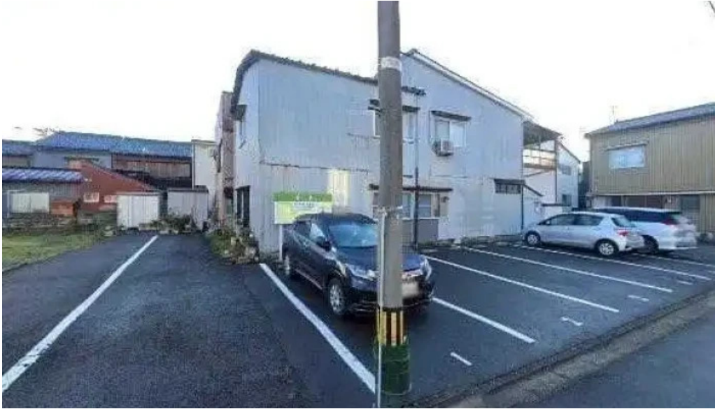
寿し吉 ストリートビューと 360 ビュー