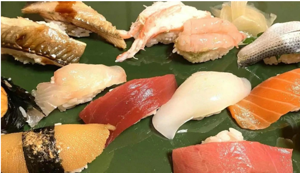
寿し吉 comentario 3