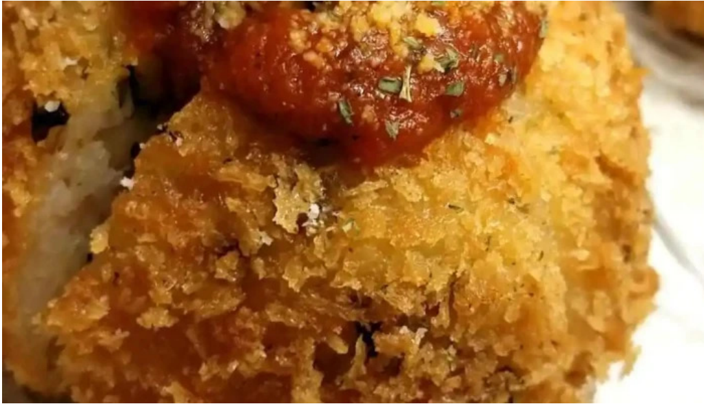
寿し吉 オーナー提供