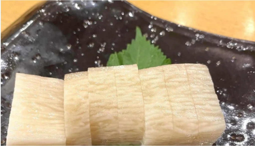
寿しゅう comentario 5