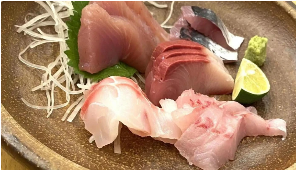
寿しゅう comentario 4