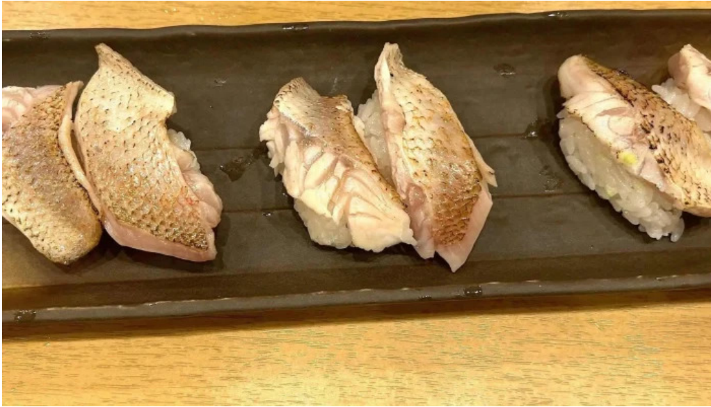
寿しゅう comentario 3