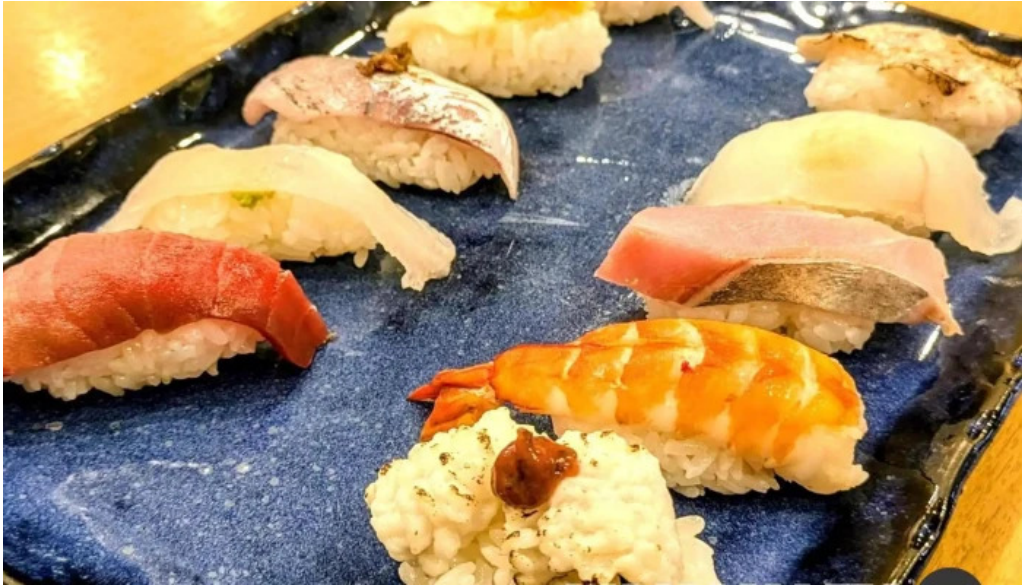
寿しゆう 料理飲み物