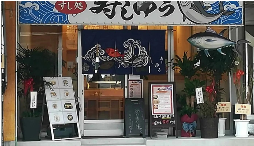
寿しゆう シーフード