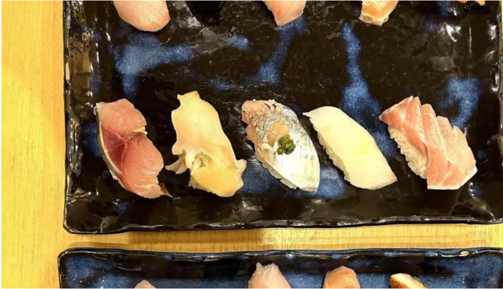
寿しゆう comentario 1