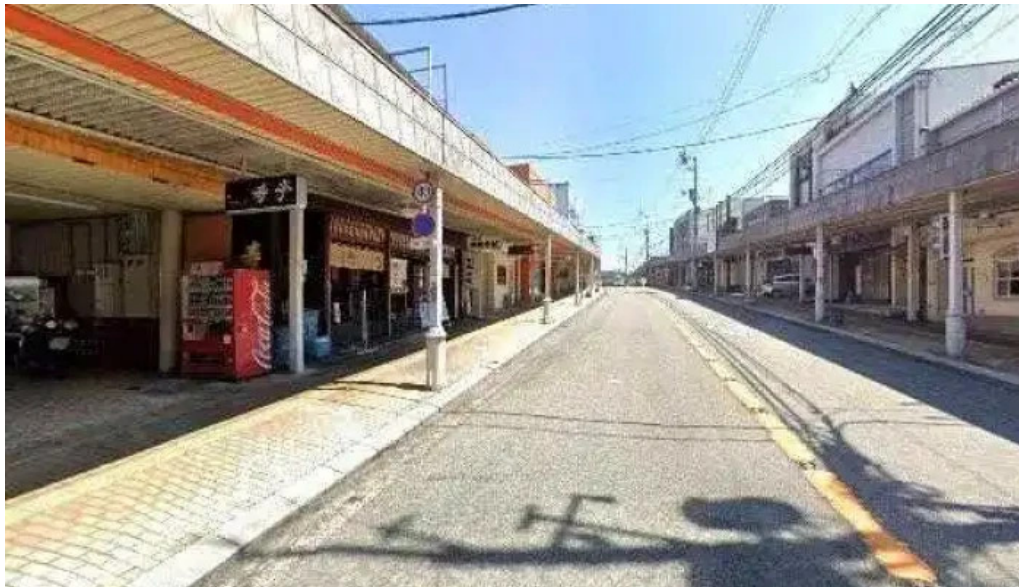
寿しゅうストリートビューと360ビュー