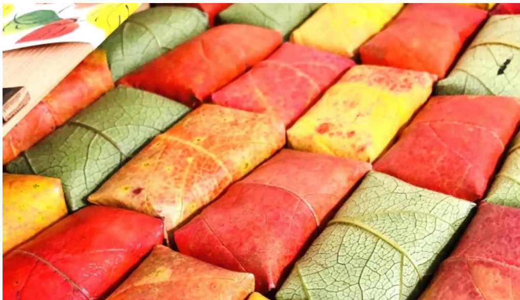
山の辺 桜井本店 instagram