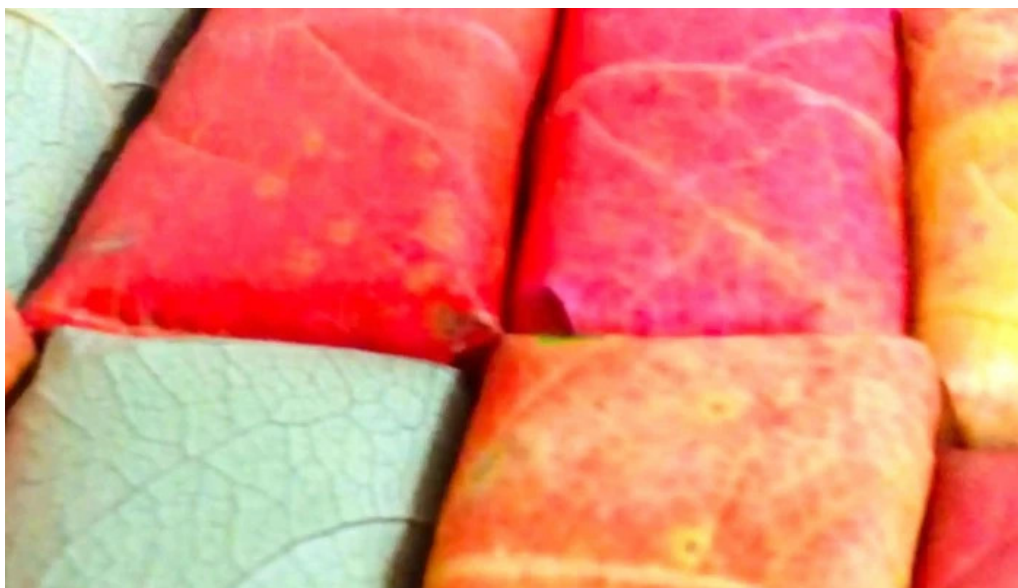
山の辺 桜井本店 近く