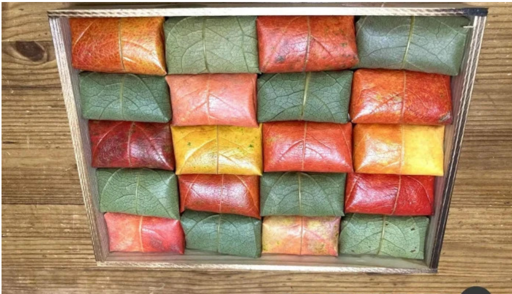
山の辺 桜井本店 最新