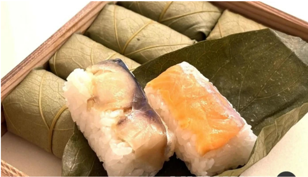
山の辺 桜井本店 寿司