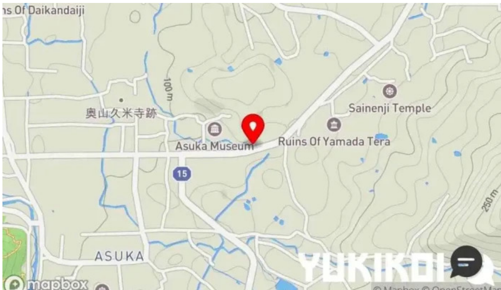
山の辺 桜井本店 地図