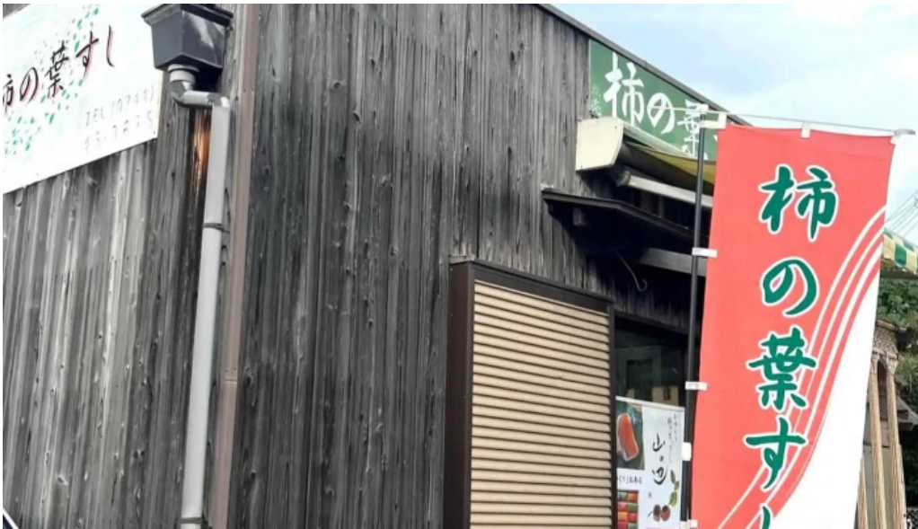
山の辺 桜井本店 番号