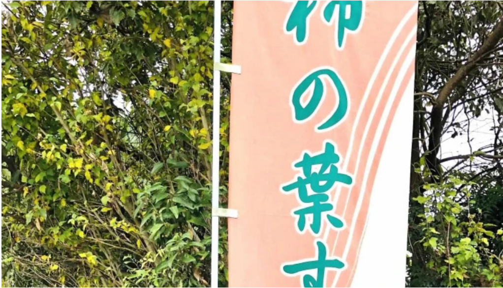
山の辺 桜井本店 行き方