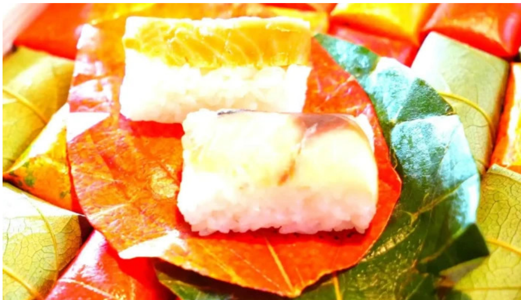
山の辺 桜井本店 料理飲み物