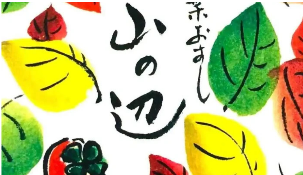
山の辺 桜井本店 動画