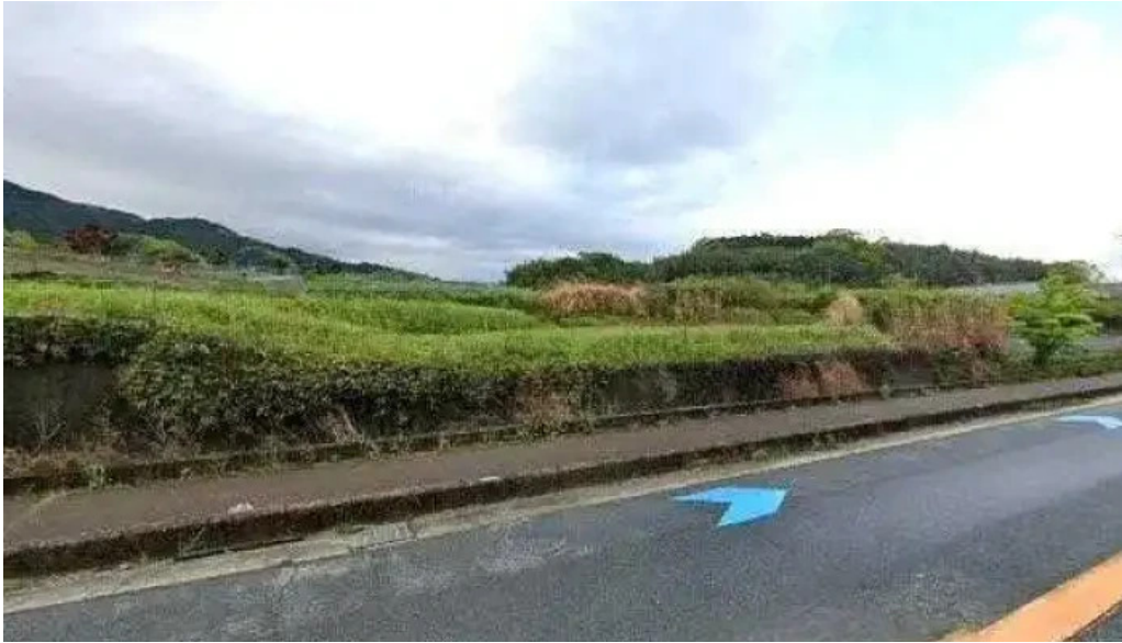
山の辺 桜井本店 桜井市