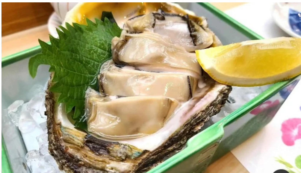
呉竹鮨 松江本店 カキ