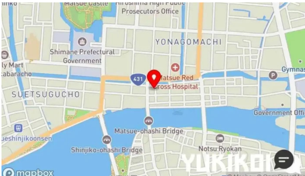
呉竹鮨 松江本店 地図