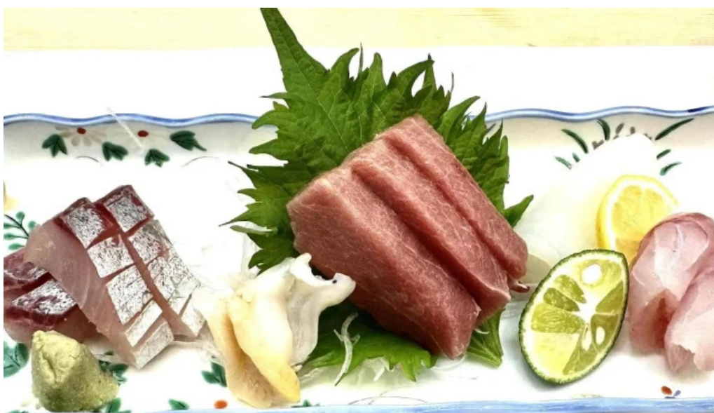
呉竹鮨 松江本店 どこ