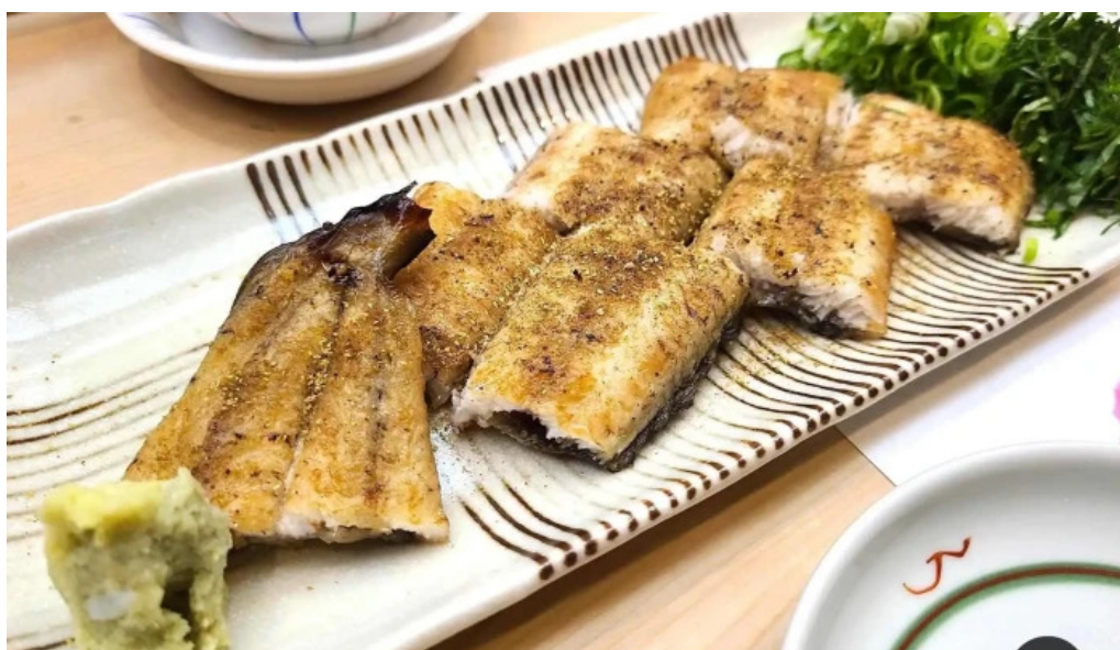
呉竹鮨 松江本店 フライドフィッシュ