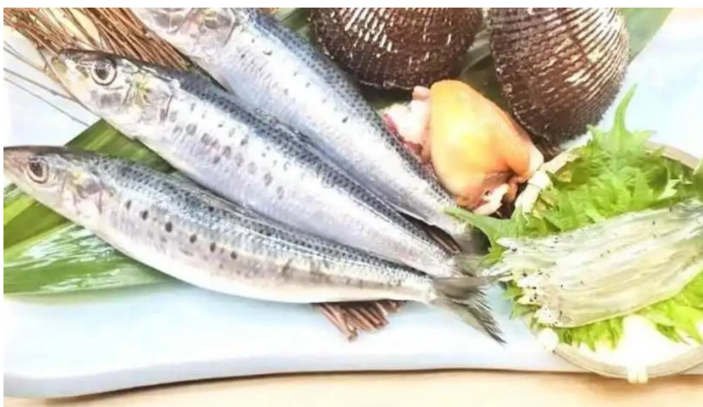
吳竹鮨 松江本店 料理飲み物