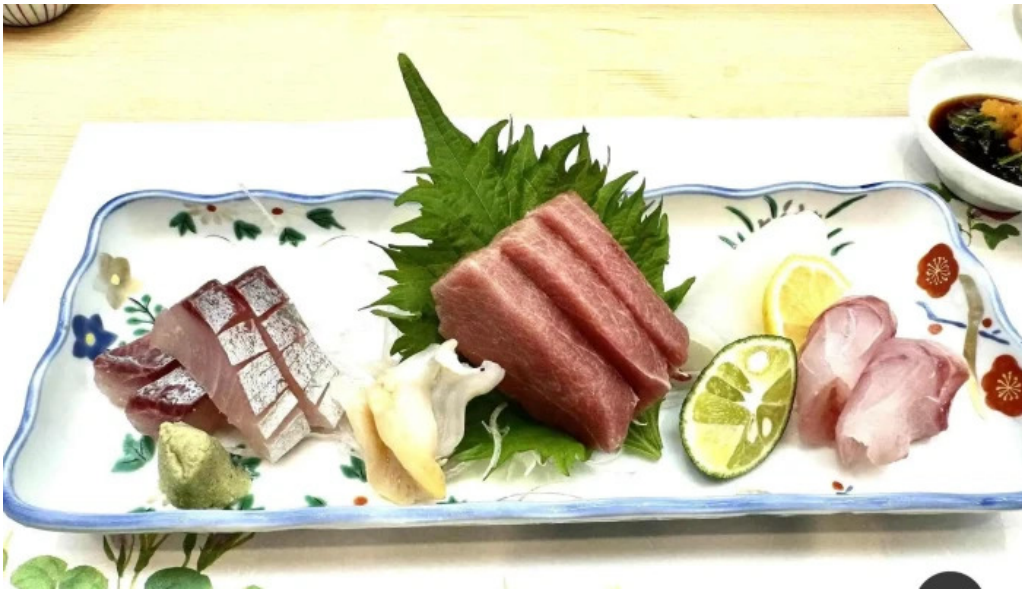
吳竹鮪 松江本店 刺身