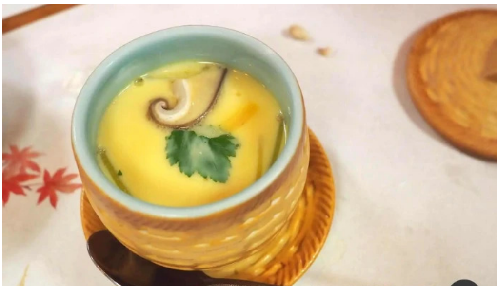
吳竹鮨 松江本店 最新