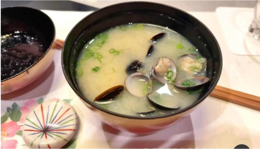
吳竹鮨 松江本店 味噌汁