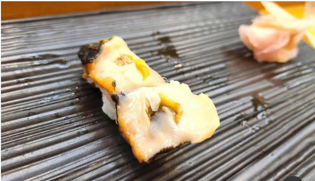
呉竹鮨 松江本店 寿司