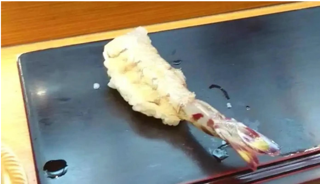
吳竹鮨 松江本店 動画