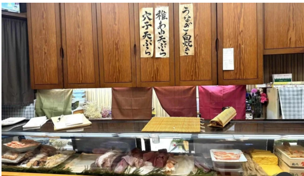
呉竹鮨 松江本店 雰囲気