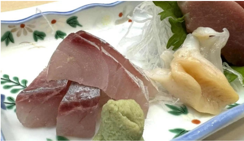
吳竹鮪 松江本店 割引