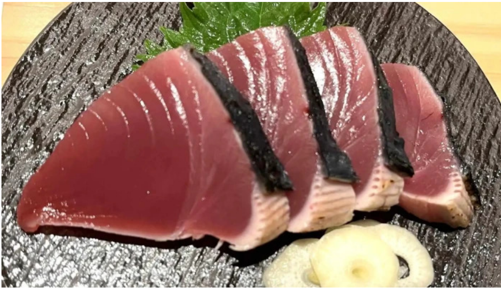
政寿し 料理飲み物