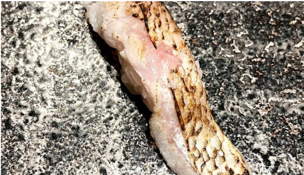
政寿し シーフード