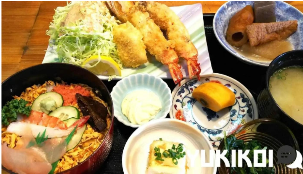
友恵寿し 料理飲み物