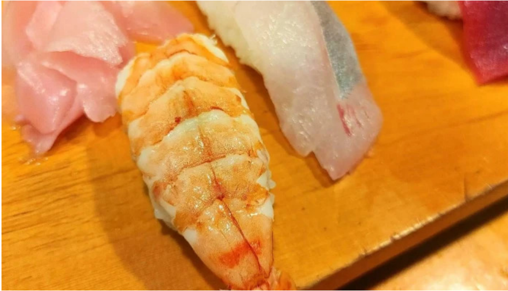
友恵寿し コメント