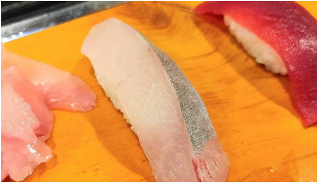
友恵寿し プロモーション