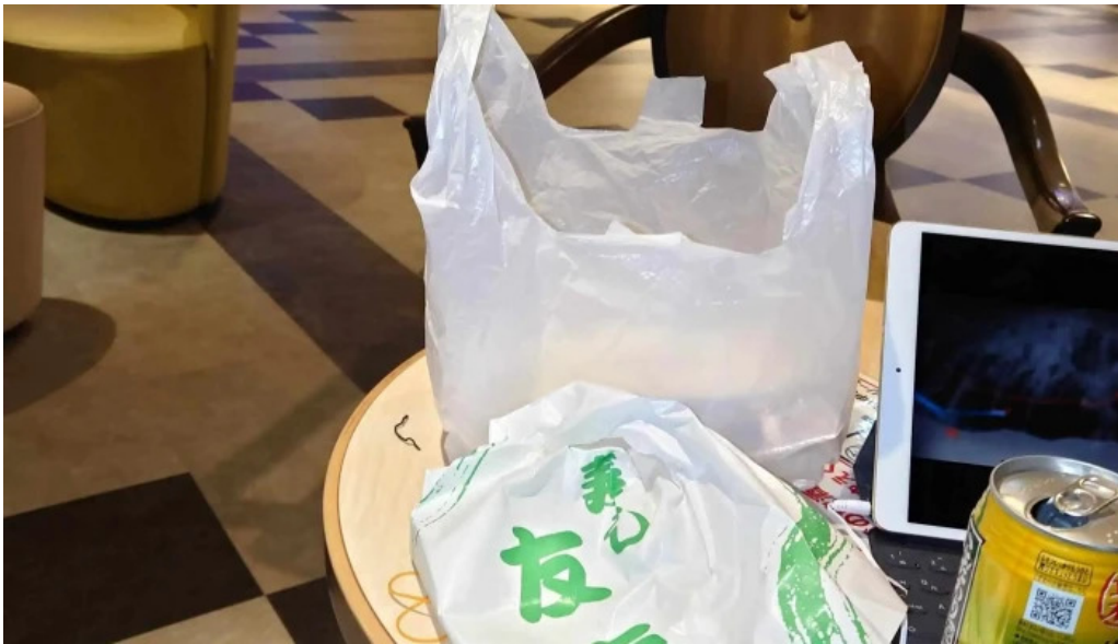
友恵寿し ウェブサイト