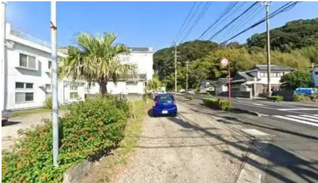
友恵寿し 志布志市