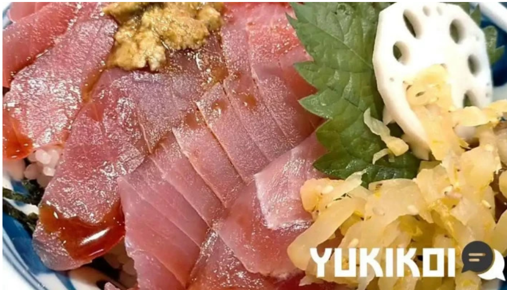
沼津魚がし鮨 御殿場アウトレット店 動画