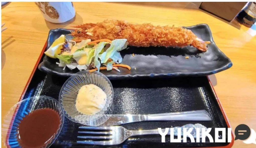
沼津魚がし鯨 御殿場アウトレット店 天ぷら