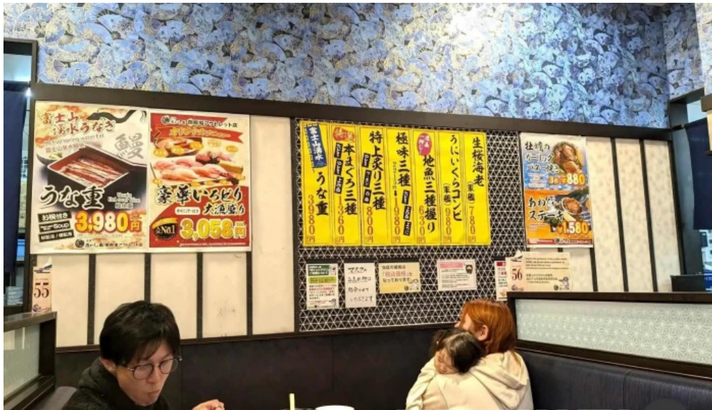
沼津魚がし鯨 御殿場アウトレット店 雰囲気