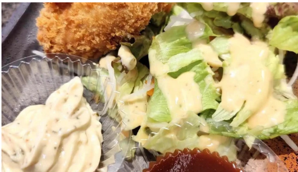
沼津魚がし鯨 御殿場アウトレット店 から揚げ