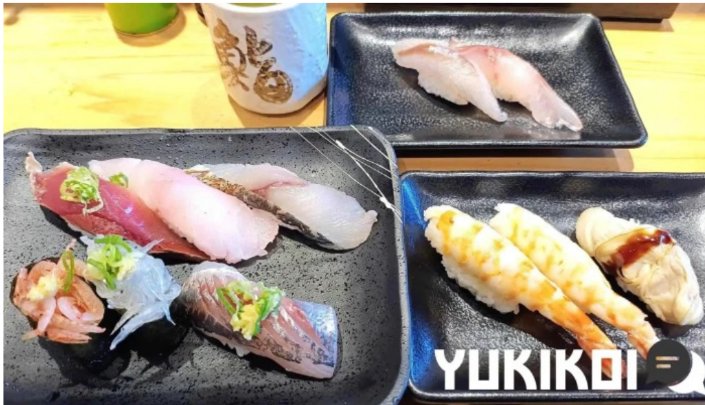
沼津魚がし鮨 御殿場アウトレット店 シーフード