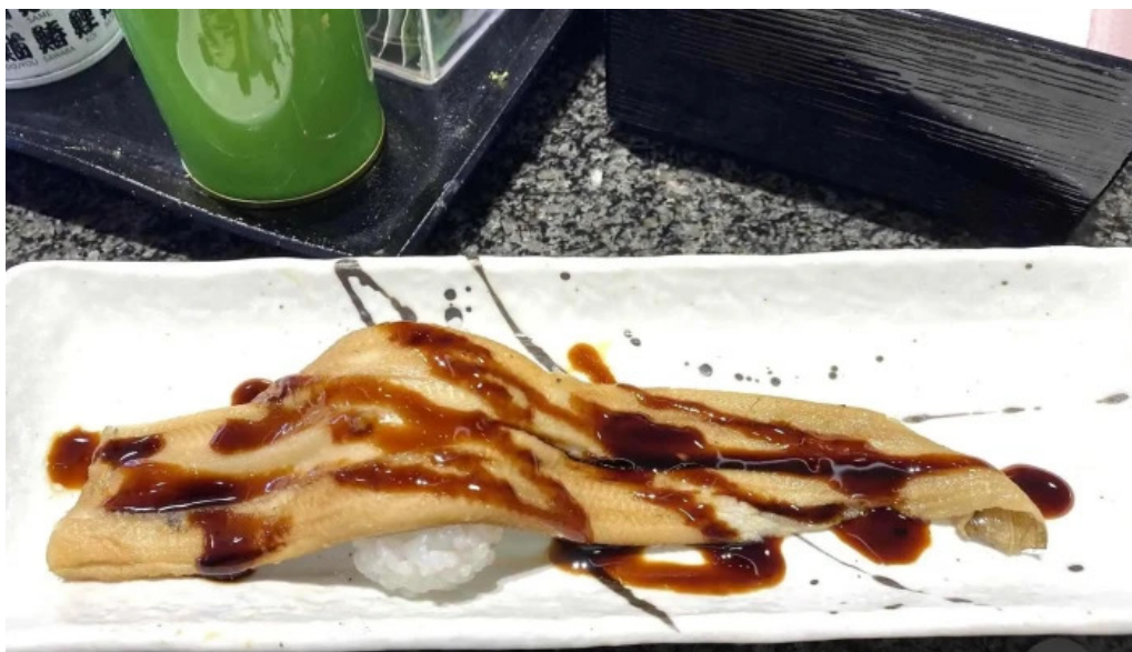
沼津魚がし鯨 御殿場アウトレット店 ウナギ目