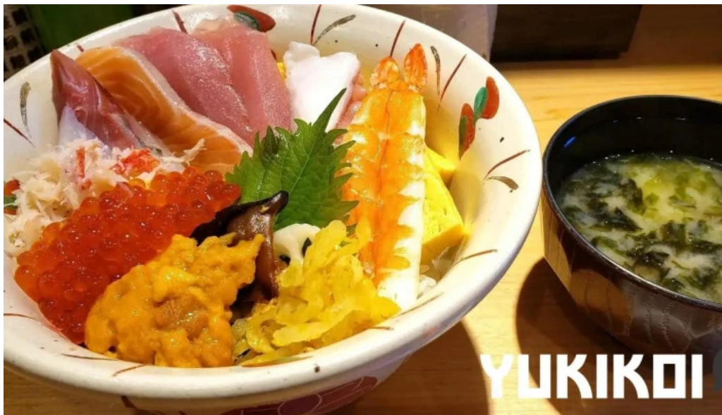
沼津魚がし鮨 御殿場アウトレット店 丼物