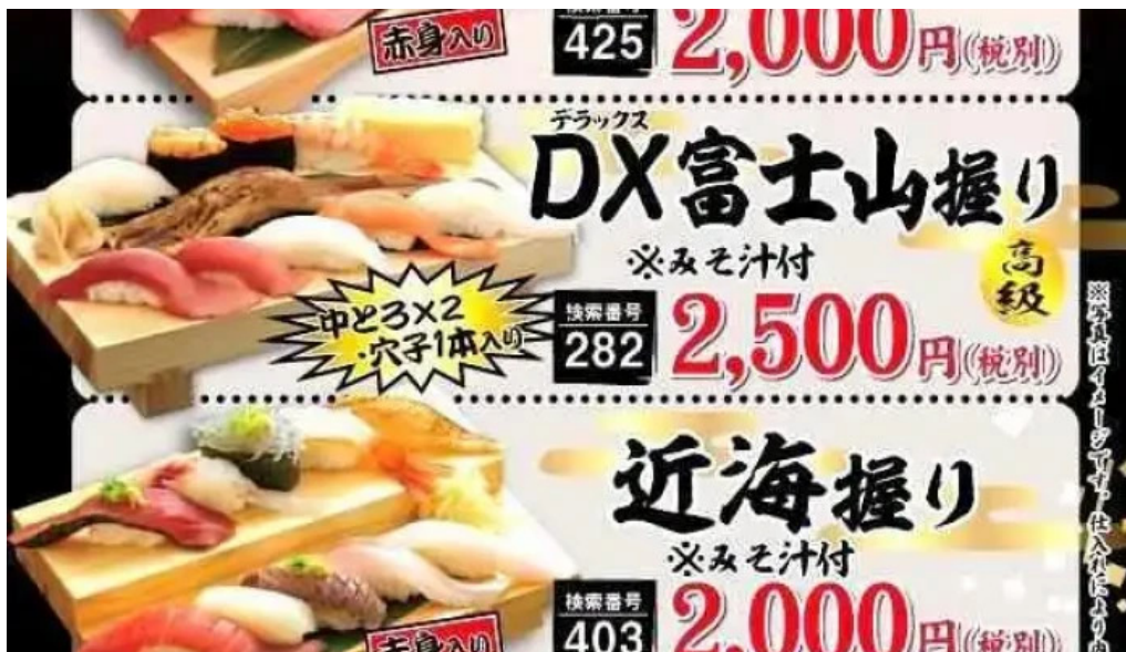
沼津魚がし鮓 御殿場アウトレット店 メニュー