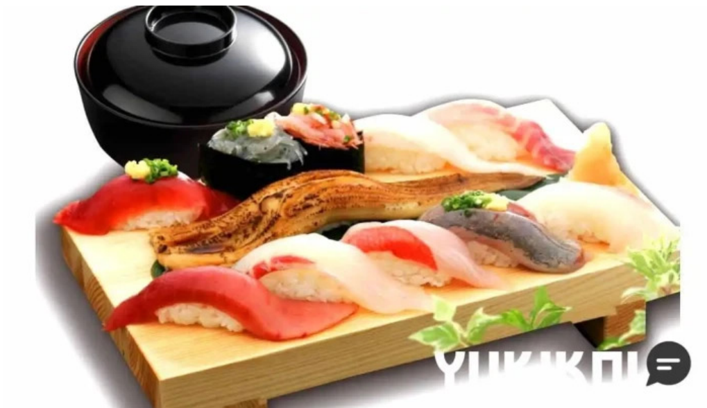
沼津魚がし鮨 御殿場アウトレット店 料理飲み物