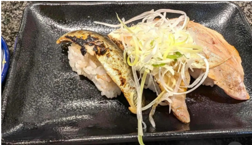
沼津魚がし鮨 御殿場アウトレット店 サバ