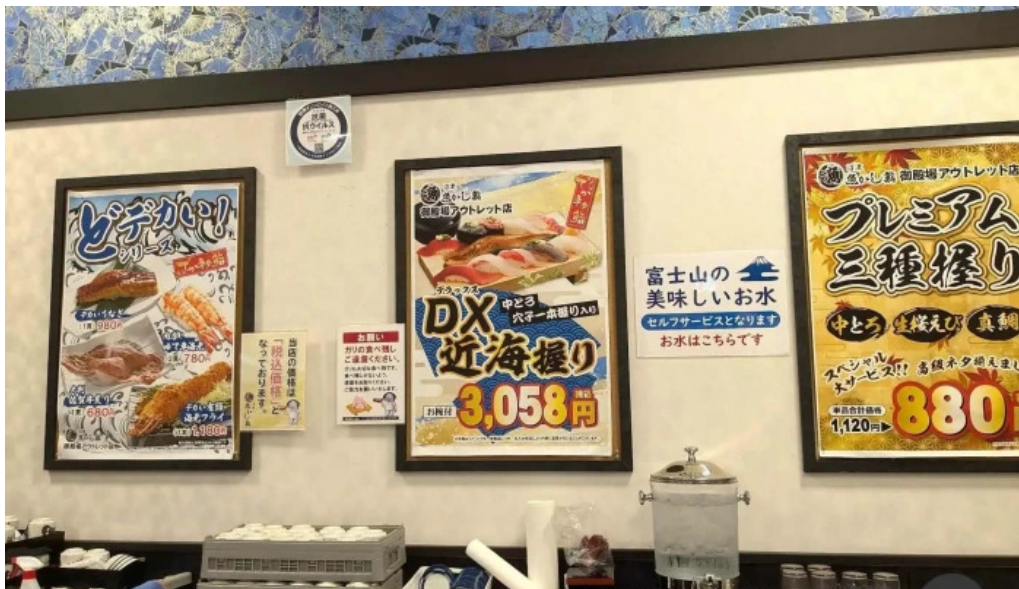
沼津魚がし鯨 御殿場アウトレット店 最新