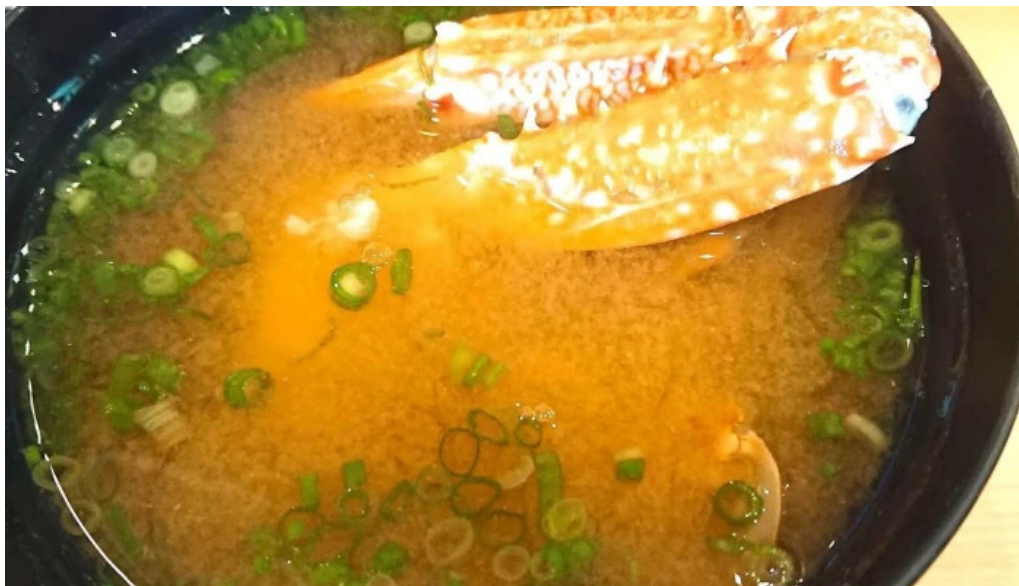
沼津魚がし鯨 御殿場アウトレット店 味噌汁