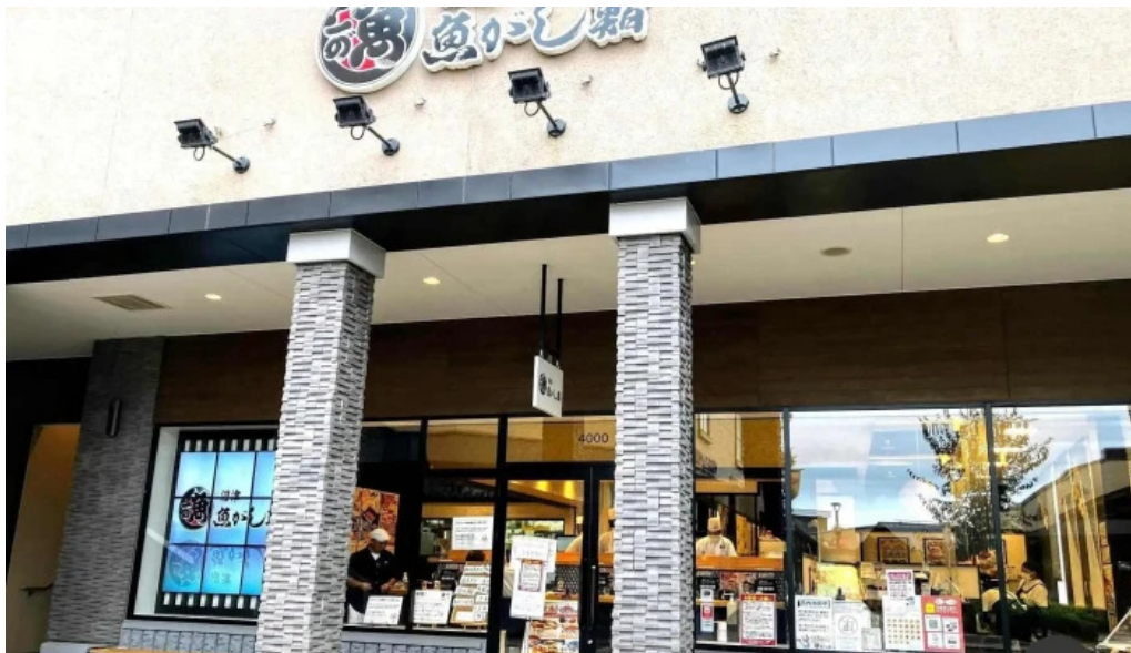
沼津魚がし鮨 御殿場アウトレット店 御殿場市