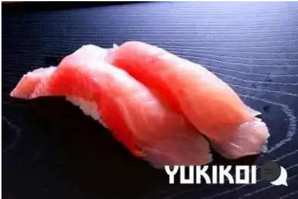
沼津魚がし鯨 御殿場アウトレット店 寿司