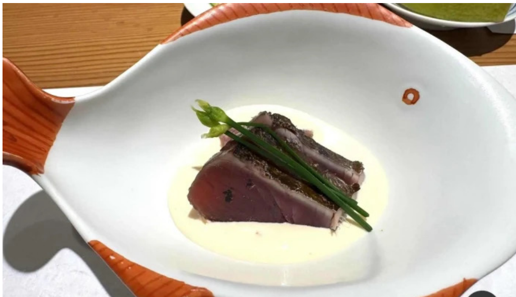
すし 碧海 たたき