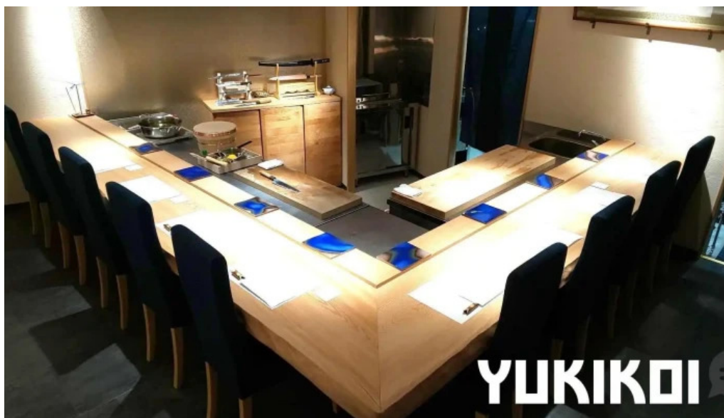
すし 碧海 雰囲気