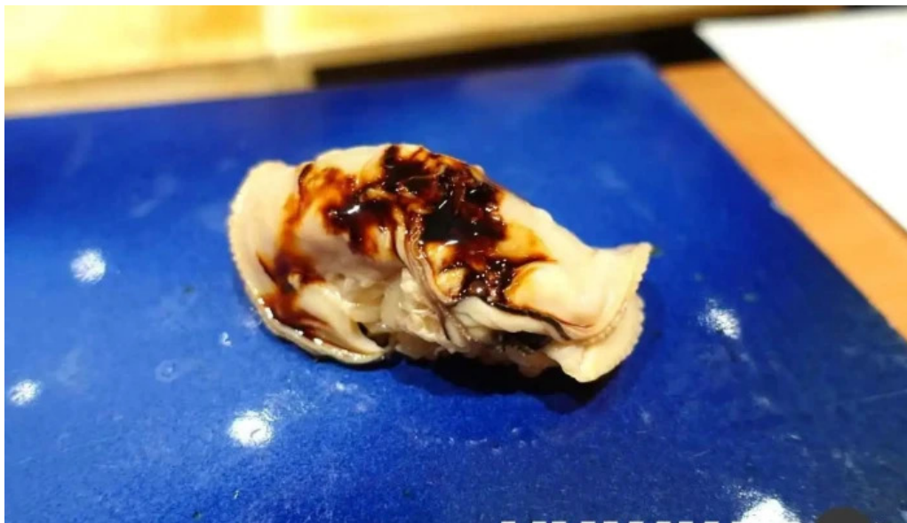
すし 碧海 料理飲み物