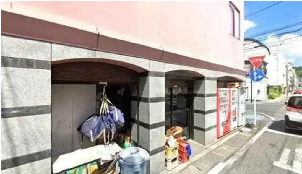
すし 碧海 奄美市