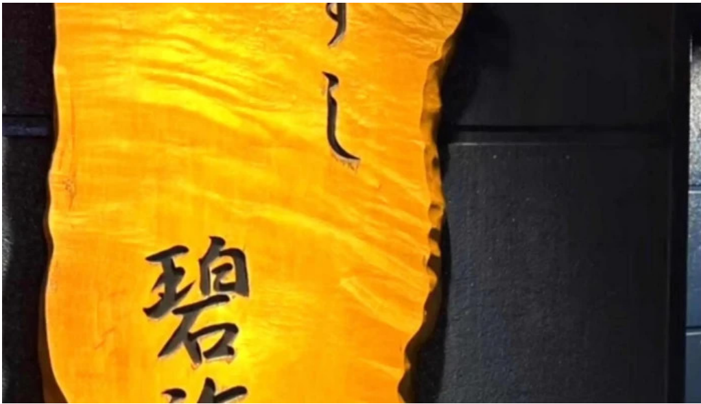
すし 碧海 営業時間