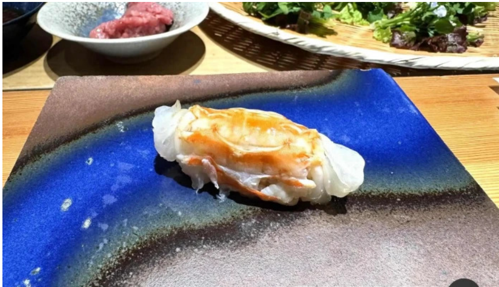
すし 碧海 寿司