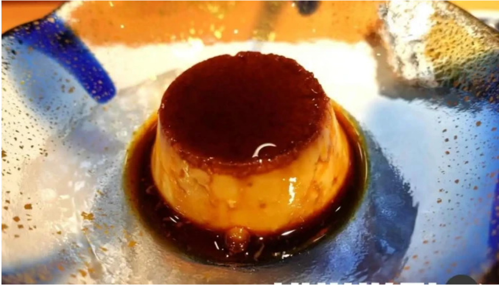
すし 碧海 フラン