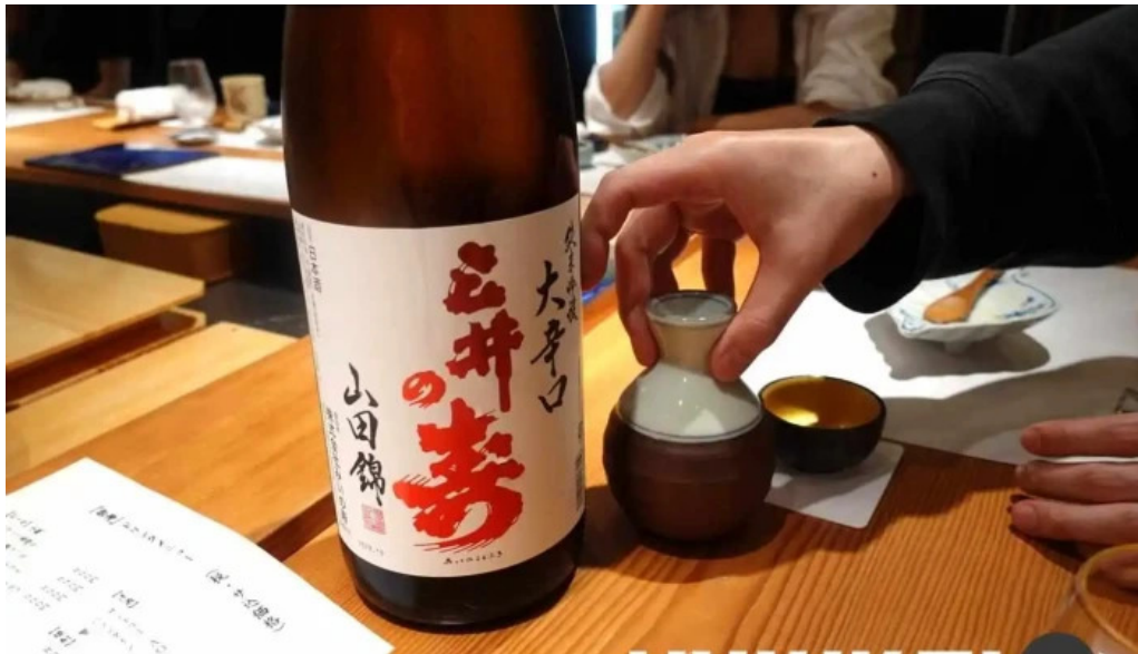
すし 碧海 日本酒