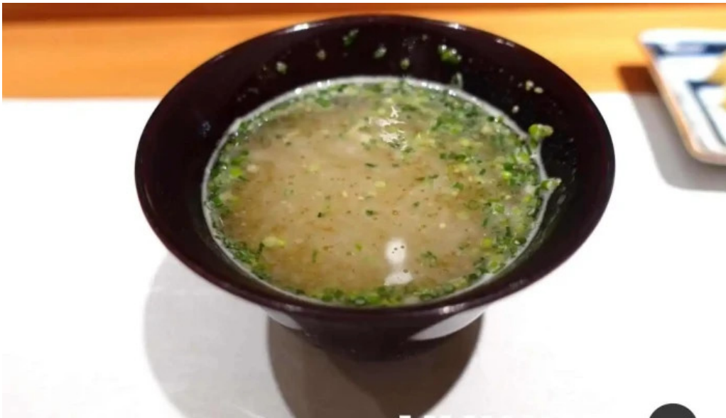
すし 碧海 味噌汁