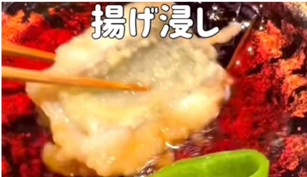
すし 碧海 エリア