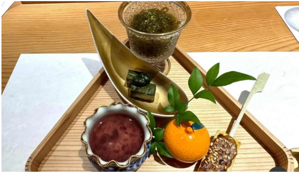
すし 碧海 懐石