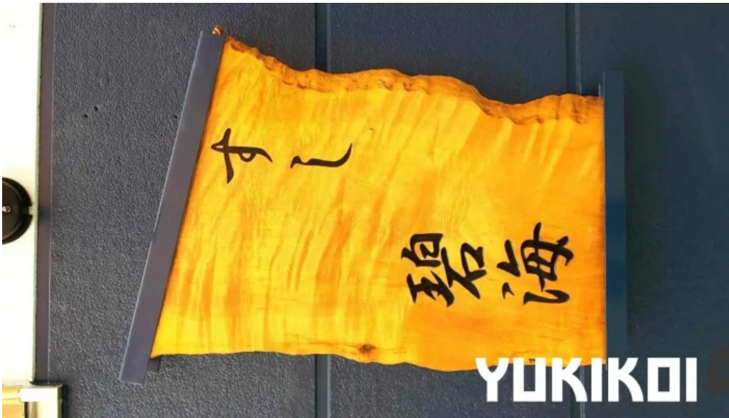
すし 碧海 オーナー提供