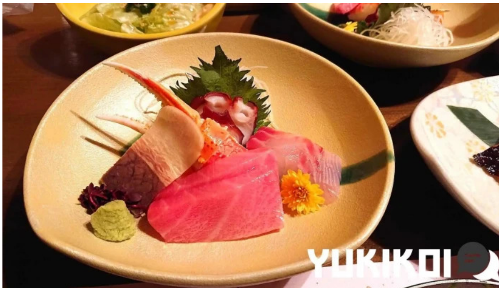
司寿司 料理飲み物