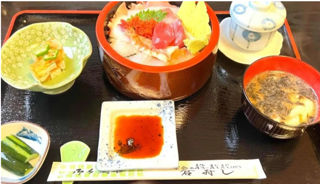
倉寿し ウェブサイト