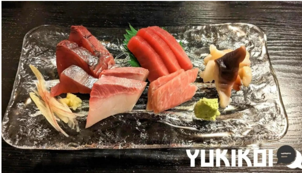
倉寿し 料理飲み物