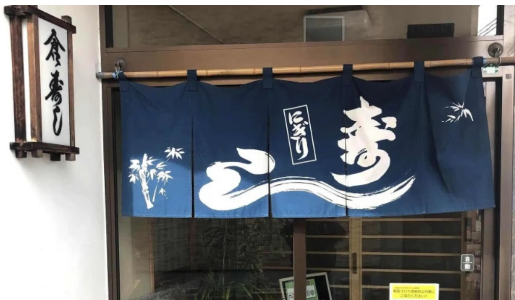
倉寿し プロモーション