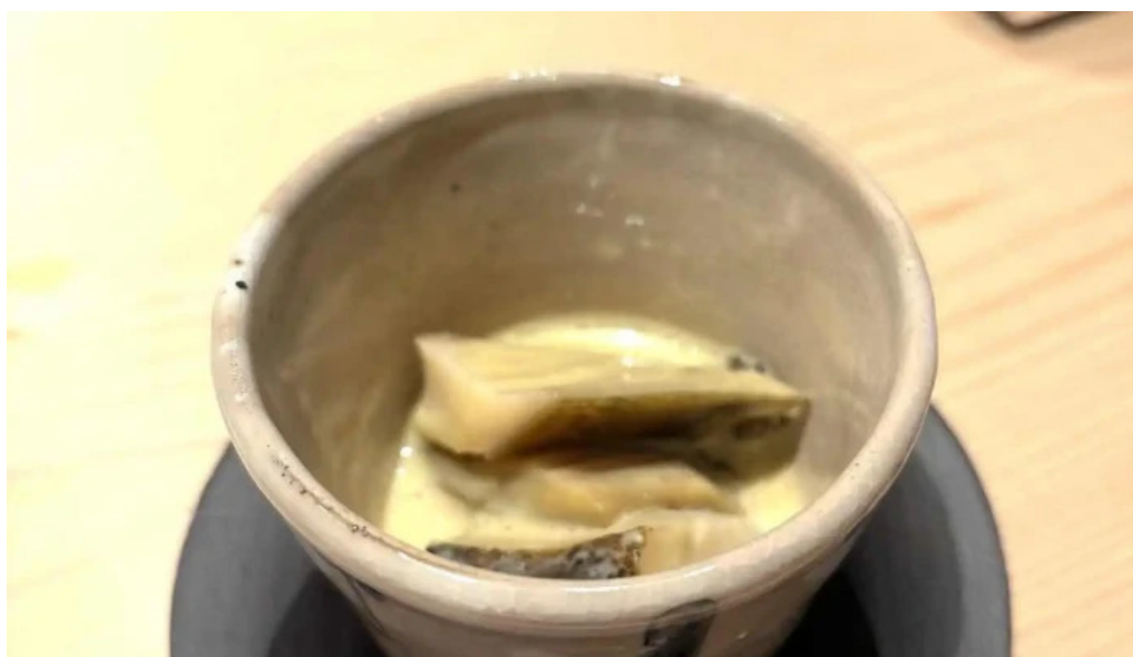
鮭心by宮川 ニセコ店 茶碗蒸し