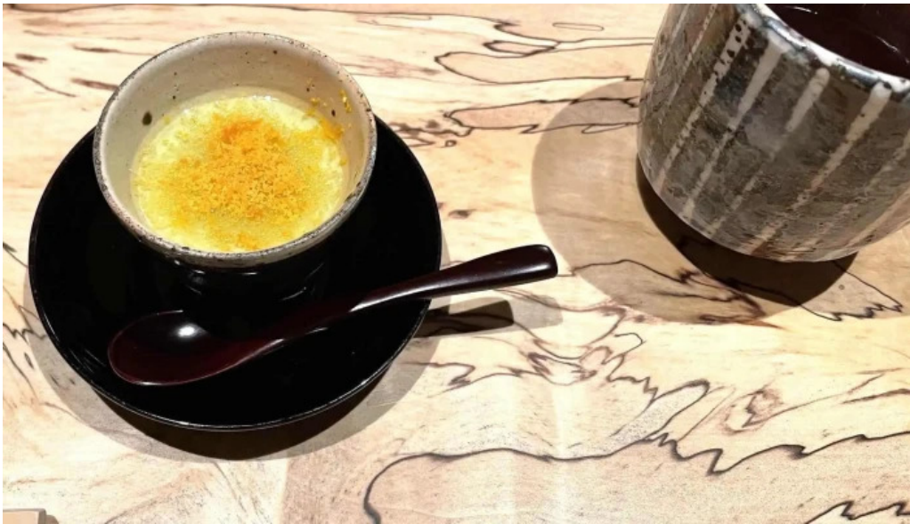
鮭心by宮川 ニセコ店 どこ