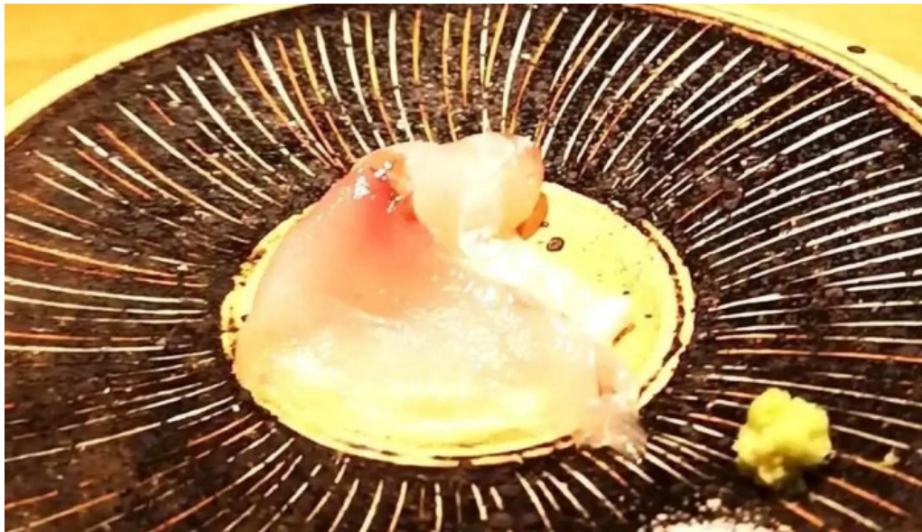
鮭心by宮川 二セコ店 料理飲み物