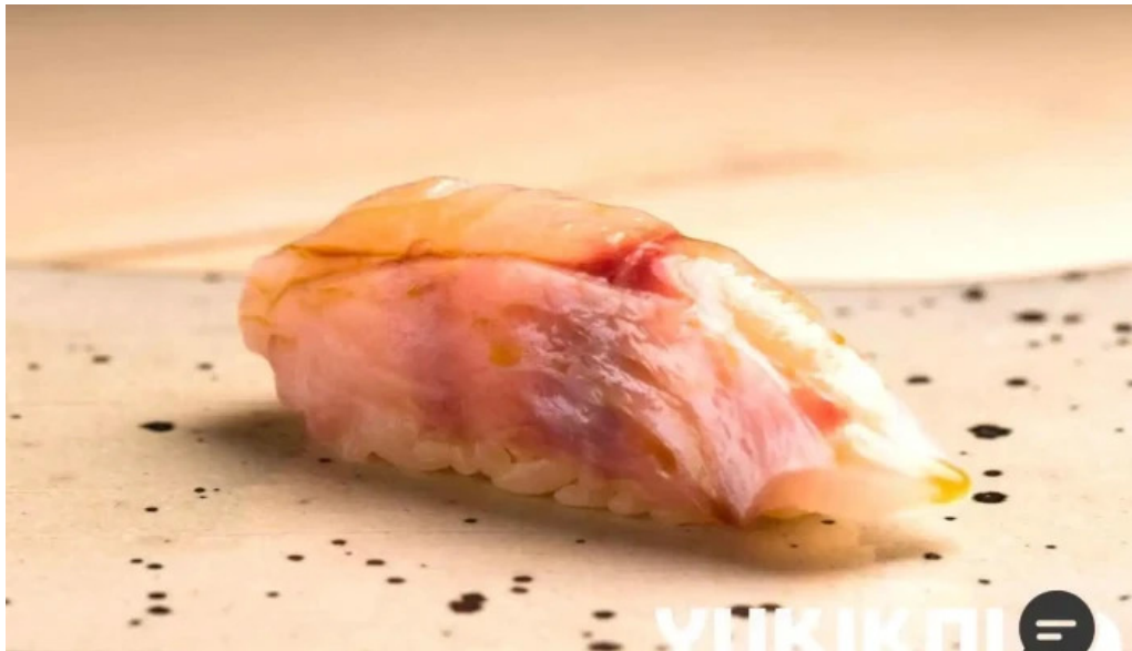
鮭心by宮川 ニセコ店 寿司