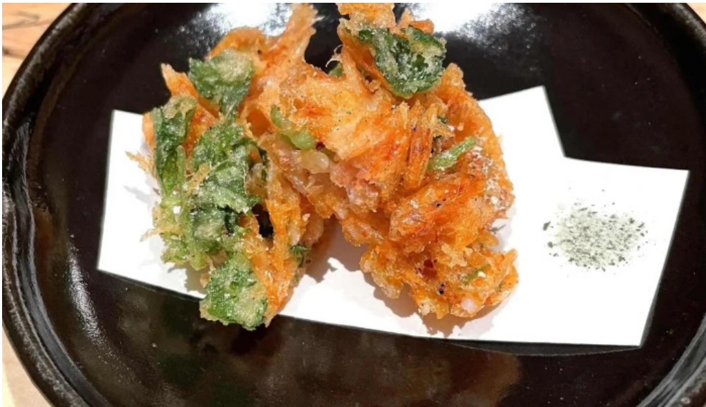
鮭心by宮川 ニセコ店 カタログ