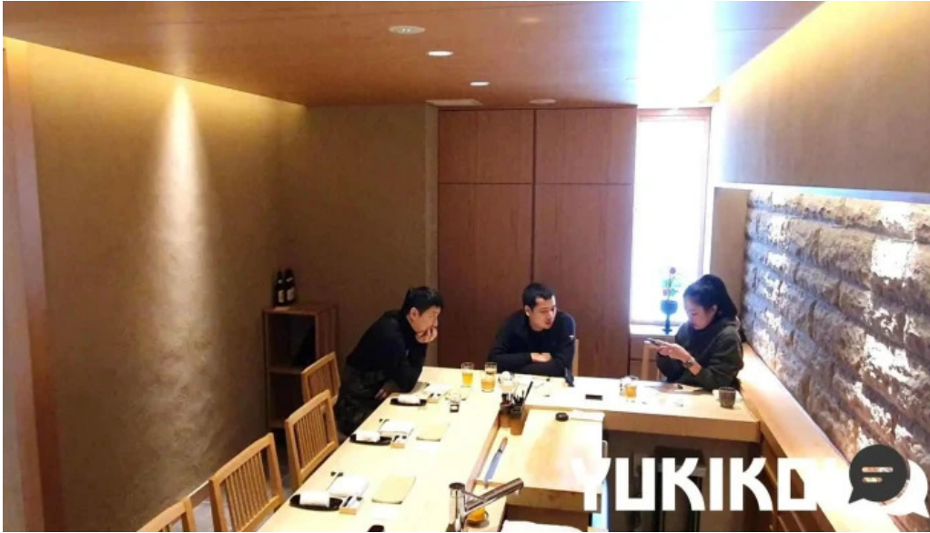
鮭心by宮川 ニセコ店 動画