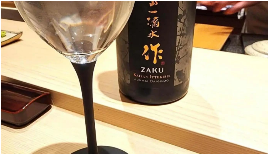
鮭心by宮川 二セコ店 日本酒