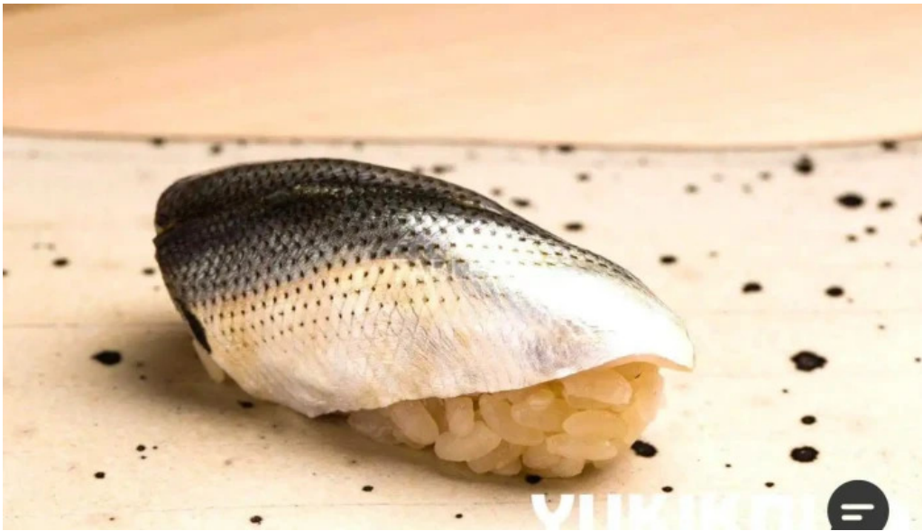
鮭心by宮川 ニセコ店 シーフード