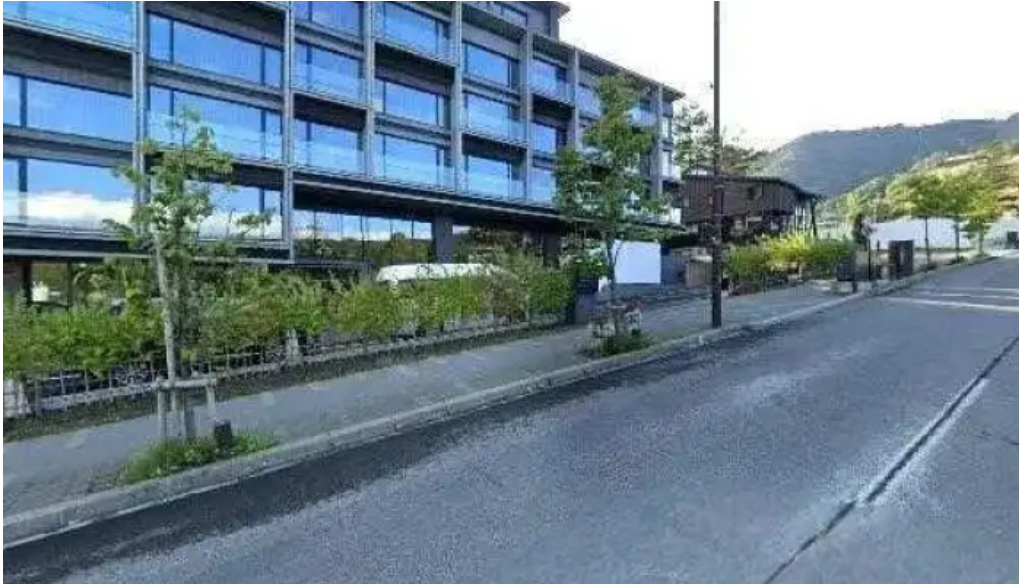
鮭心by宮川 ニセコ店 俣知安町