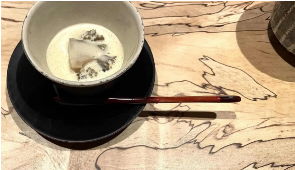
鮭心by宮川 ニセコ店 写真