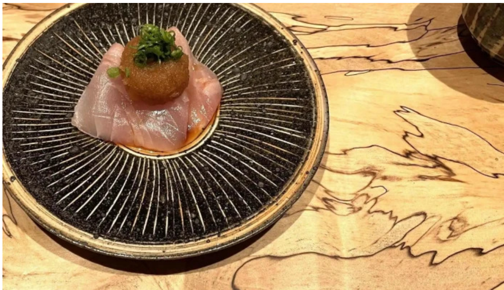
鮭心by宮川 ニセコ店 instagram