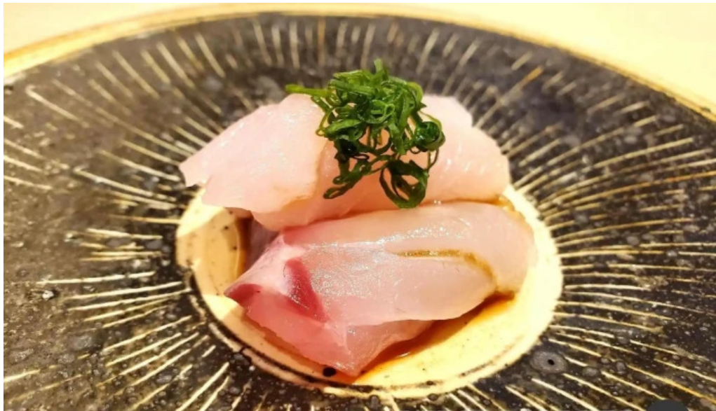
鮭心by宮川 ニセコ店 あん肝