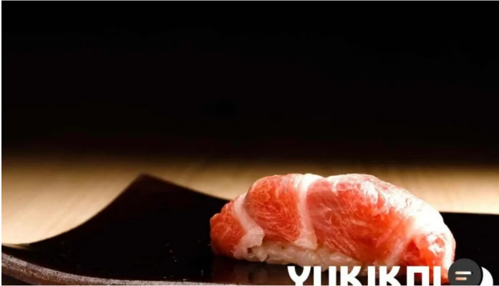
鮭心by宮川 ニセコ店