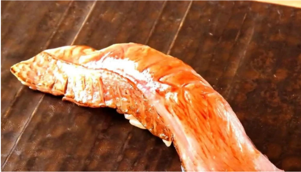
鮭 乃すけ シーフード