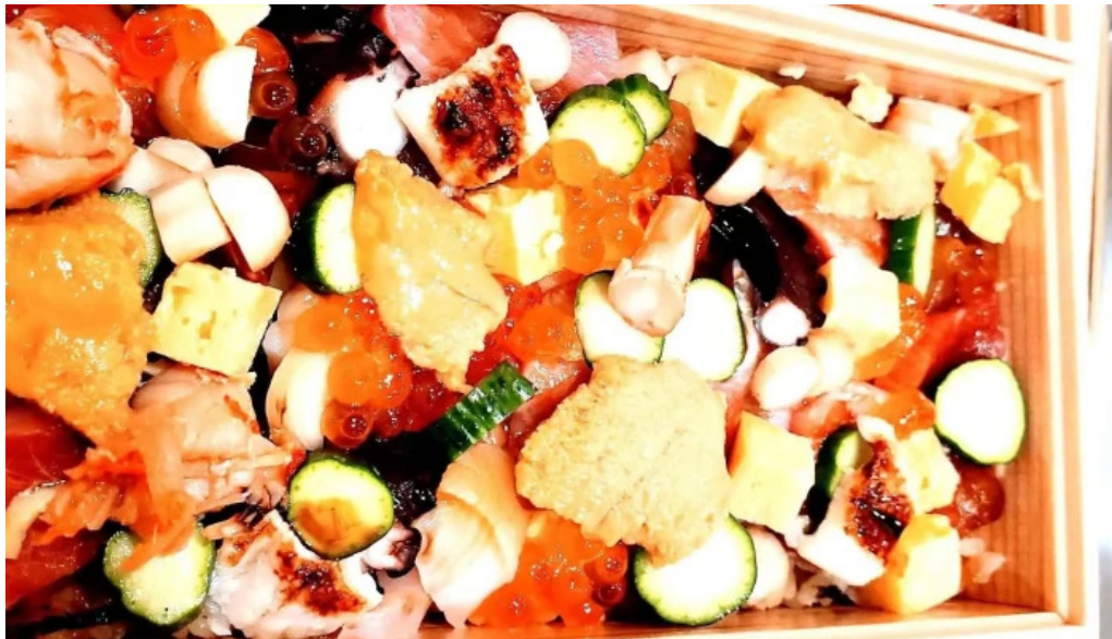
鮨乃すけ ちらし寿司