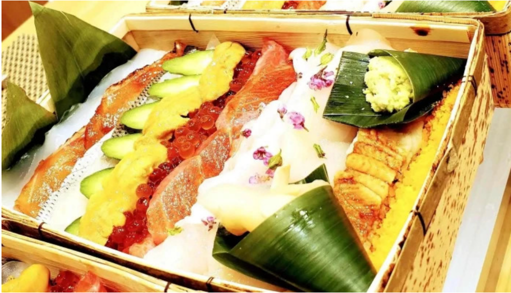
鮨乃すけ 料理飲み物