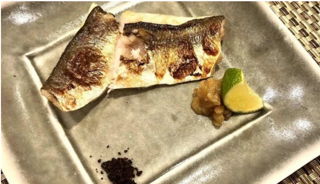
鮭 乃すけ サバ