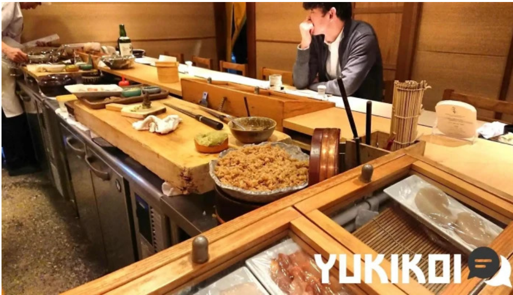
すし二乃宮 料理飲み物