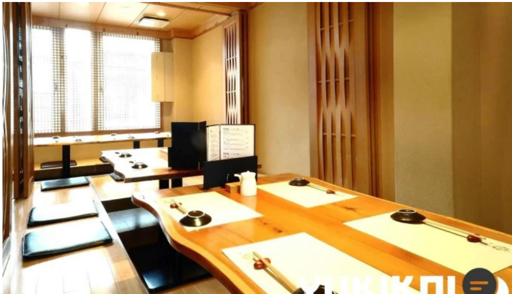
すし二乃宮 オーナー提供