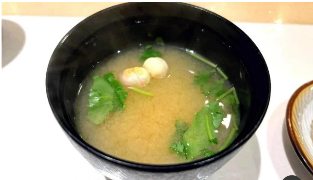
すし二乃宮 味噌汁