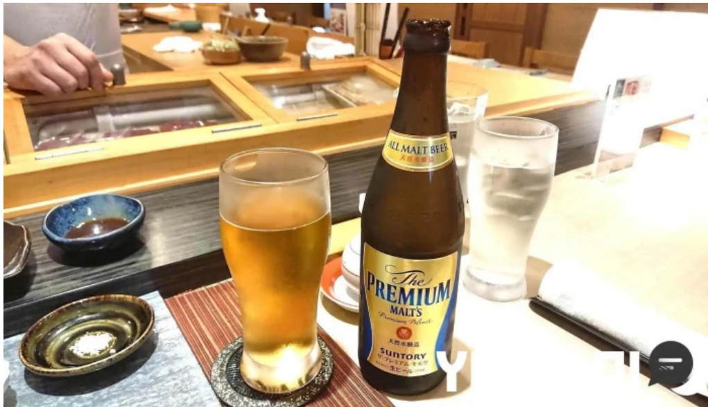
すし二乃宮 ビール