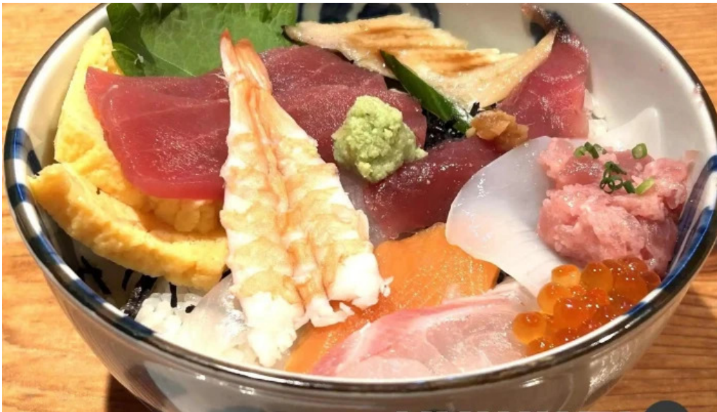
すし二乃宮 ちらし寿司