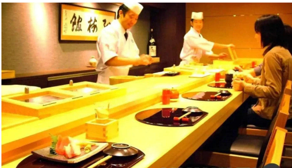
すし二乃宮 雰囲気