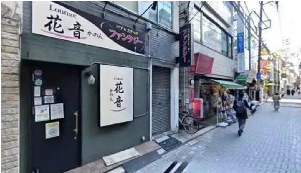
すし二乃宮 さいたま市