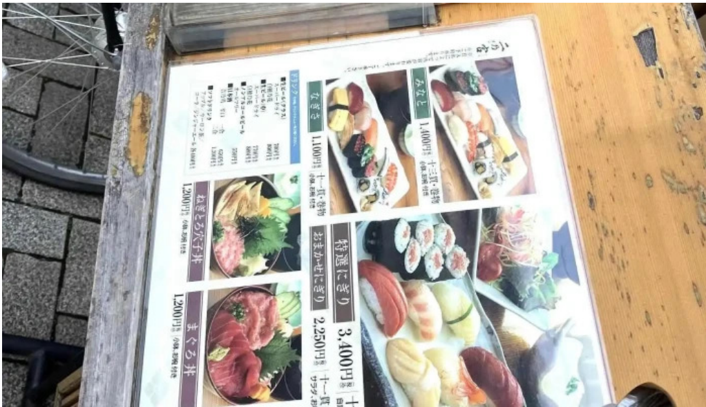
すし二乃宮 メニュー