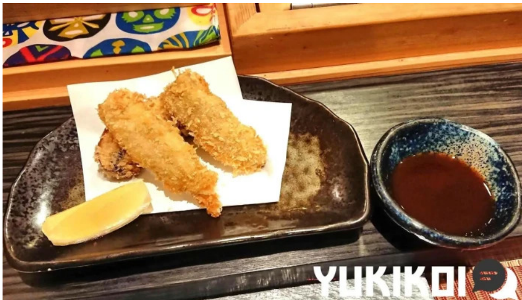
すし二乃宮 天ぷら