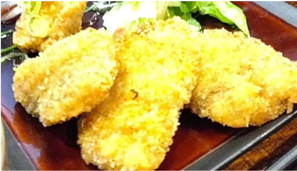
ごはん屋はな 動画