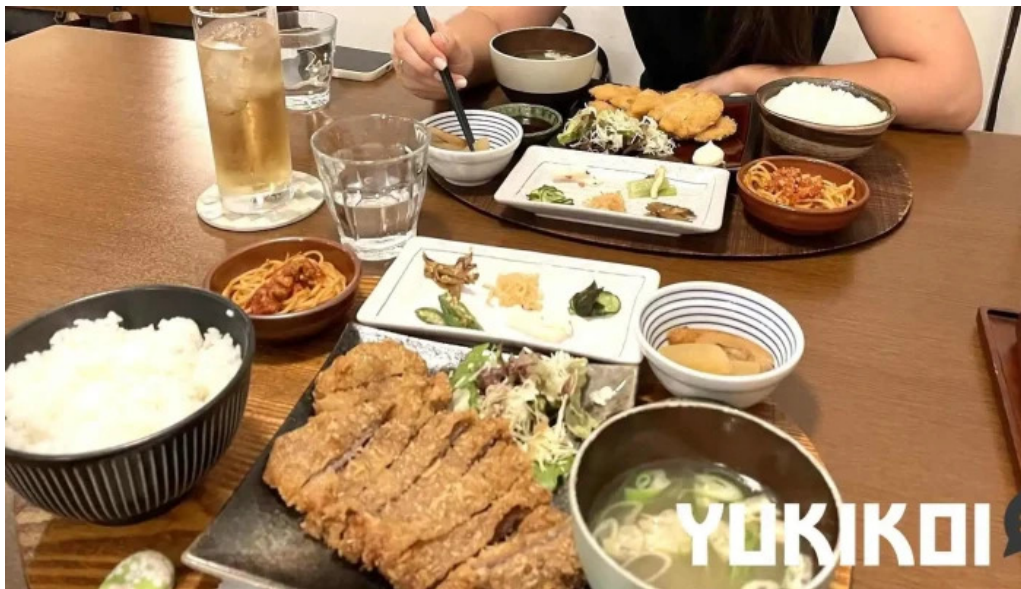
ごはん屋はな 料理飲み物