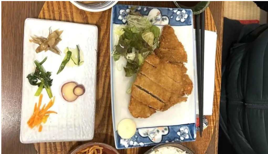
ごはん屋はな 最新