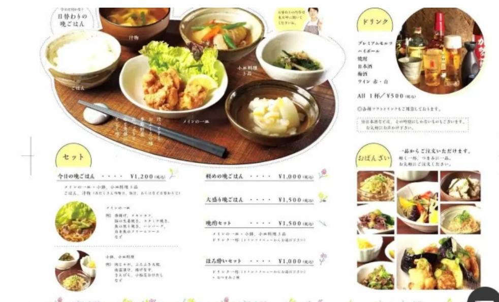
ごはん屋はな オーナー提供