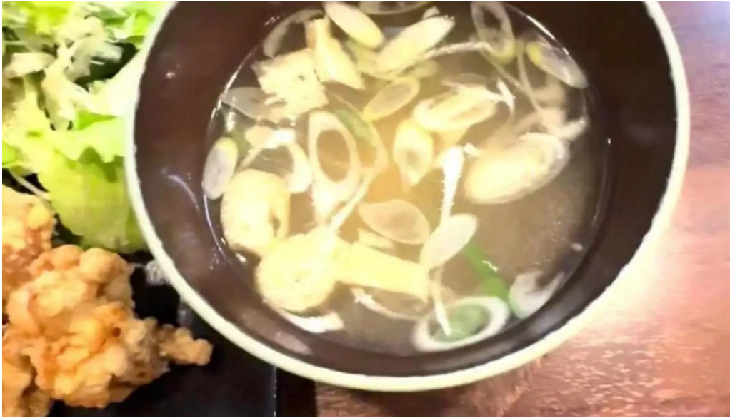
ごはん屋はな スープ