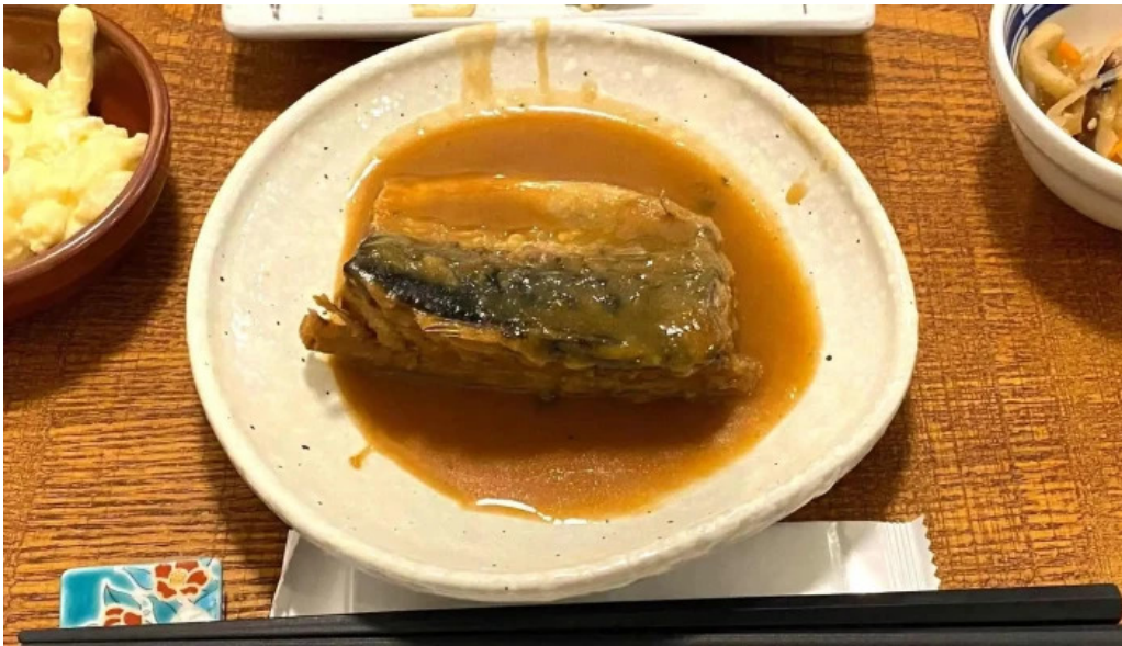
ごはん屋はな 割引