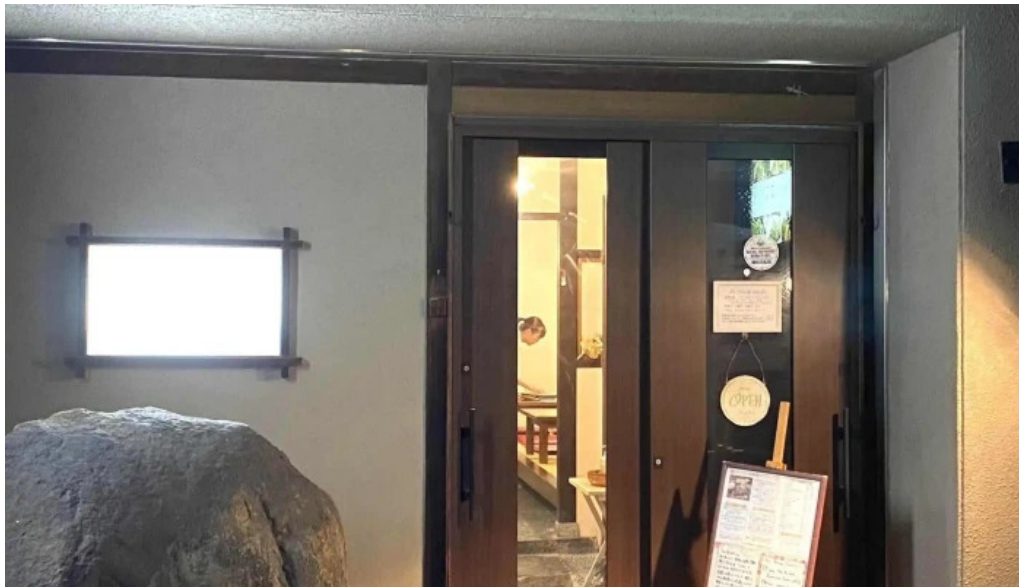
ごはん屋はな 住所