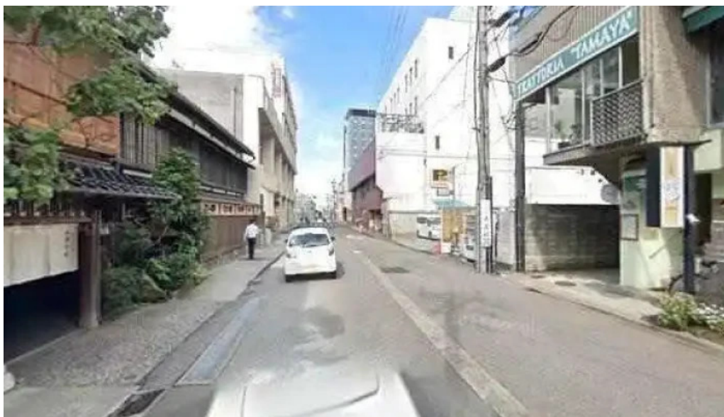
ごはん屋はな 金沢市