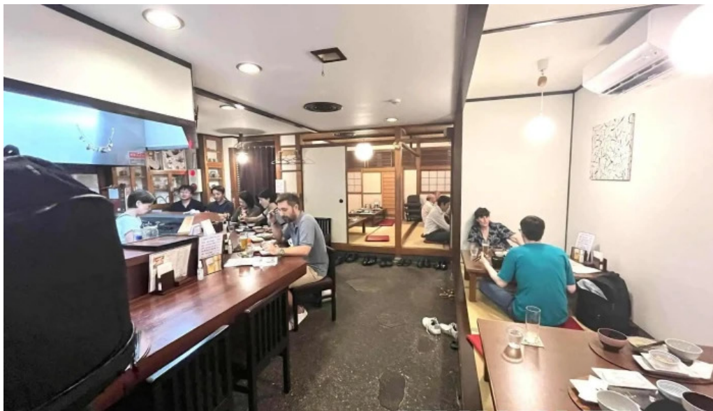
ごはん屋はな 雫囲気