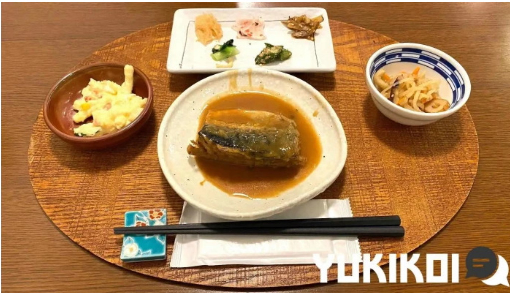
ごはん屋はな サバ