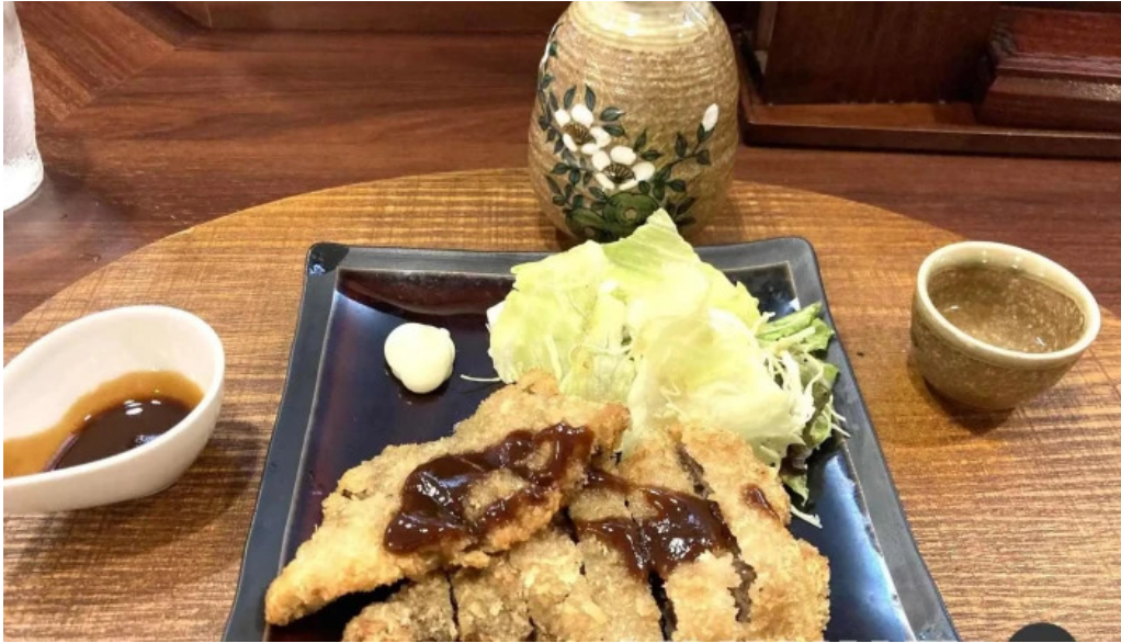
ごはん屋はな 豚カツ