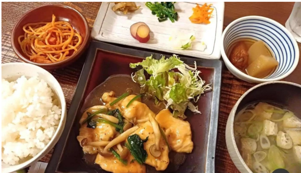
ごはん屋はな 味噌汁