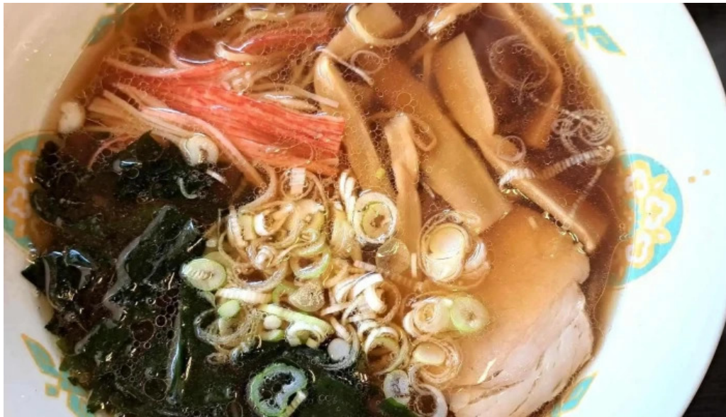
いなほ ウェブサイト