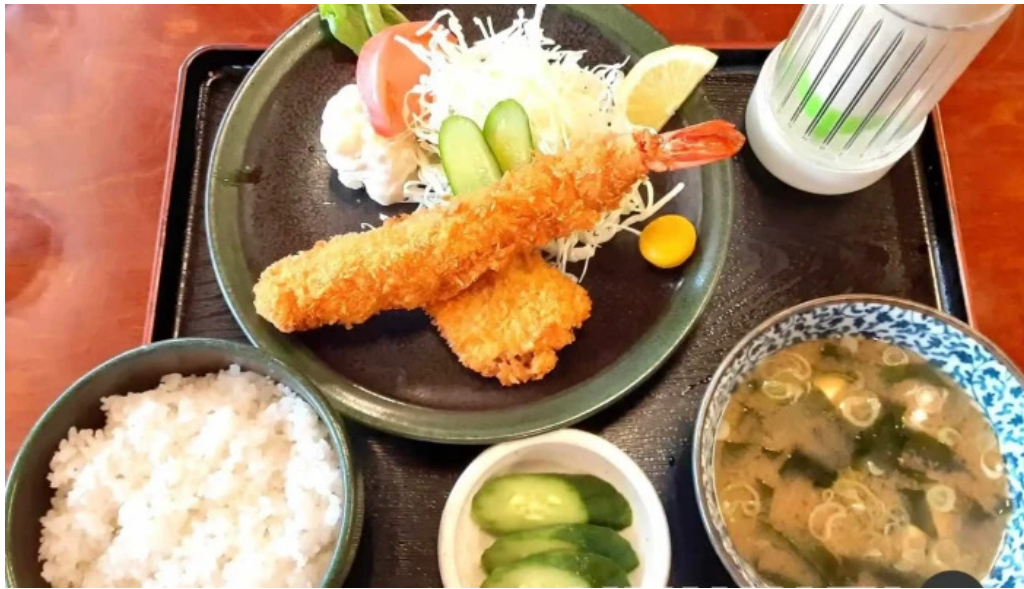
いなほ 料理飲み物