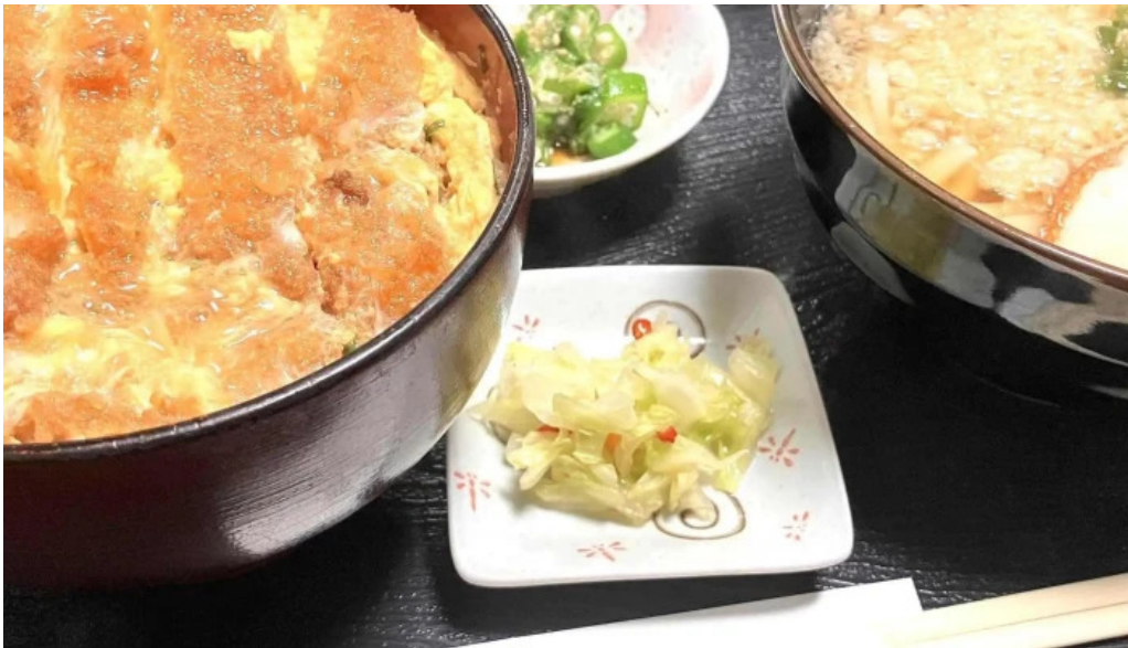
お食事処 平塚茶や 電話