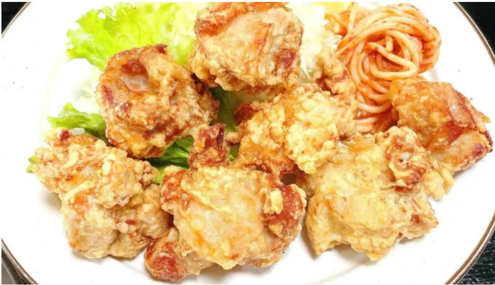
お食事処 平塚茶や 番号