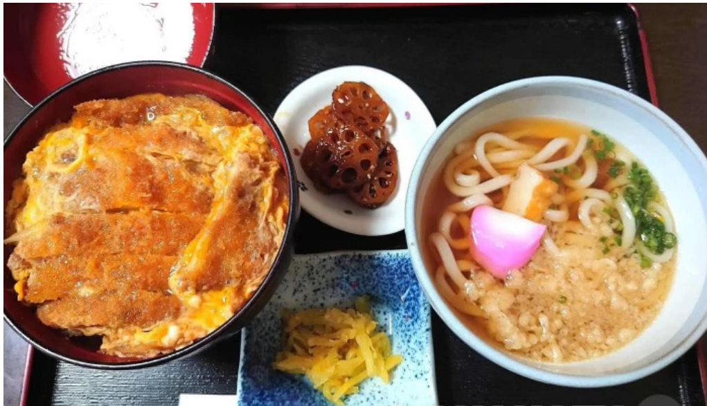
お食事処 平塚茶や カツ丼