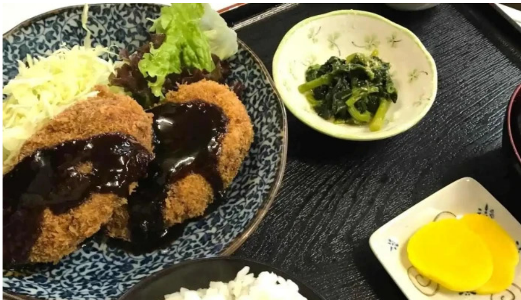
お食事処 平塚茶や オーナー提供