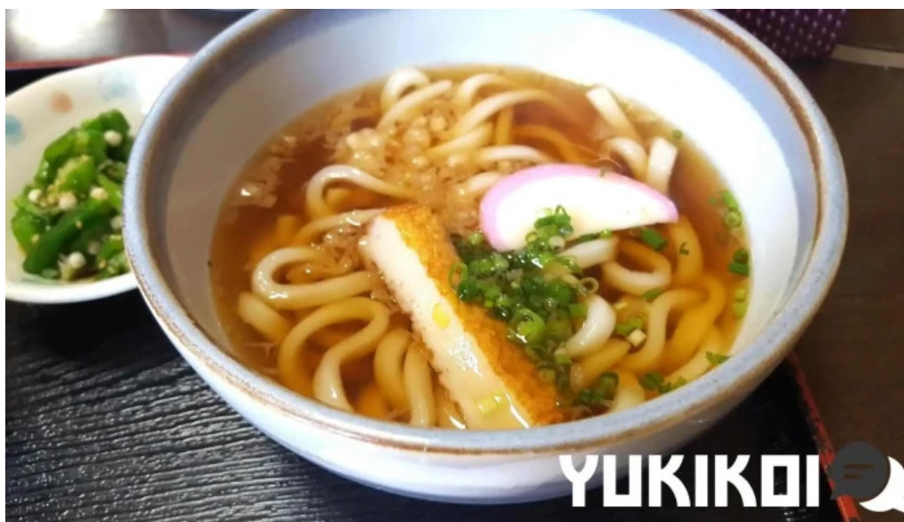
お食事処 平塚茶や 麺