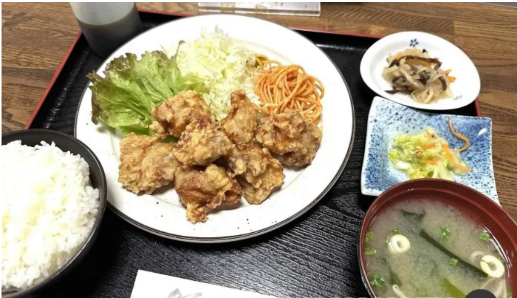
お食事処 平塚茶や 最新