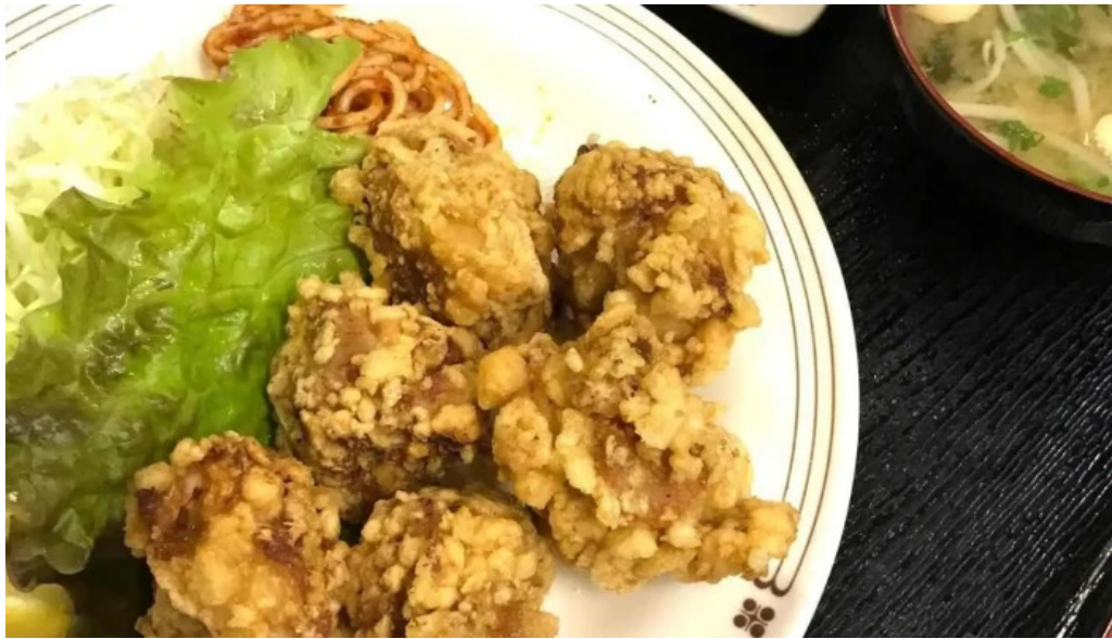
お食事処 平塚茶や から揚げ