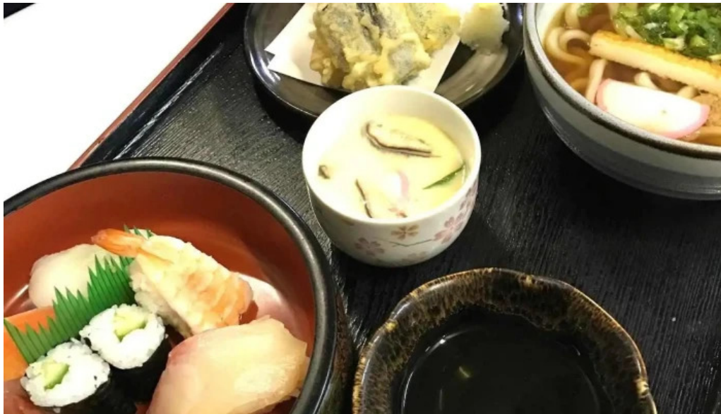
お食事処 平塚茶や 料理飲み物