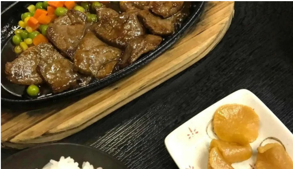
お食事処 平塚茶や 豚カツ