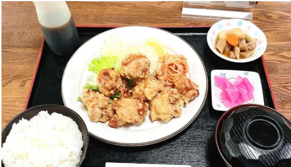
お食事処 平塚茶や instagram