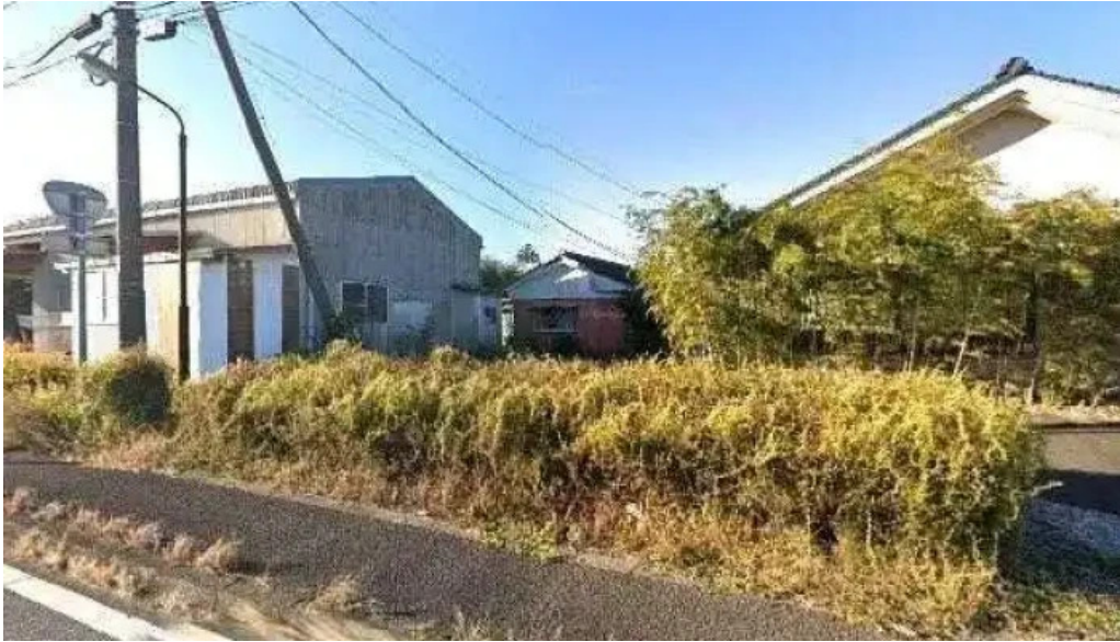
お食事処 平塚茶や 都城市