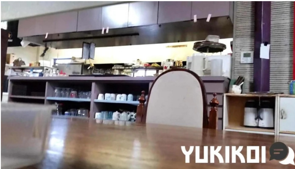
お食事処 平塚茶や 雰囲気