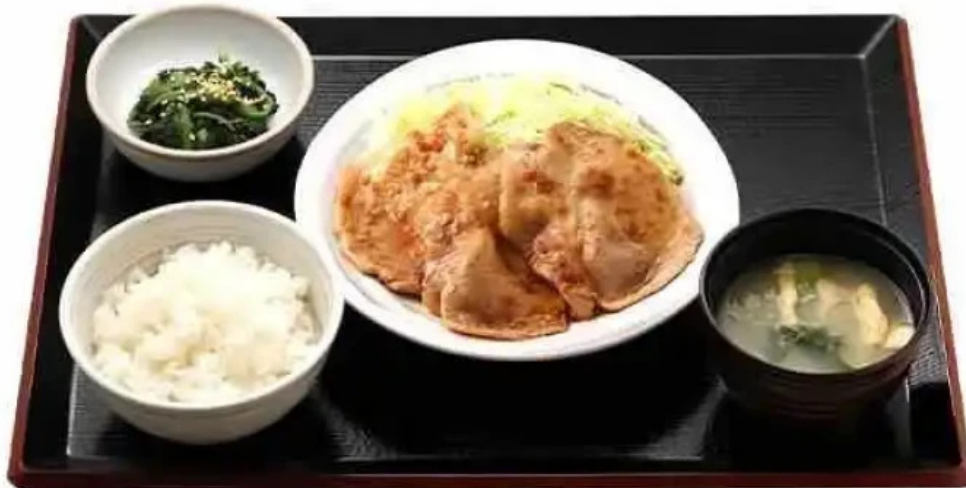
ごはんどき 網走店 スープ