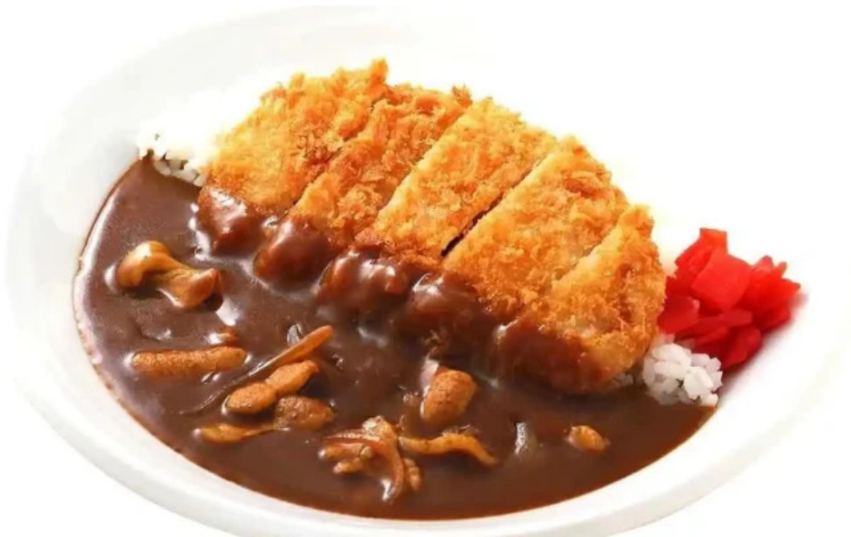
ごはんどき 網走店 すべて