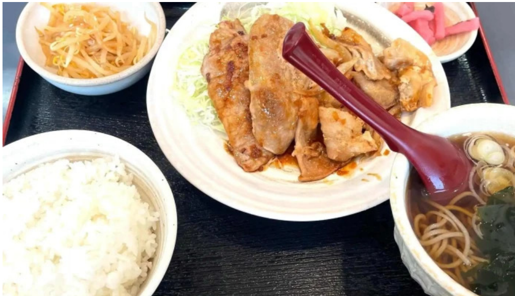
ごはんとき 網走店 comentario 1