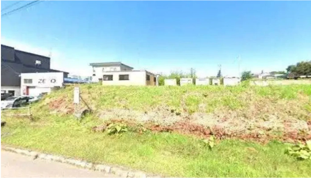
ごはんとき 網走店 ストリートビューと 360 ビュー