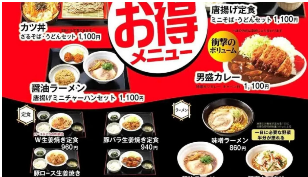
ごはんどき 網走店 メニュー