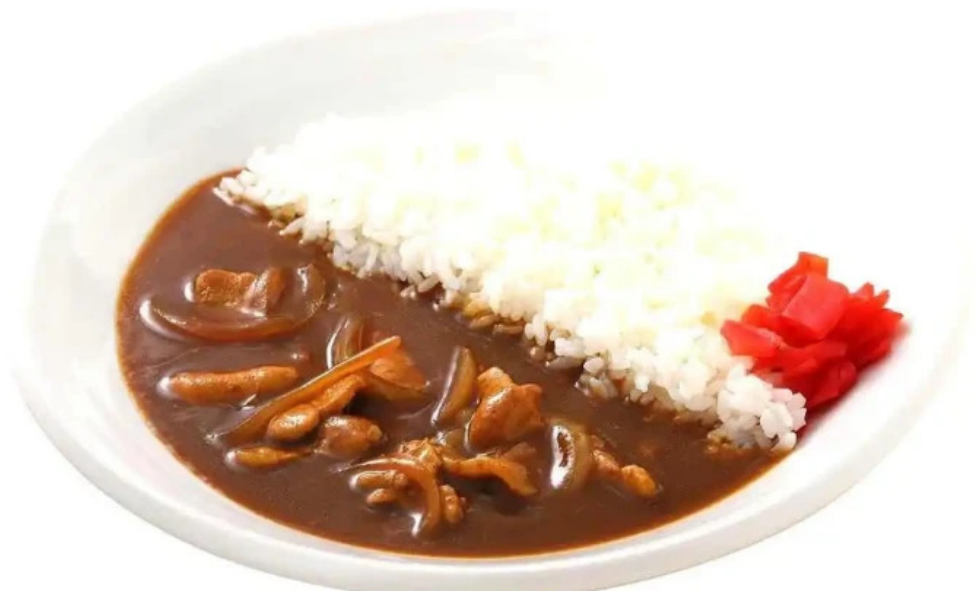
ごはんとき 網走店 カレー