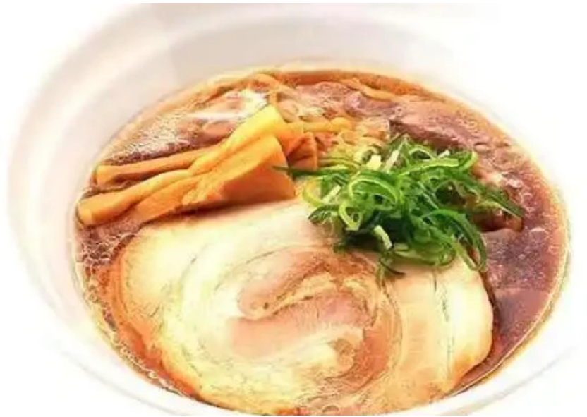
ごはんどき 網走店 料理飲み物