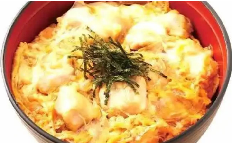
ごはんどき 網走店