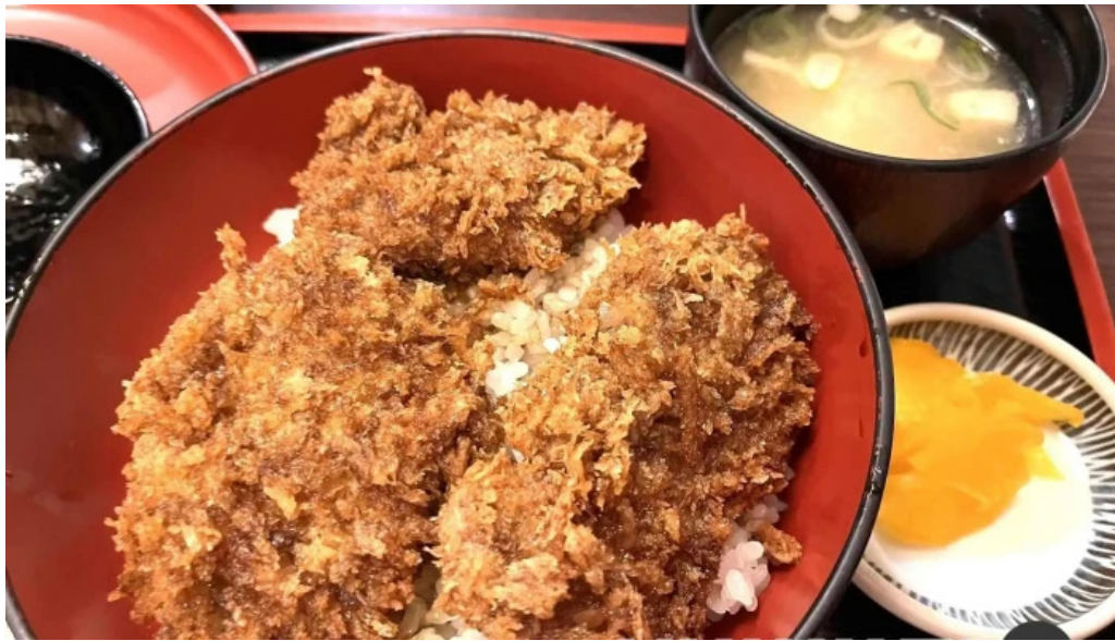
ほていや食堂 豚カツ