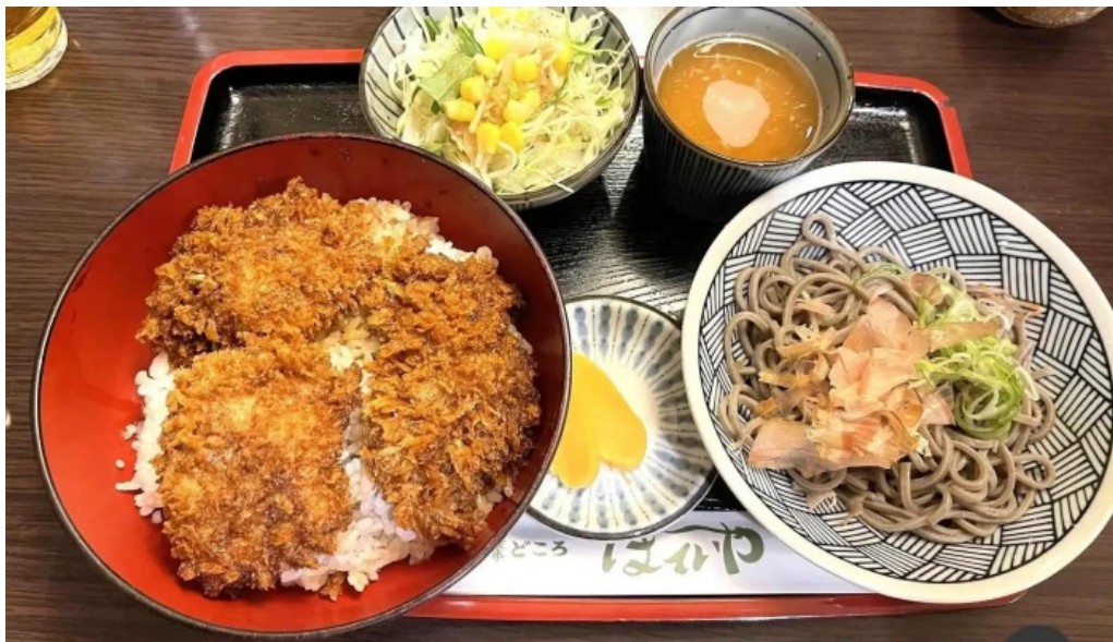
ほていや食堂 料理飲み物