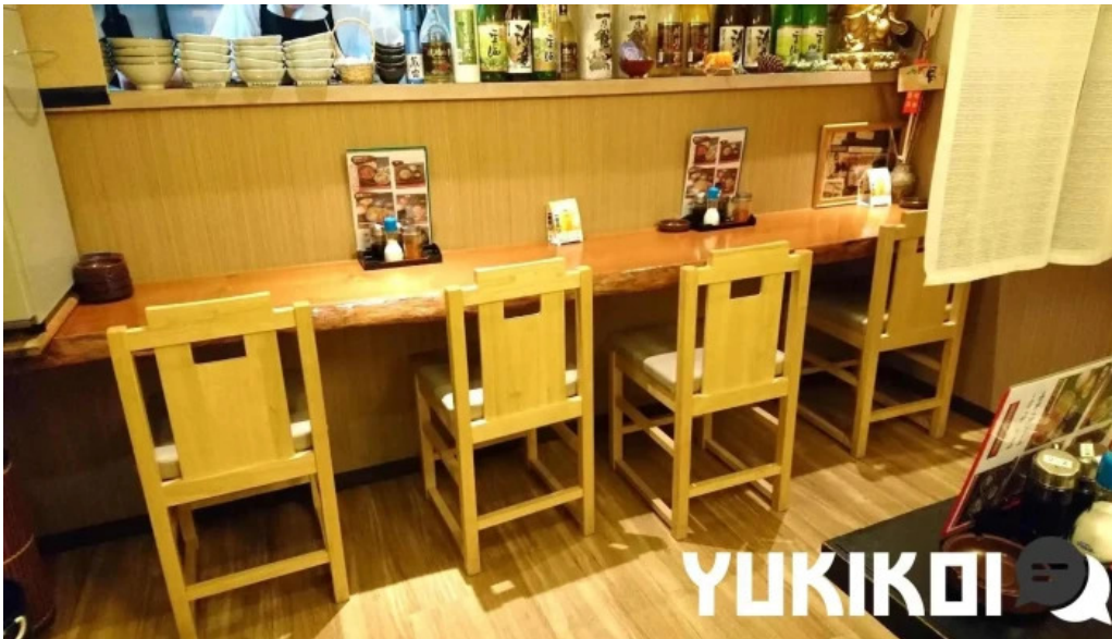
ほていや食堂 雰囲気