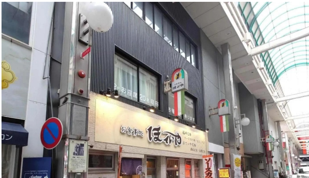
ほていや食堂 comentario 3