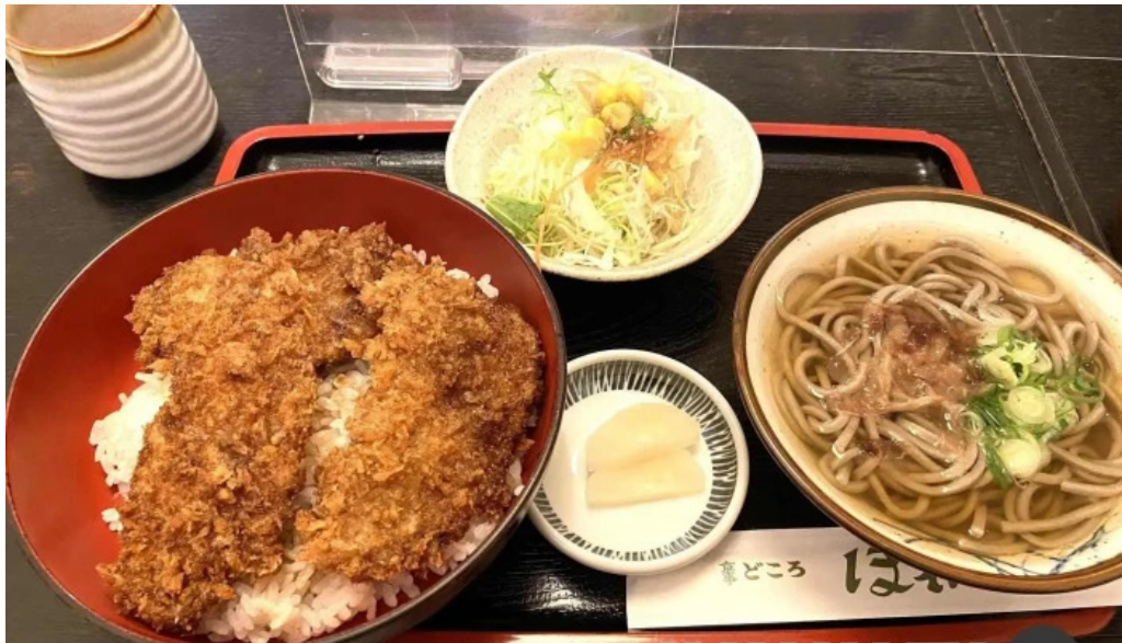
ほていや食堂 スープ