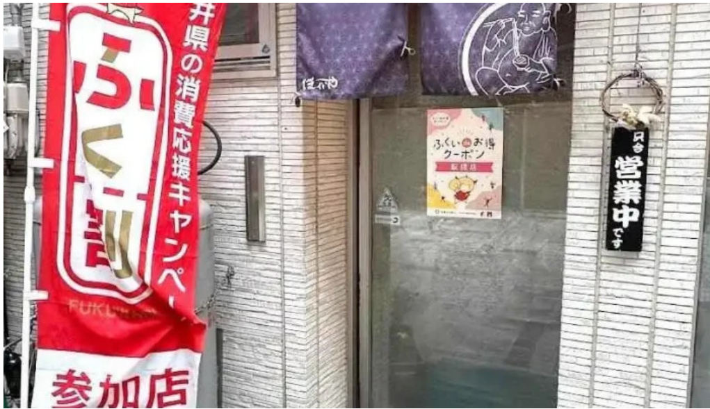
ほていや食堂 福井市