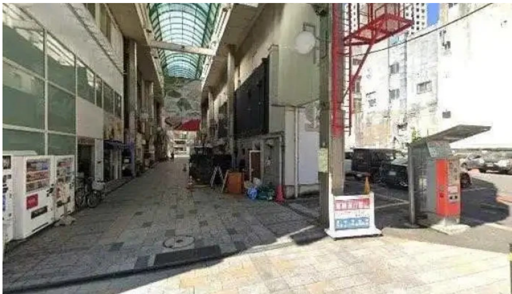
ほていや食堂 ストリートビューと 360 ビュー