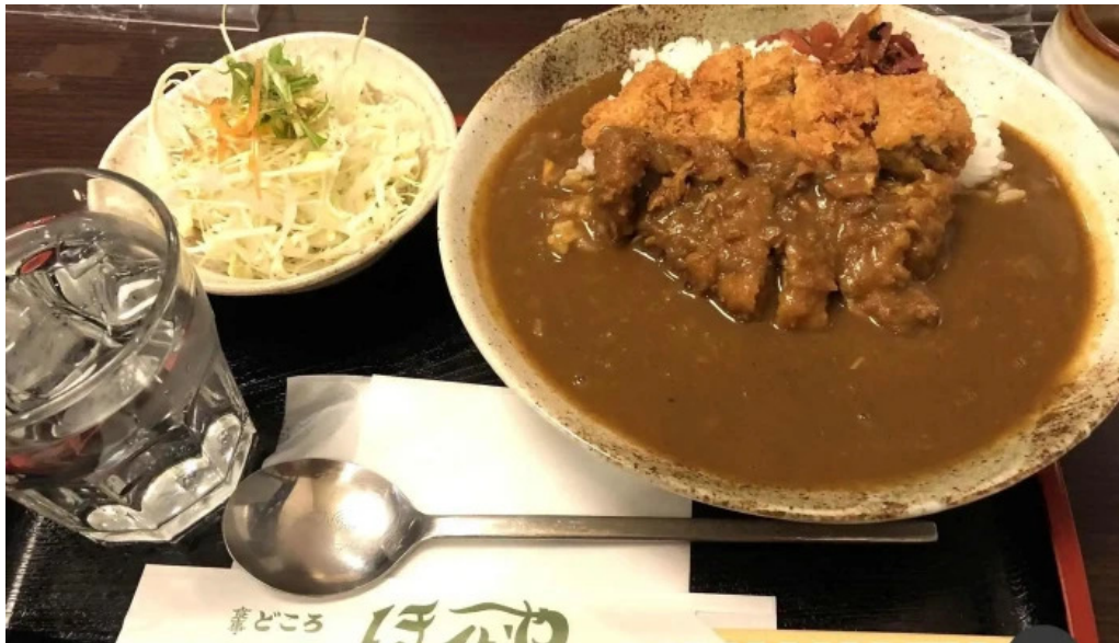
ほていや食堂 カレー