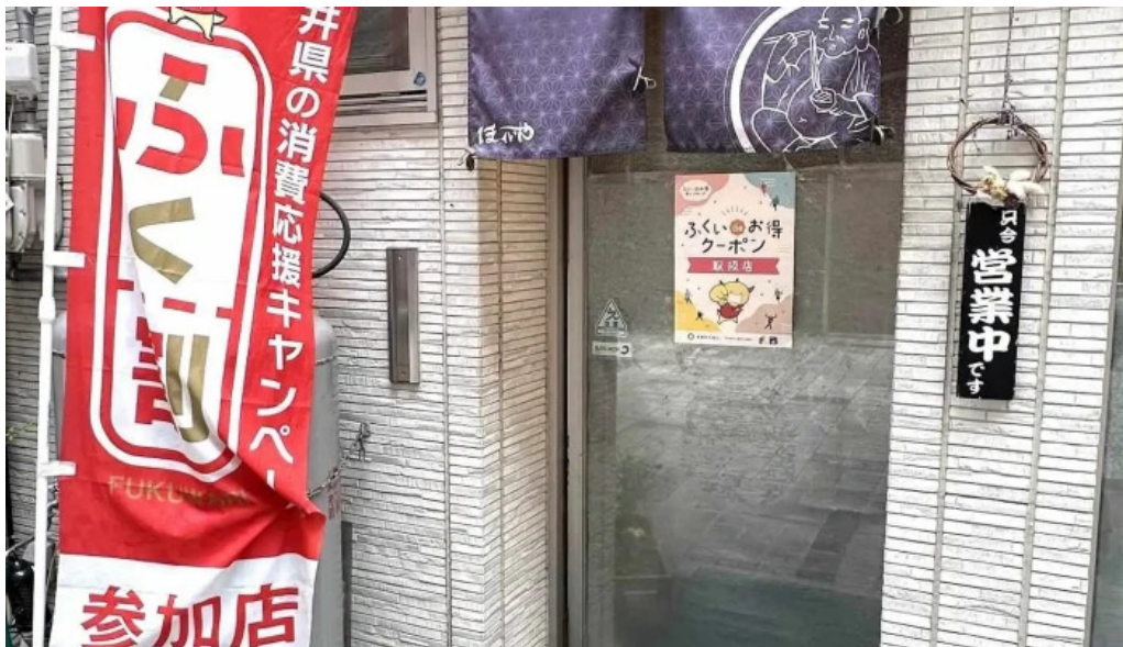
ほていや食堂 すべて