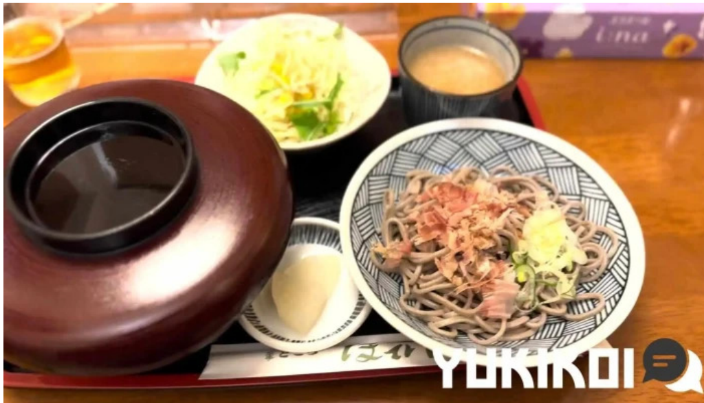
ほていや食堂 蕎麦