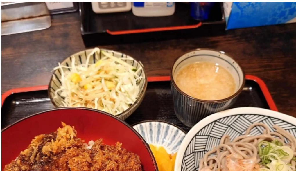
ほていや食堂 comentario 1