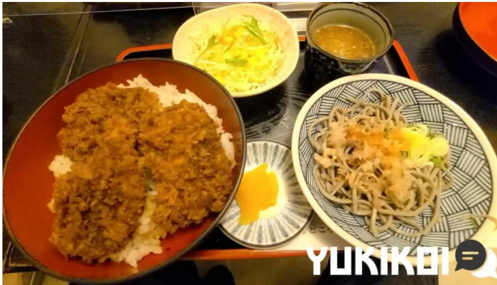
ほていや食堂 動画