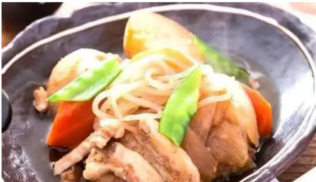
土鍋炊ごはん なかよし 目黒店 麺