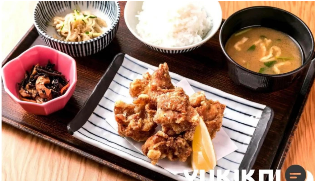
土鍋炊ごはん なかよし 目黒店 から揚げ