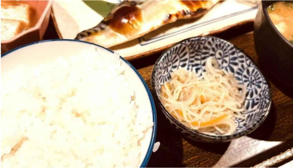
土鍋炊ごはん なかよし 目黒店 行き方