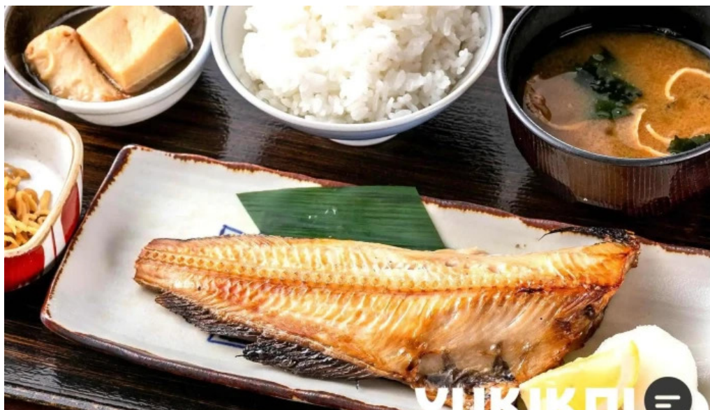
土鍋炊ごはん なかよし 目黒店 スープ