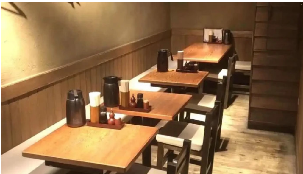
土鍋炊ごはん なかよし 目黒店 雰囲気