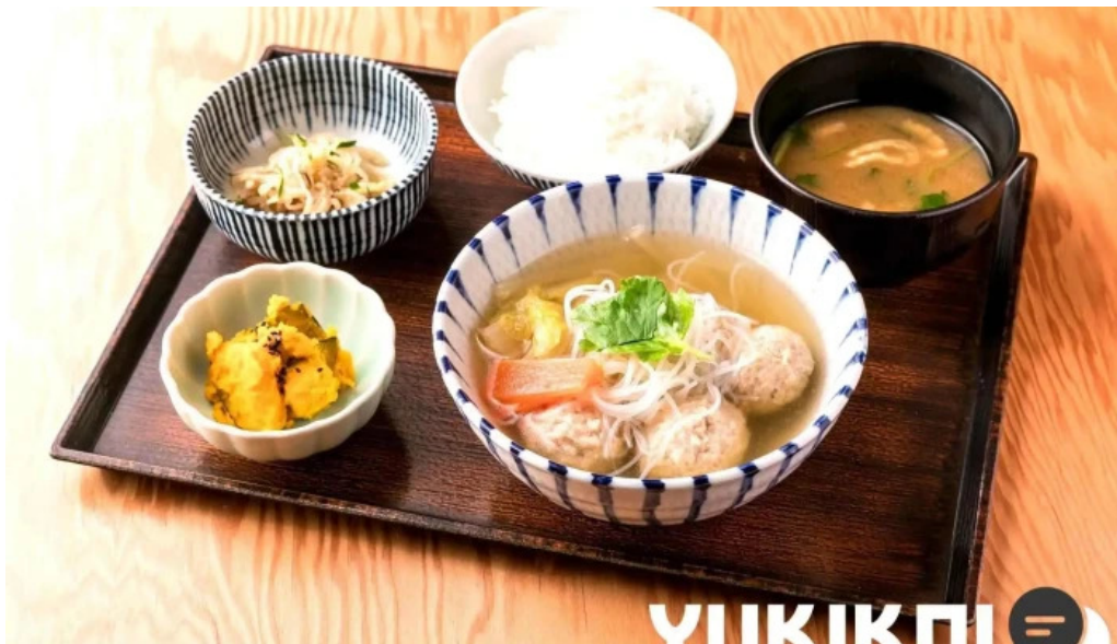
土鍋炊ごはん なかよし 目黒店 料理飲み物