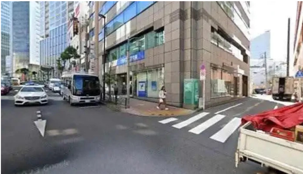
土鍋炊ごはん なかよし 目黒店 目黒区