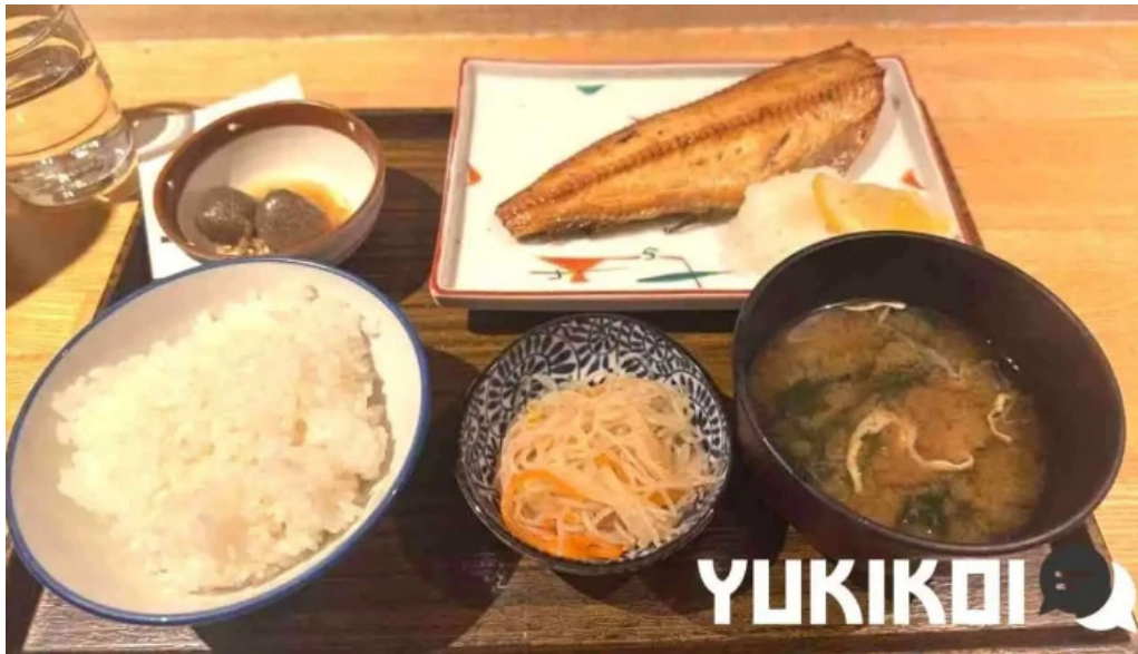
土鍋炊ごはん なかよし 目黒店 最新