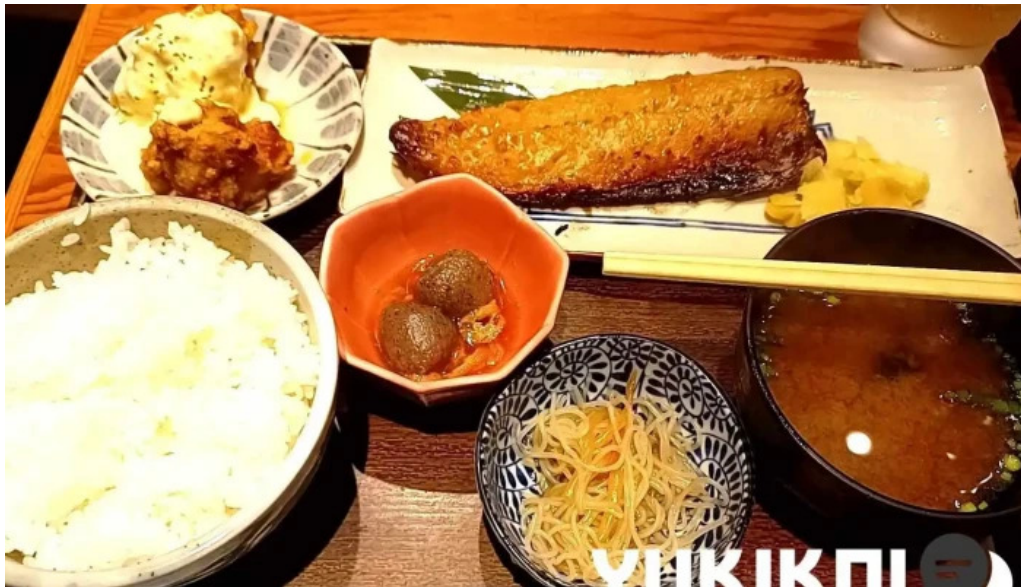
土鍋炊ごはん なかよし 目黒店 サバ