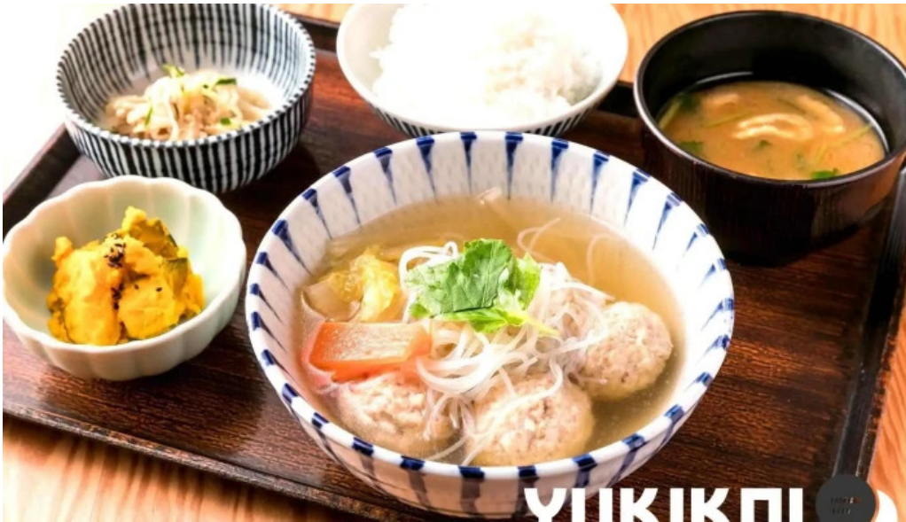
土鍋炊ごはん なかよし 目黒店 ラーメン