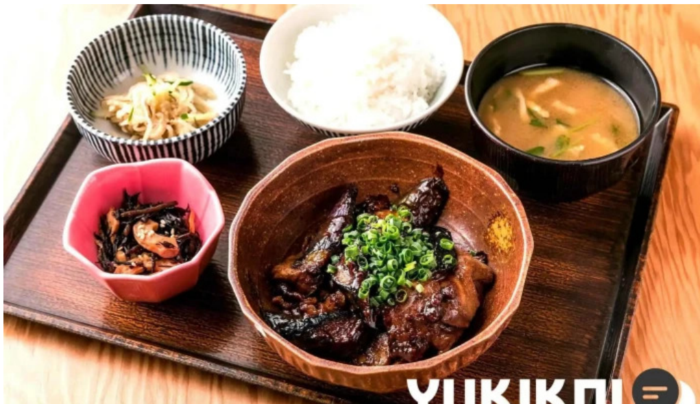
土鍋炊ごはん なかよし 目黒店