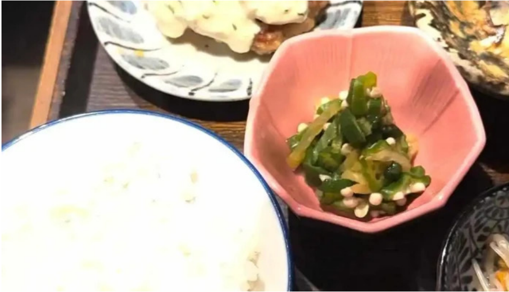
土鍋炊ごはん なかよし 目黒店 動画