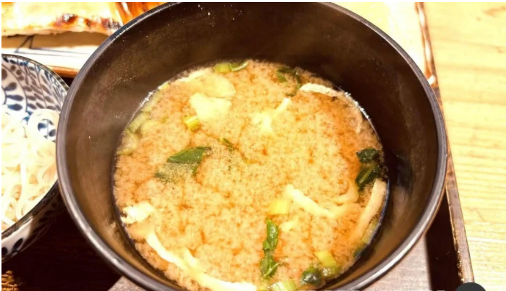
土鍋炊ごはん なかよし 目黒店 味噌汁