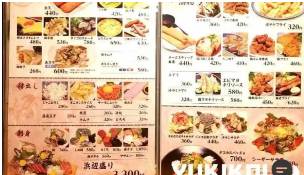
豆狸まめだメニュー