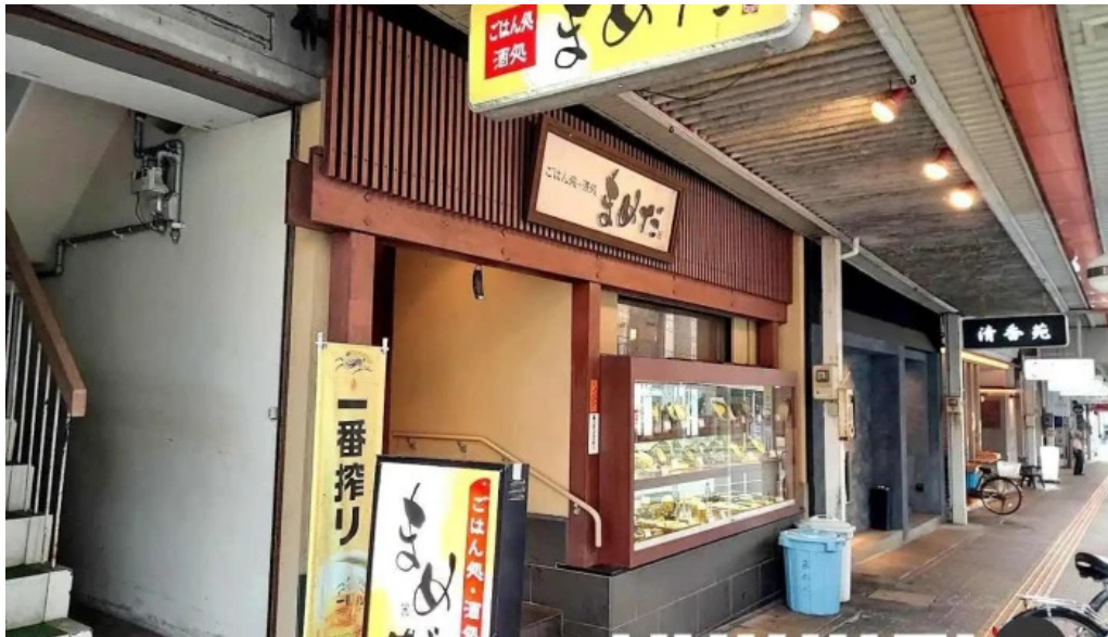
豆狸 まめだ 浜田市