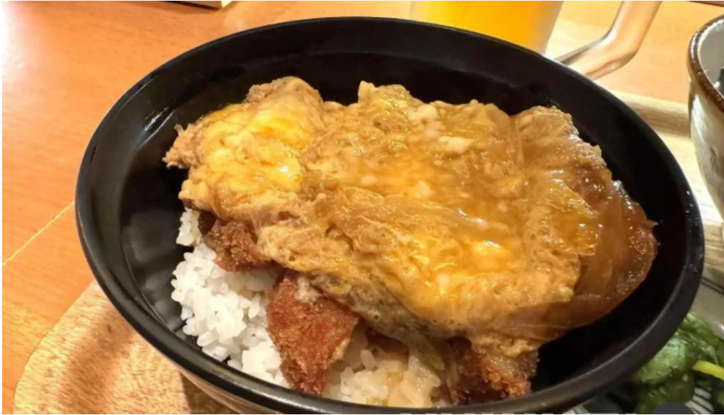
豆狸まめだ カツ丼