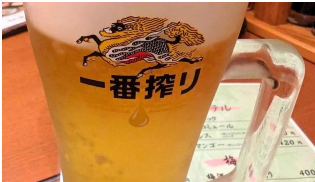
豆狸まめだビール