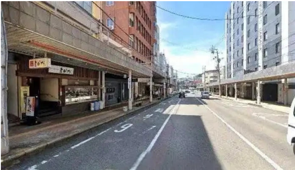
豆狸まめだ ストリートビューと 360 ビュー