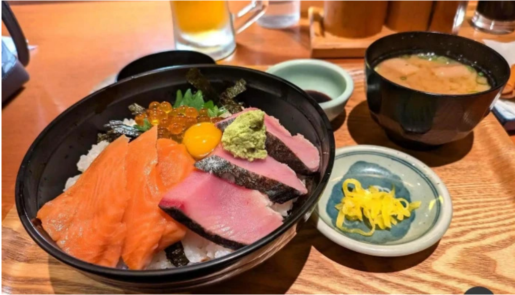
豆狸まめだ スープ