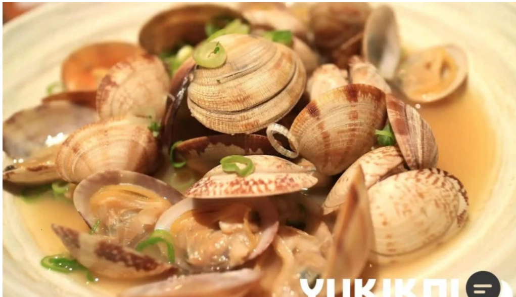
豆狸まめだ 料理飲み物