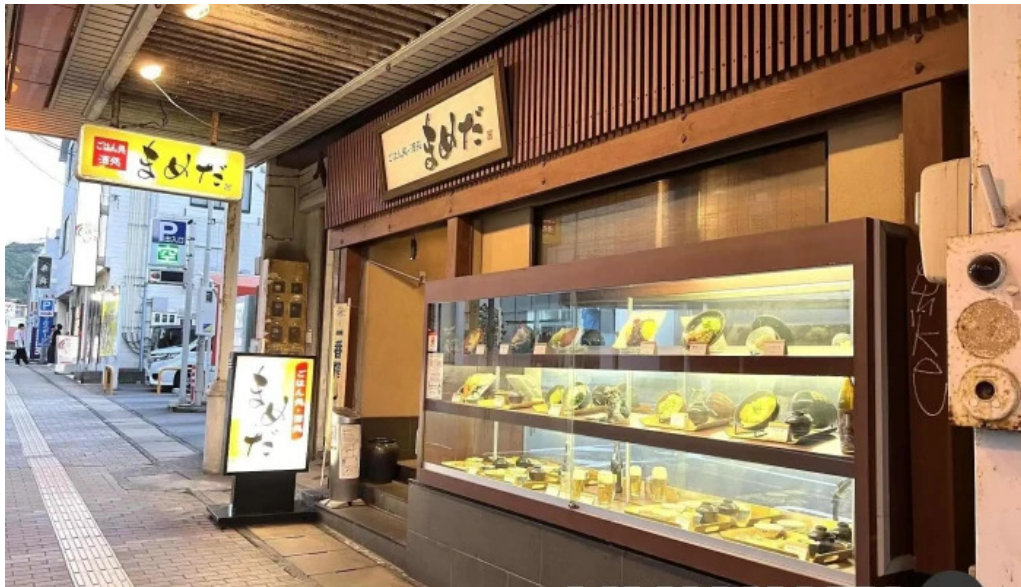
豆狸まめだ 雰囲気