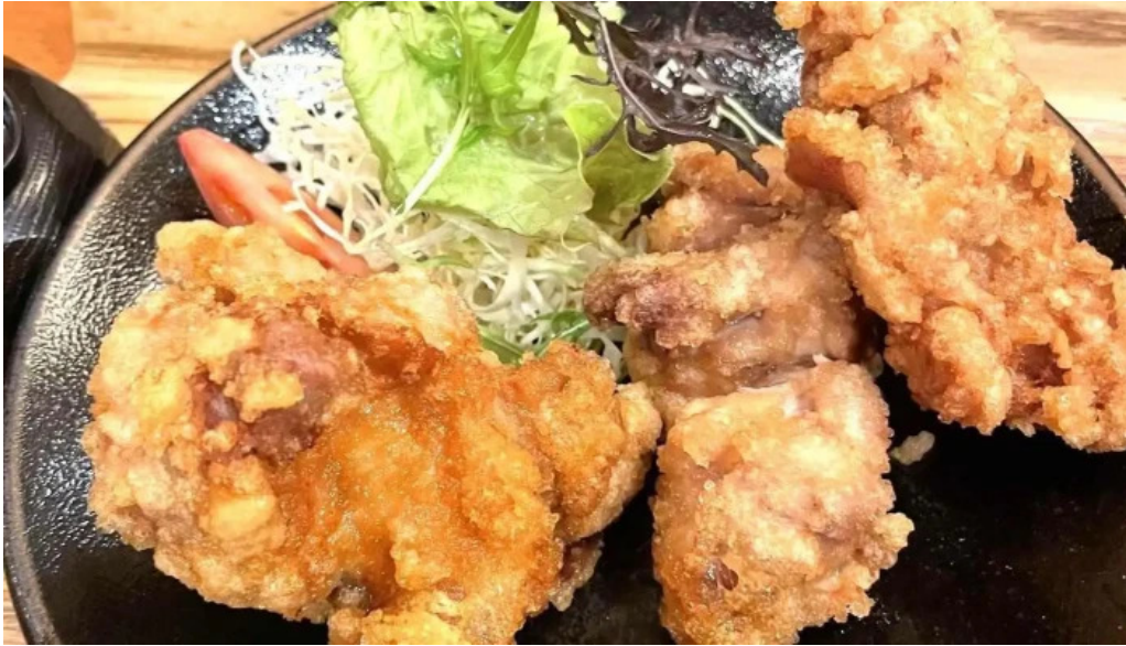
豆狸まめだ から揚げ