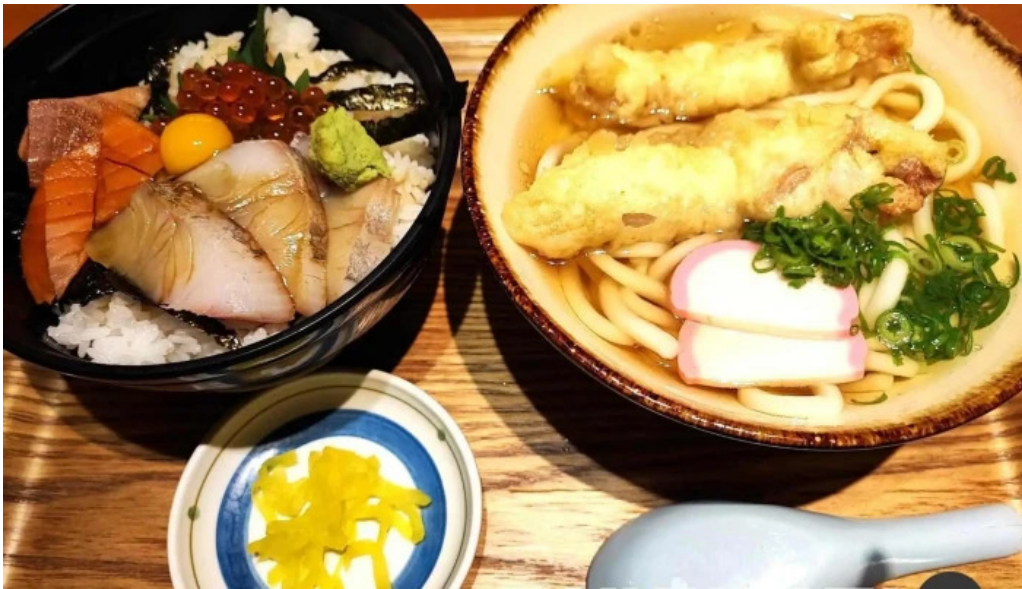
豆狸まめだ うどん