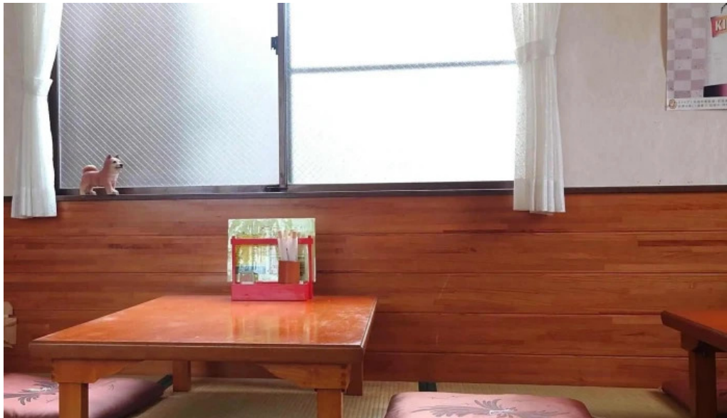
井乃食堂 comentario 4