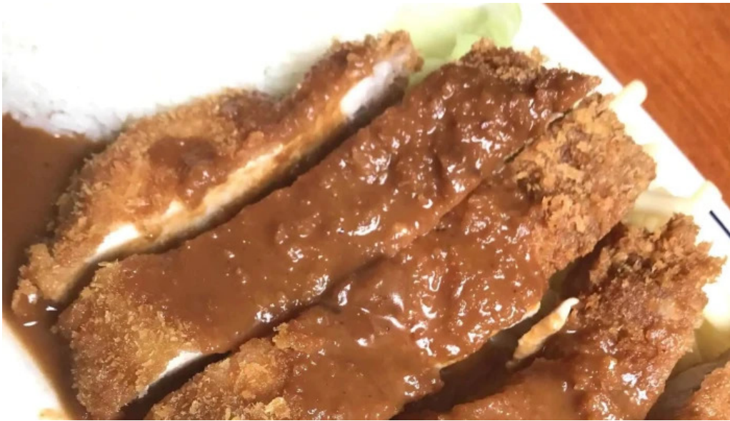
井乃食堂 comentario 8