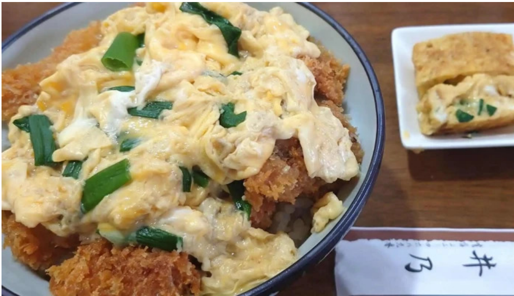
井乃食堂 comentario 7