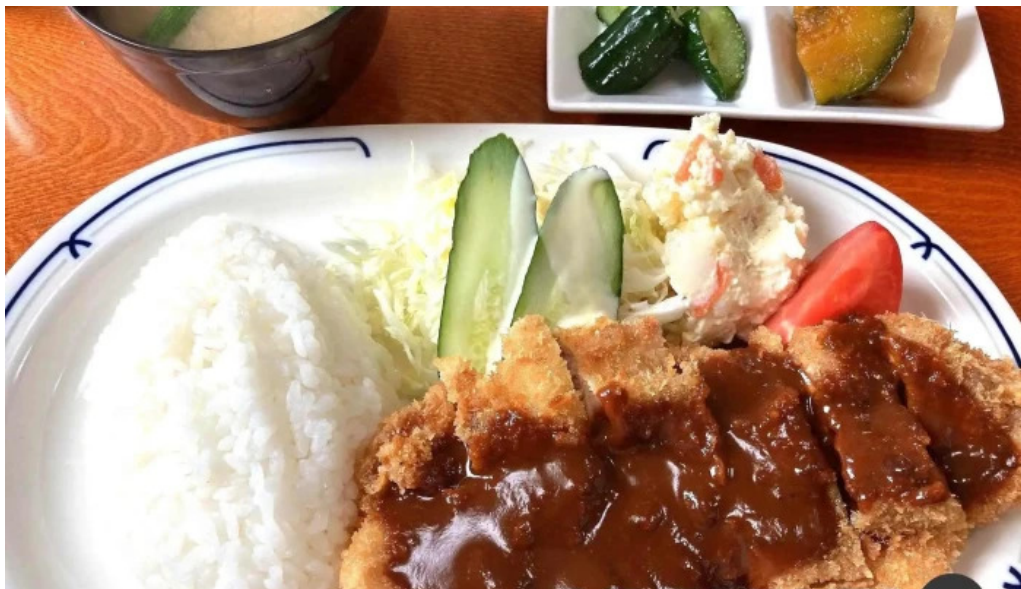
井乃食堂 料理飲み物