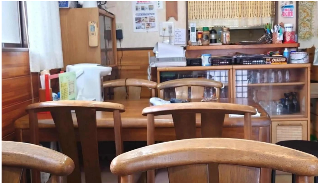
井乃食堂 comentario 5