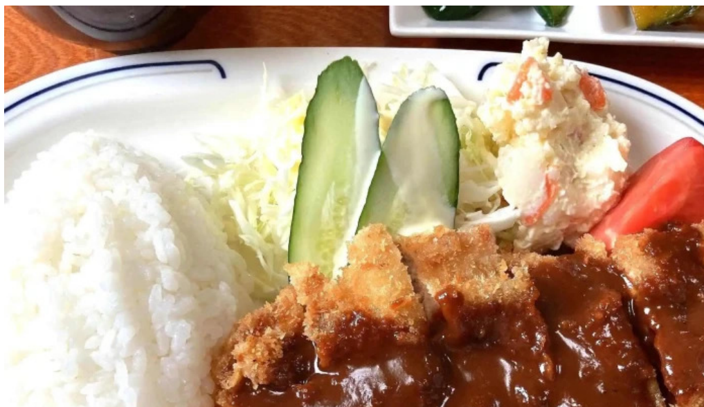
井乃食堂 comentario 1