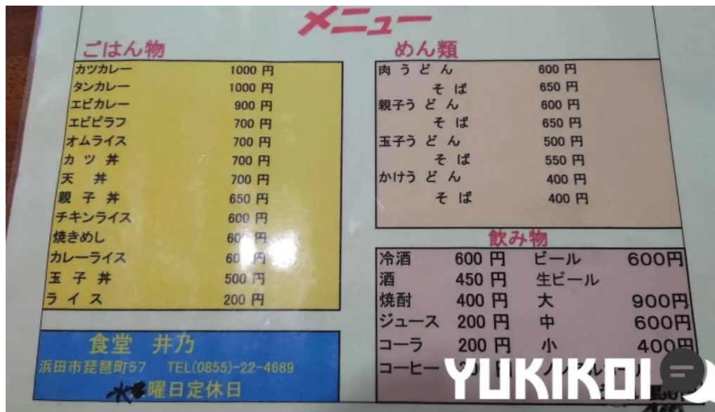
井乃食堂 メニュー