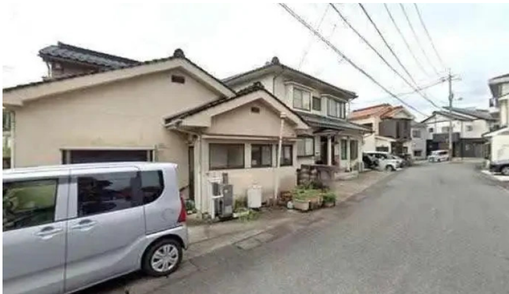
井乃食堂 ストリートビューと 360 ビュー