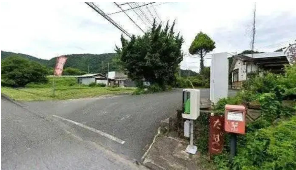
やま茶家 ストリートビューと 360 ビュー