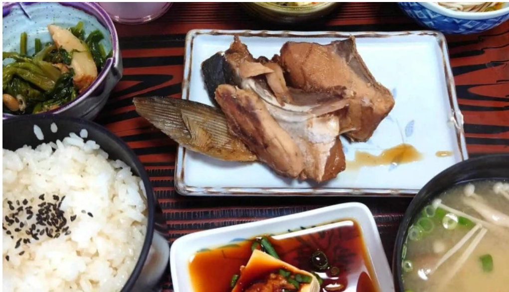
やま茶家 comentario 2