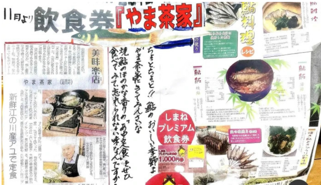
やま茶家 メニュー