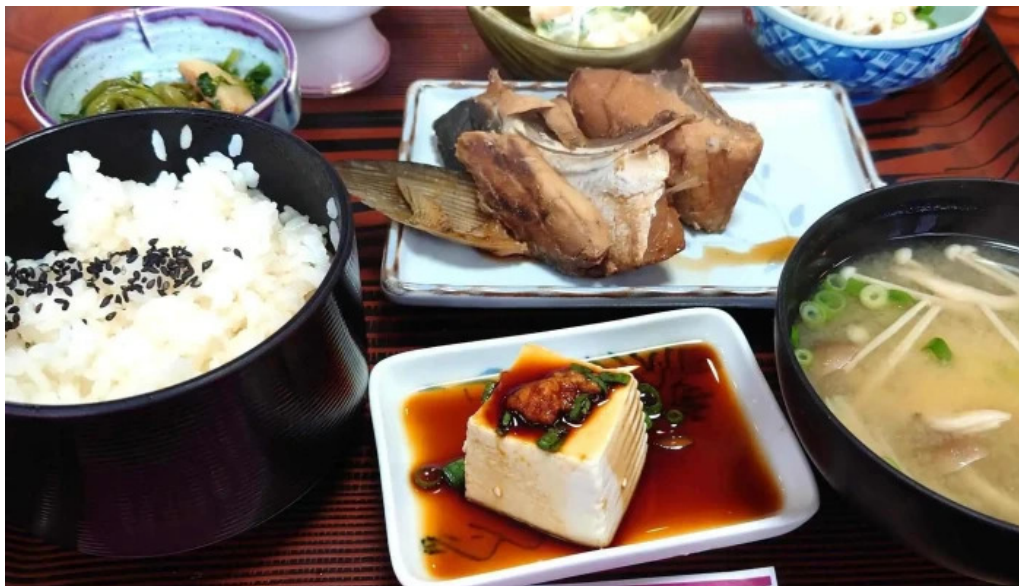
やま茶家 comentario 3