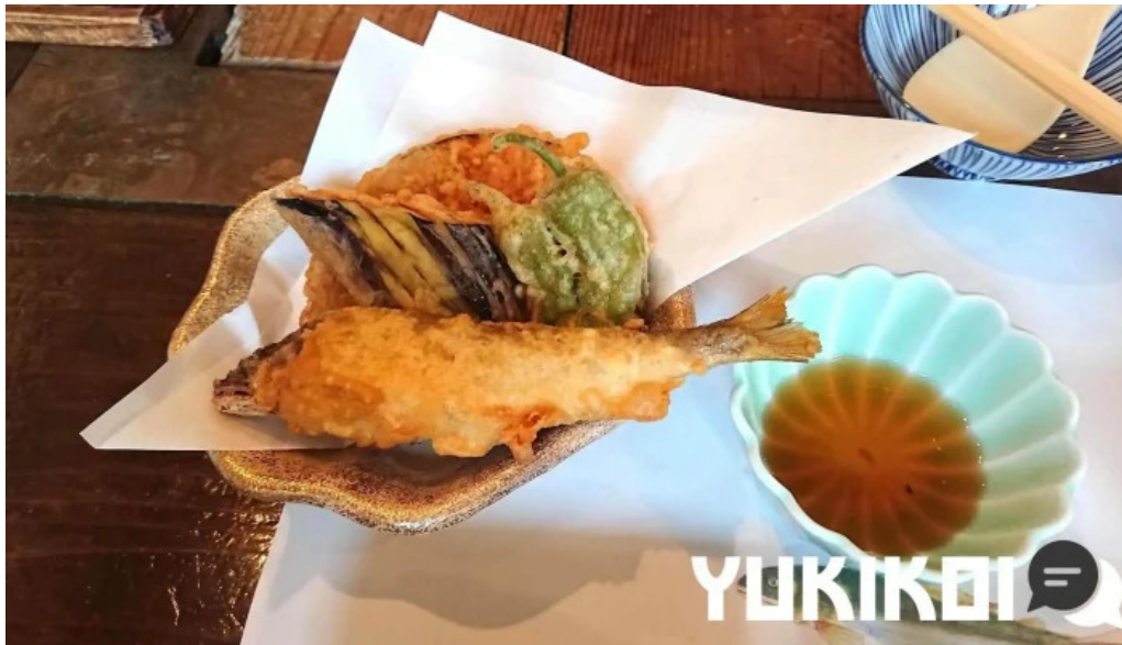
やま茶家 料理飲み物