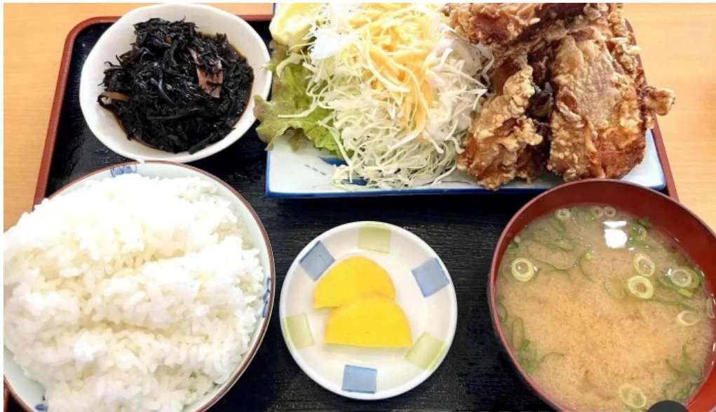
地産おうえん 枚方もりもり亭 スープ