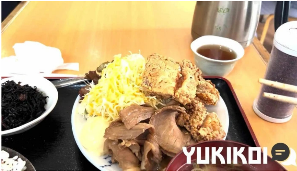
地産おうえん 枚方もりもり亭 動画