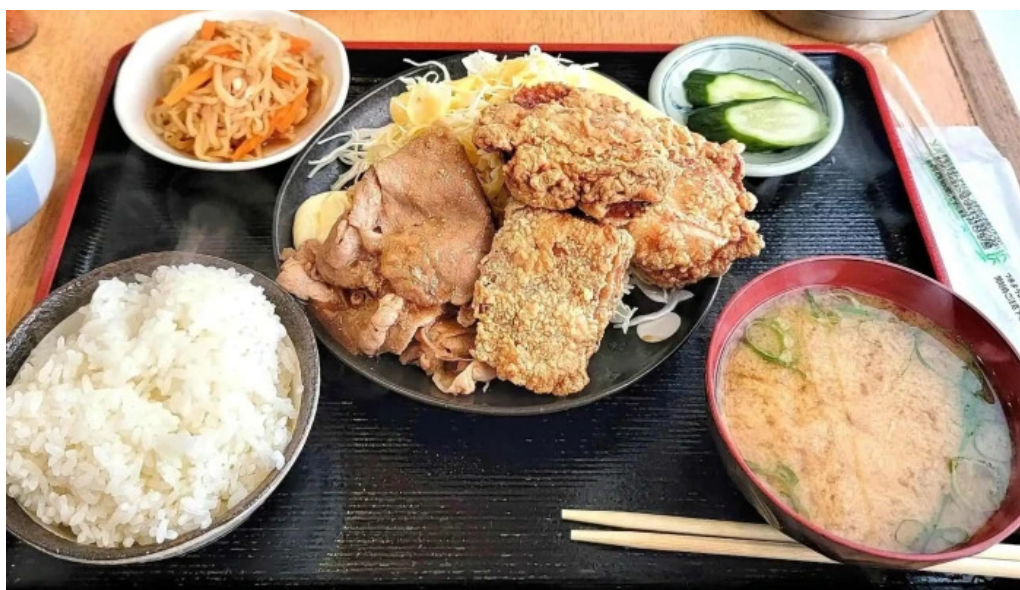
地産おうえん 枚方もりもり亭 豚カツ