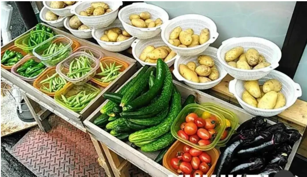
地産おうえん 枚方もりもり亭 料理飲み物