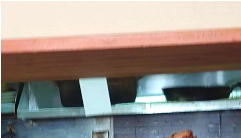
地産おうえん 枚方もりもり亭 写真