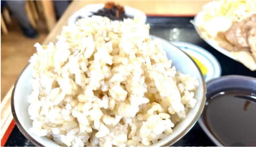
地産おうえん 枚方もりもり亭 玄米