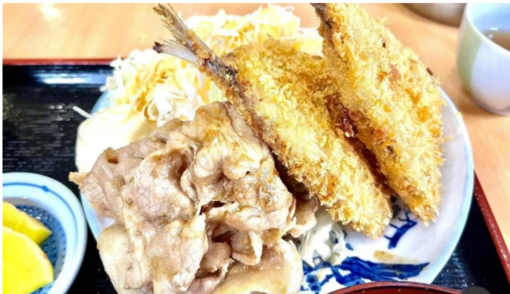
地産おうえん 枚方もりもり亭 から揚げ