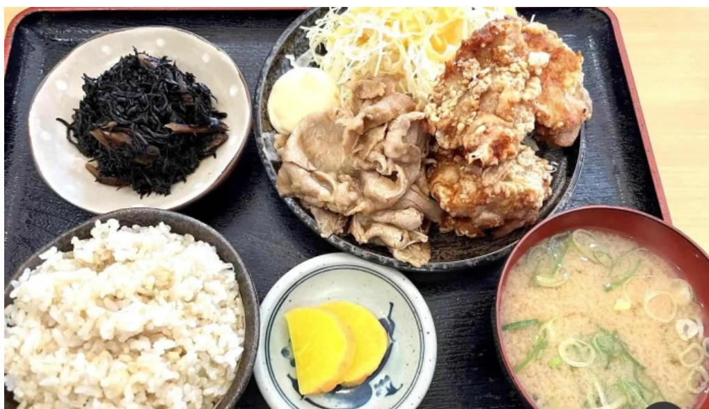
地産おうえん 枚方もりもり亭 麺