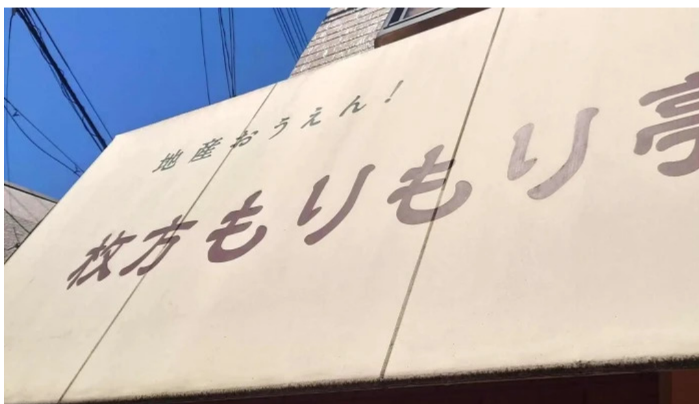
地産おうえん 枚方もりもり亭 番号