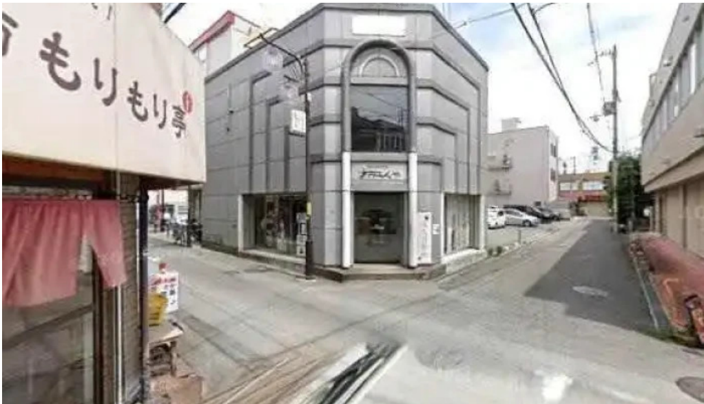
地産おうえん 枚方もりもり亭 枚方市