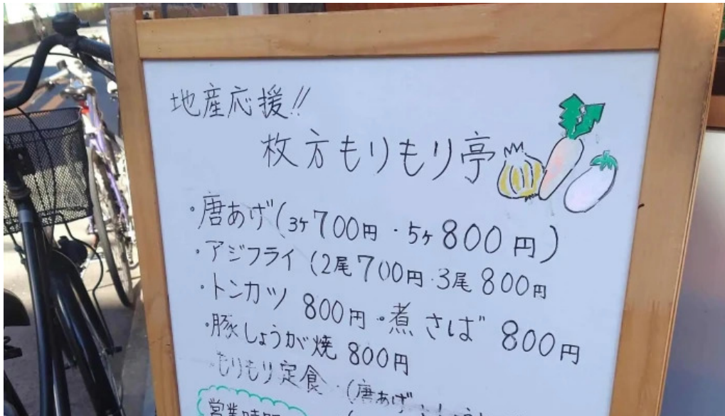
地産おうえん 枚方もりもり亭 instagram