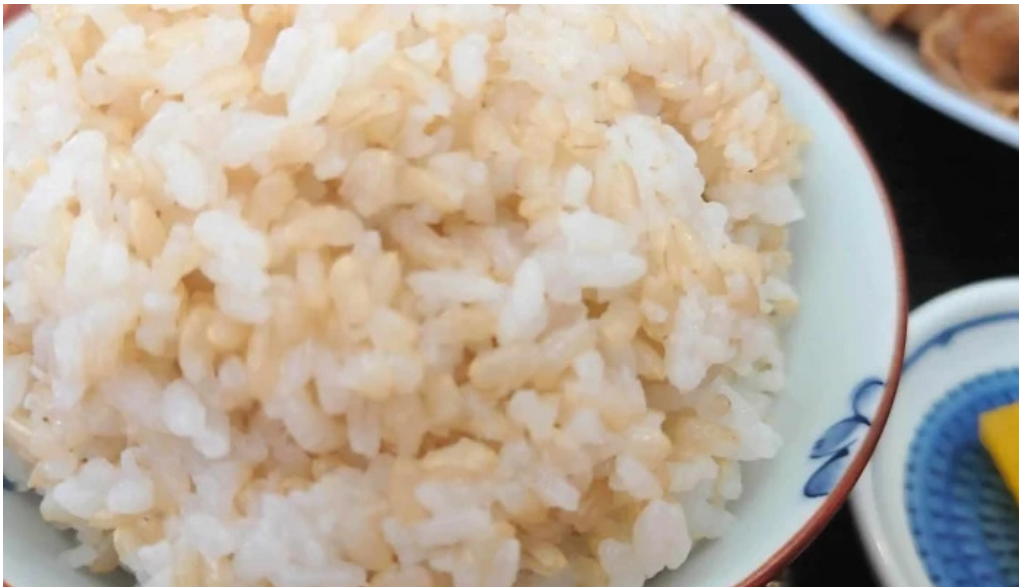
地産おうえん 枚方もりもり亭 プロモーション