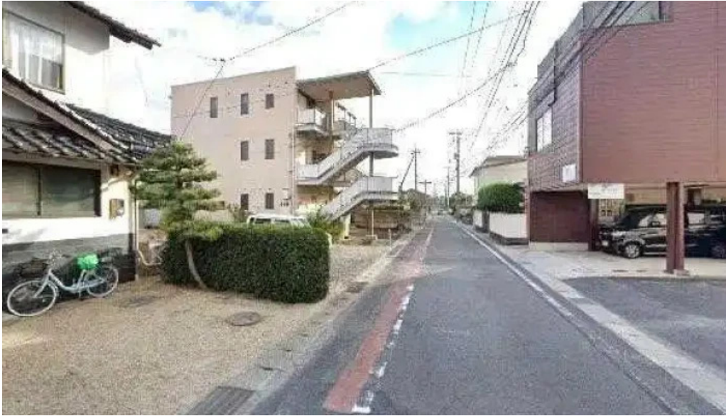
お食事処 ぶの 松江市