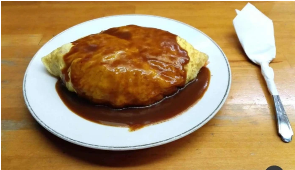
お食事処 ぶの オムライス