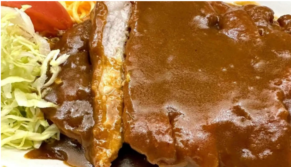
お食事処 ぶの エリア