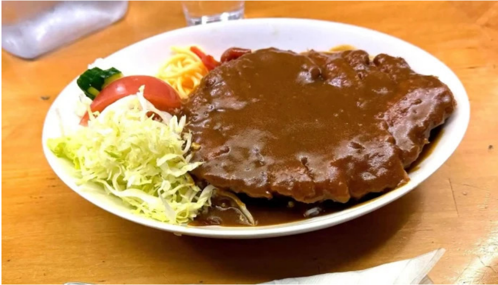
お食事処 ぶの 豚カツ