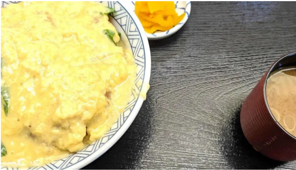
お食事処 ぶの コメント