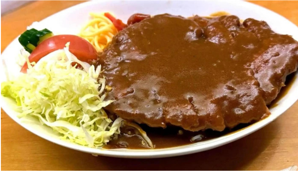
お食事処 ぶの プロモーション