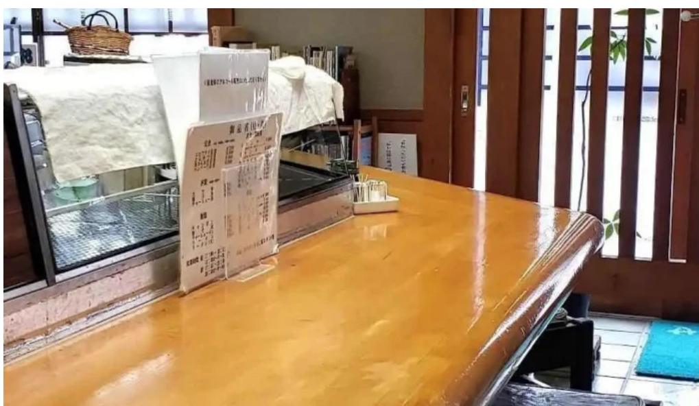
お食事処 ふの 雰囲気