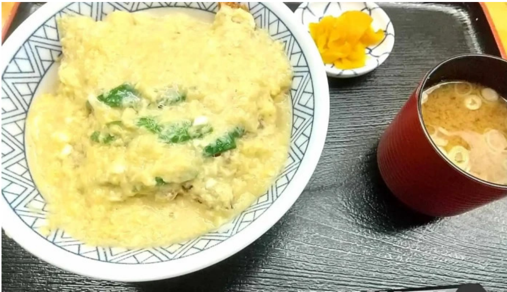
お食事処 ぶの スープ