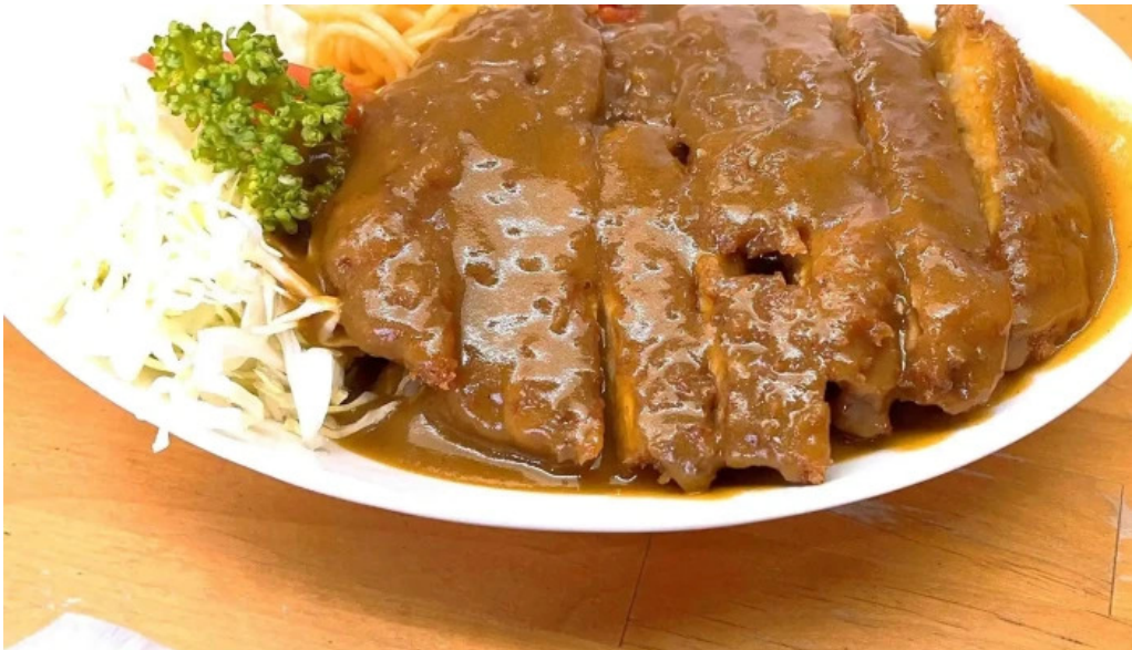
お食事処 ぶの 番号