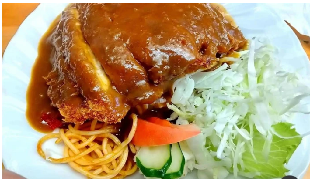
お食事処 ふの 麺