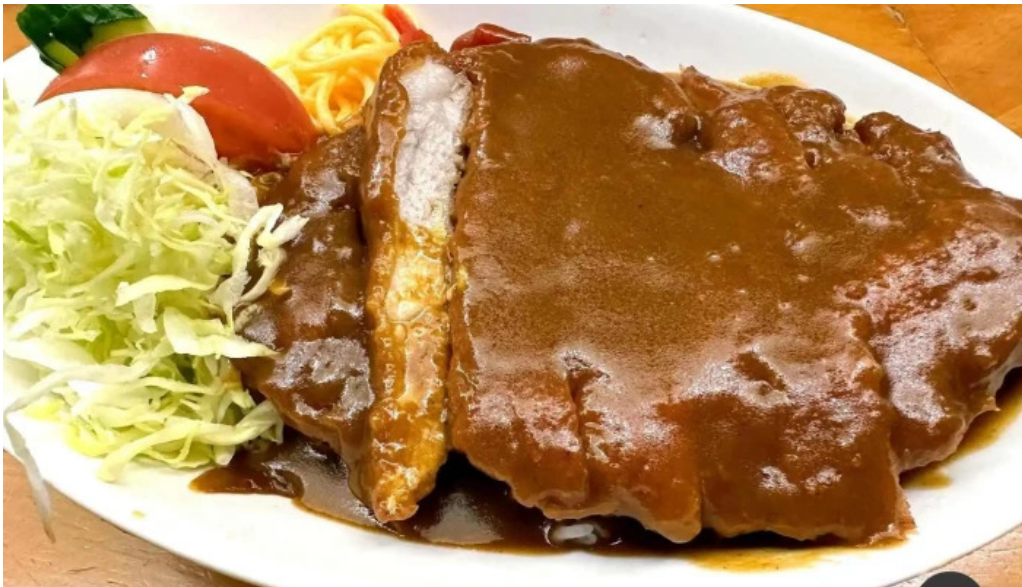
お食事処 ぶの 料理飲み物