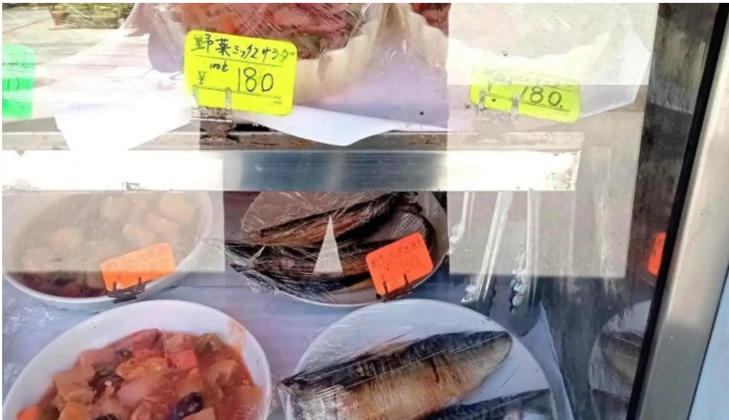
御食事処 大屋 料理飲み物