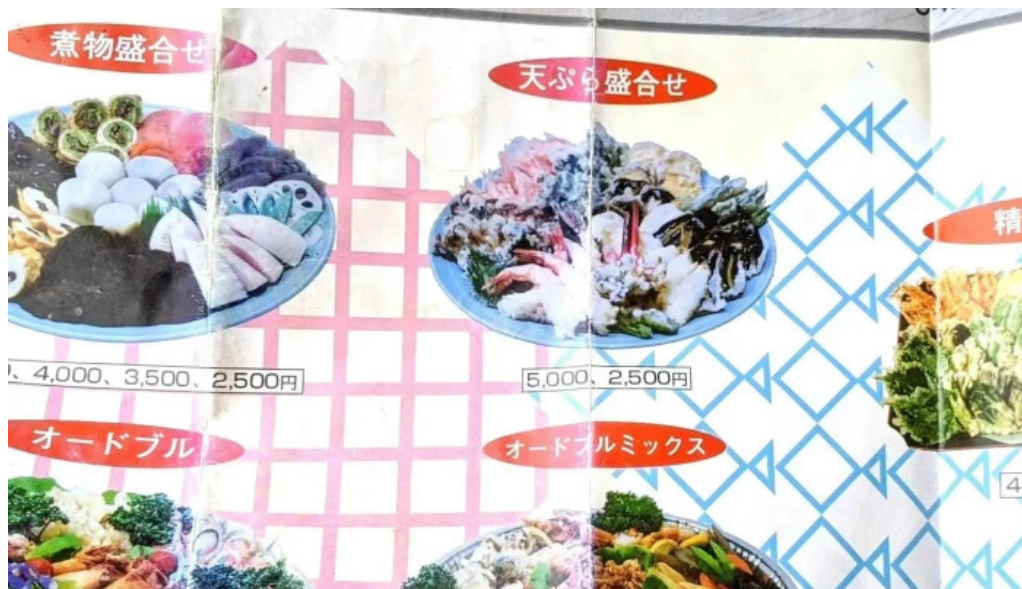
御食事処 大屋 営業中