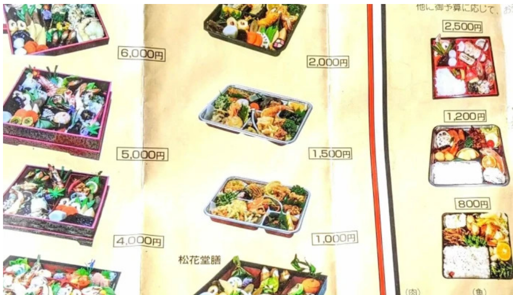
御食事処 大屋 写真