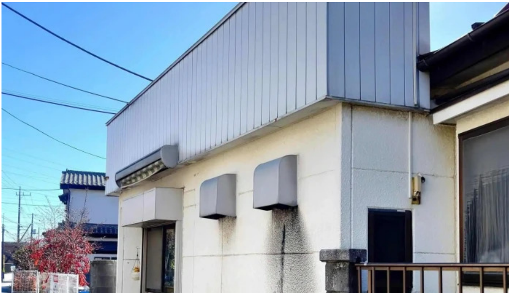
御食事処 大屋 コメント