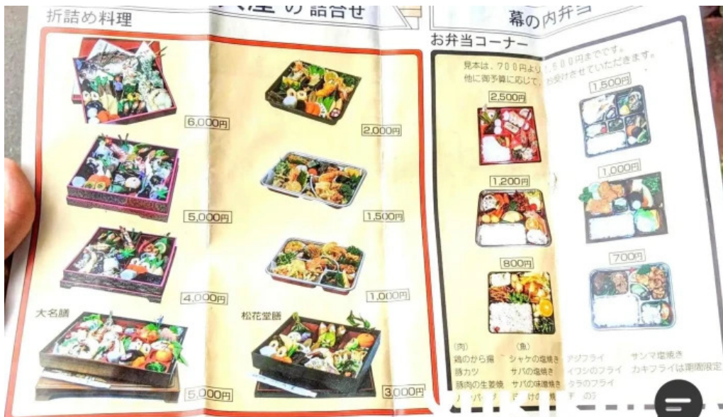
御食事処 大屋 メニュー