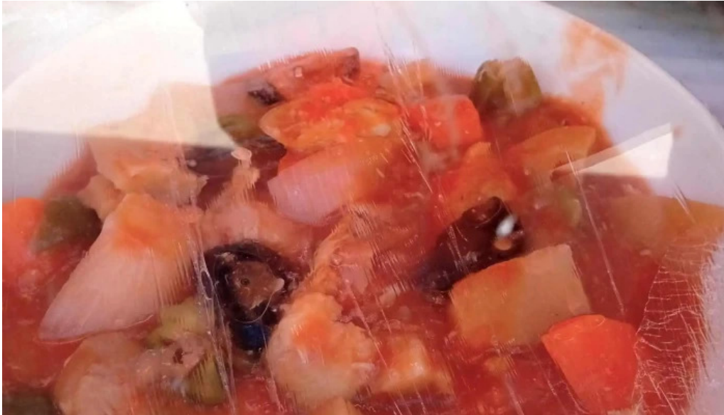
御食事処 大屋 ウェブサイト