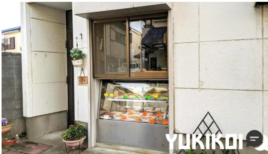
御食事処 大屋 霧田気