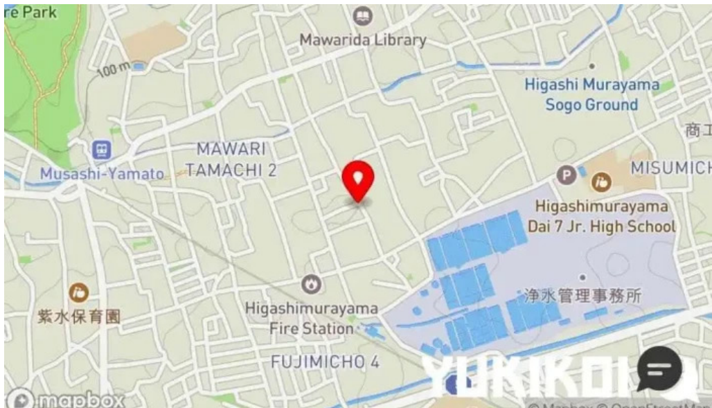
御食事処 大屋 地図