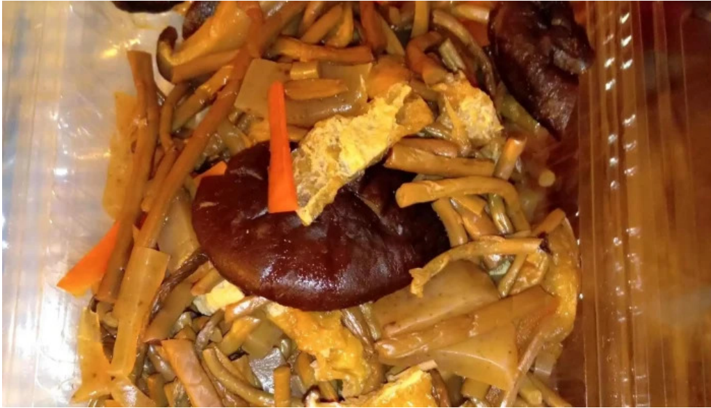
御食事処 大屋 料金