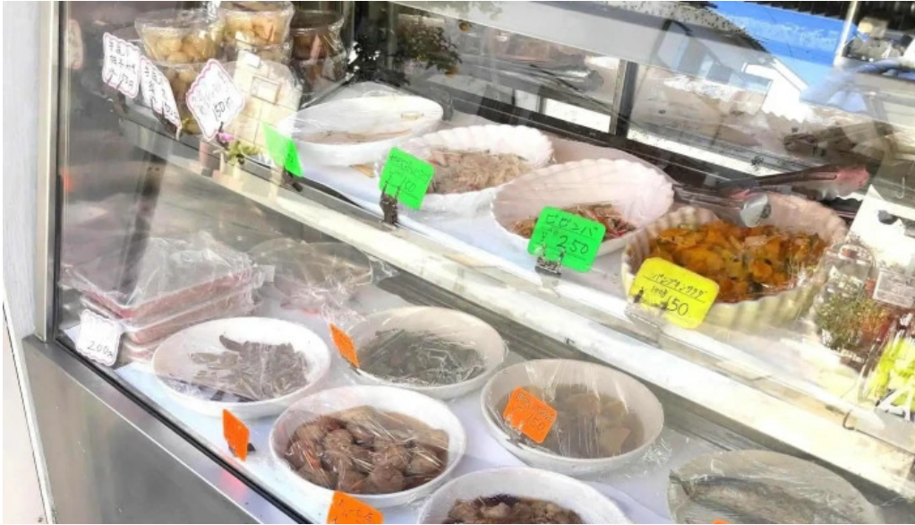
御食事処 大屋 カタログ