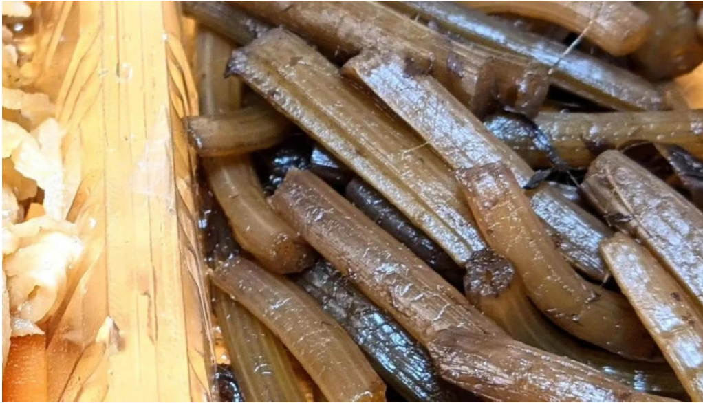
御食事処 大屋 プロモーション