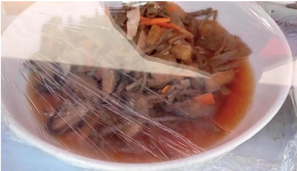
御食事処 大屋 エリア