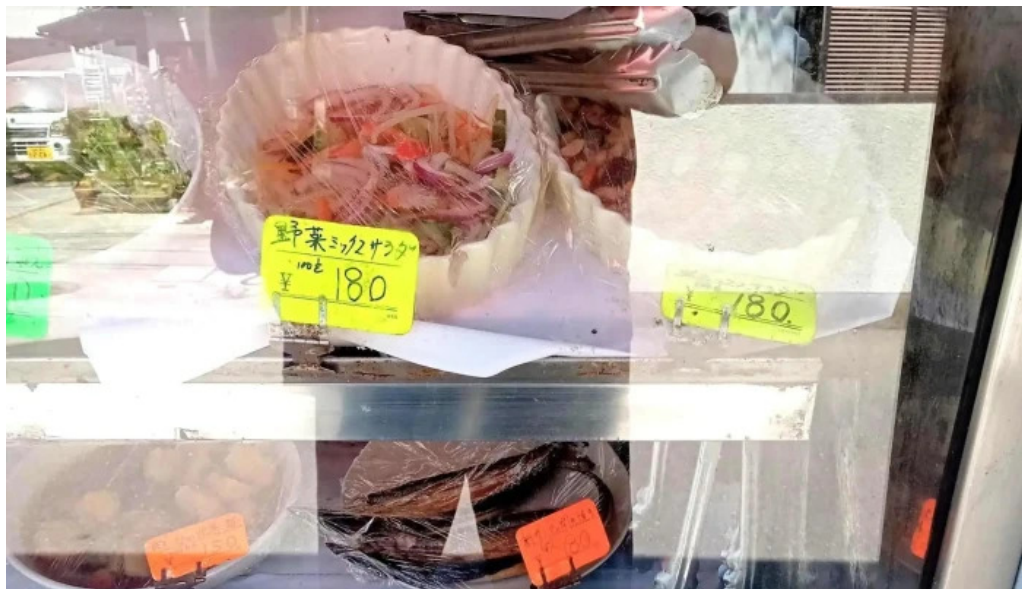
御食事処 大屋 営業時間