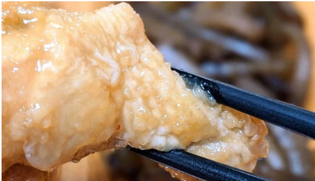
御食事処 大屋 動画