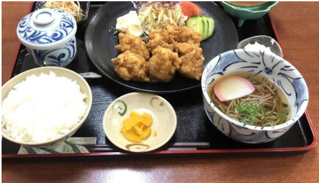
さらぎ食堂 料理飲み物