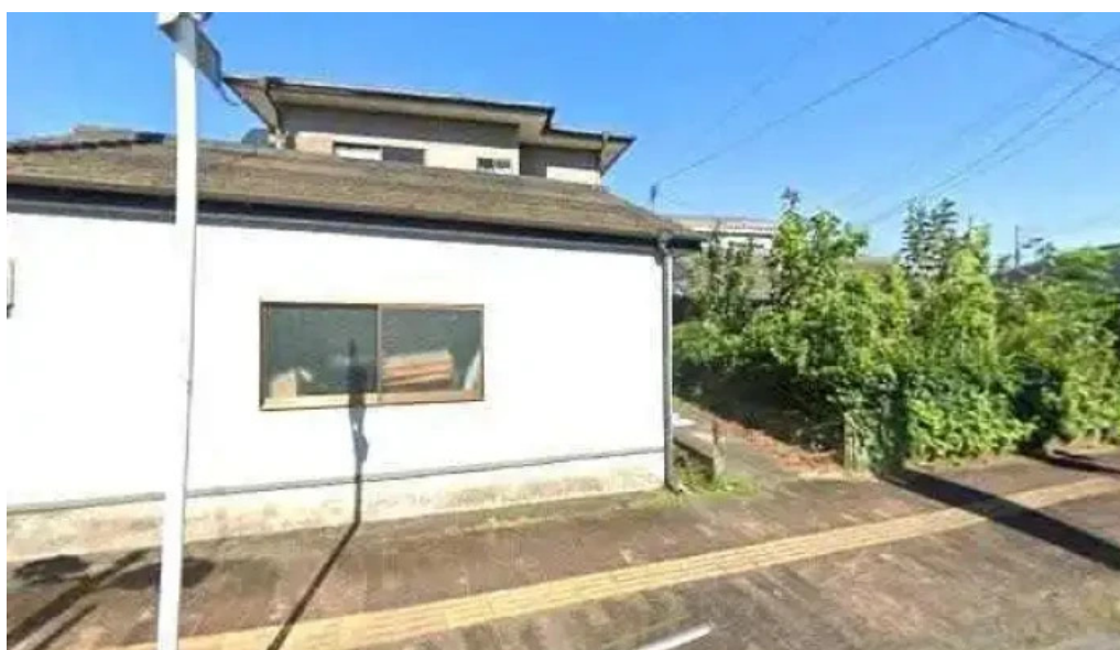
さらぎ食堂 曾於市