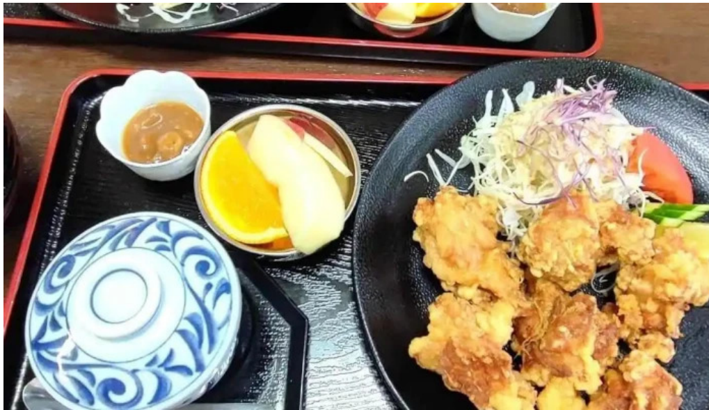
さらぎ食堂 から揚げ