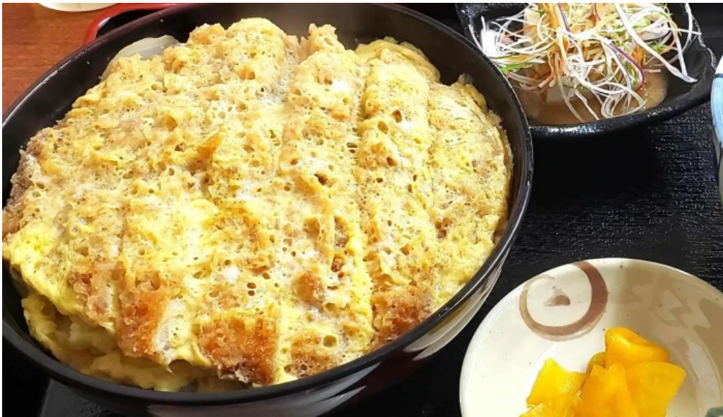
さらぎ食堂 口コミ