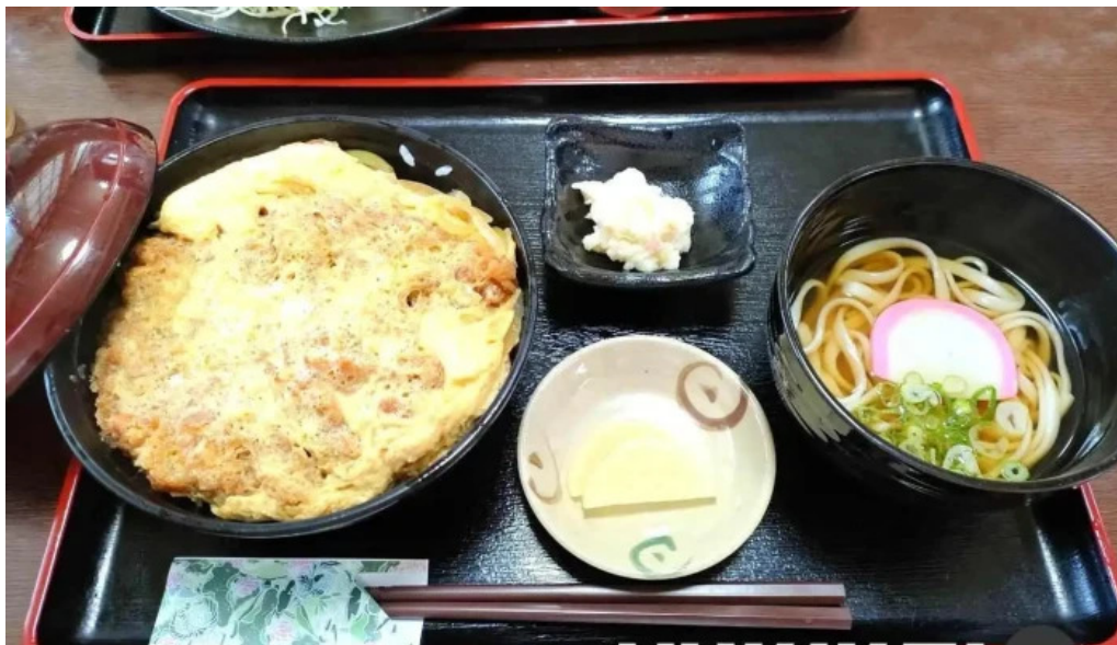
さらぎ食堂 スープ