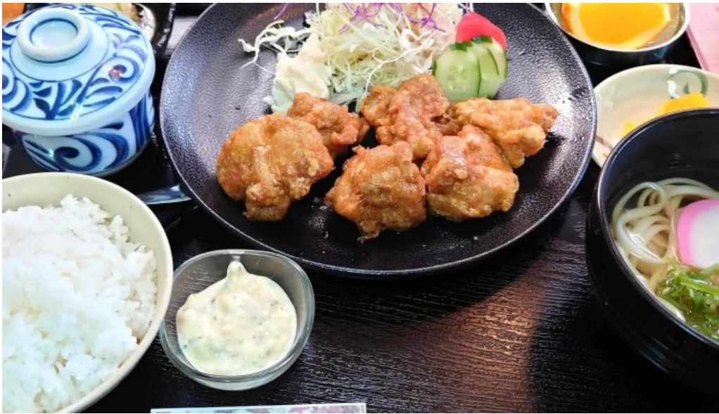
さらぎ食堂 営業中