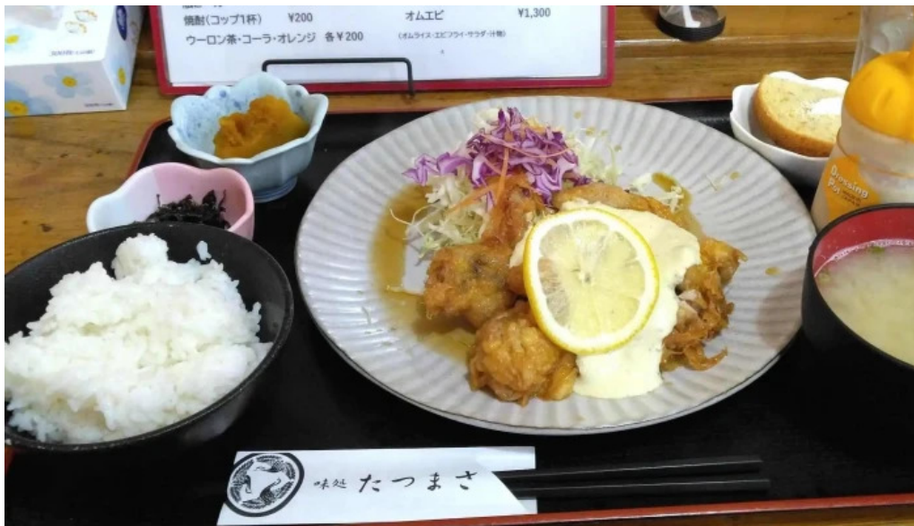
味処 たつまさ 割引