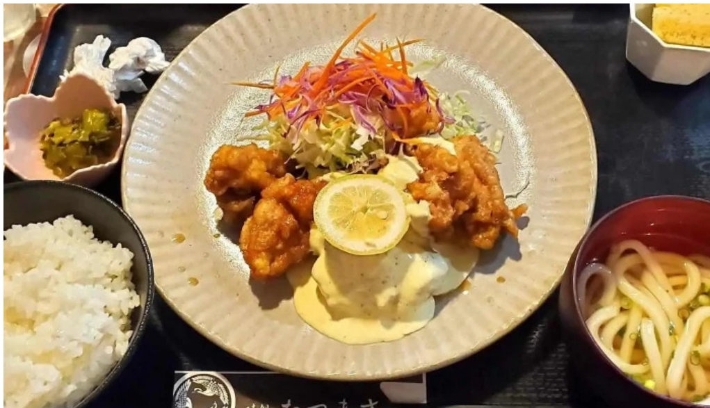
味処 たつまさ 麺