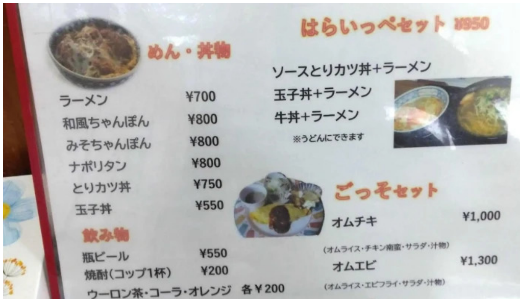
味処 たつまさ instagram