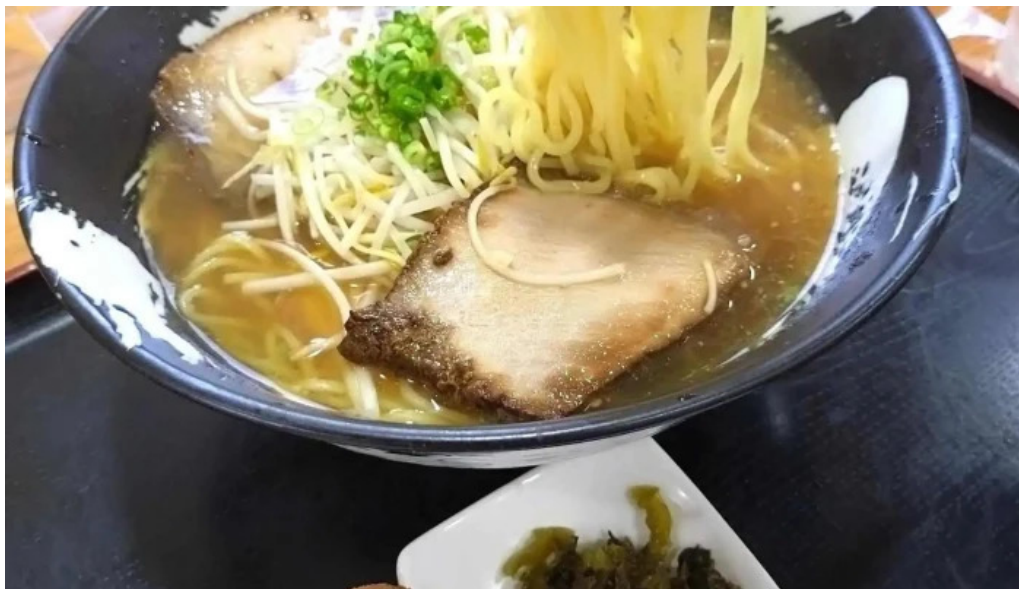
味処 たつまさ ラーメン