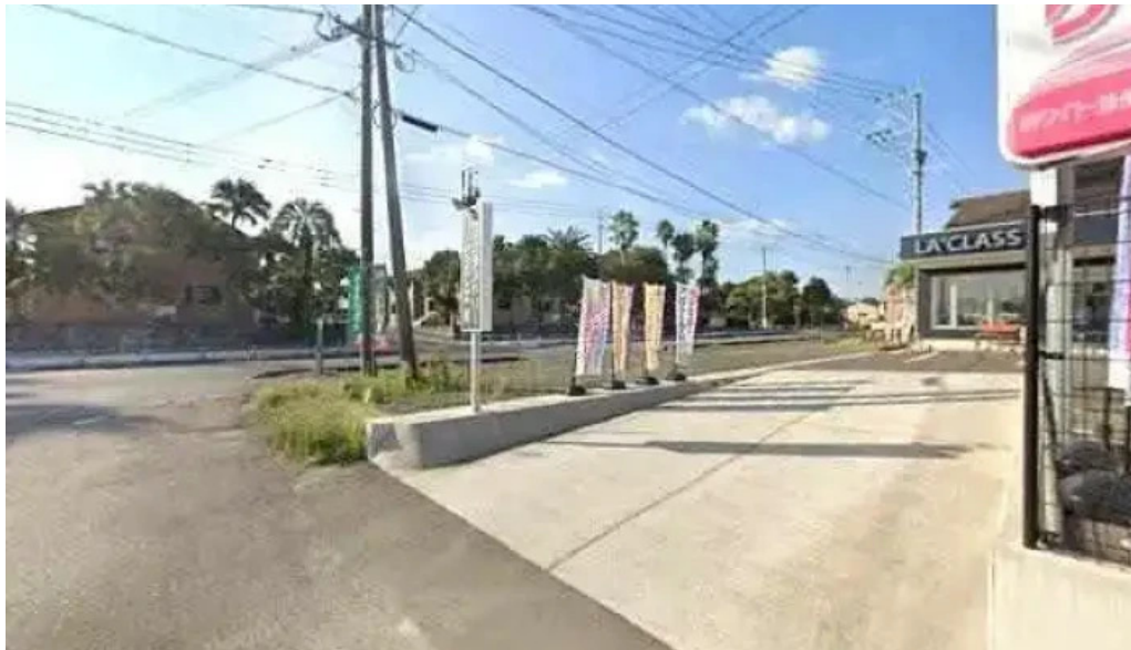
味処 たつまさ 志布志市