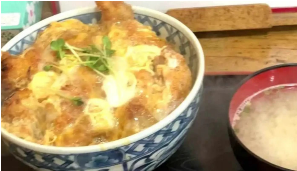
味処 たつまさ 動画