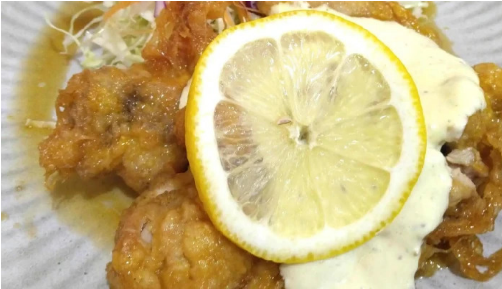
味処 たつまさ 行き方