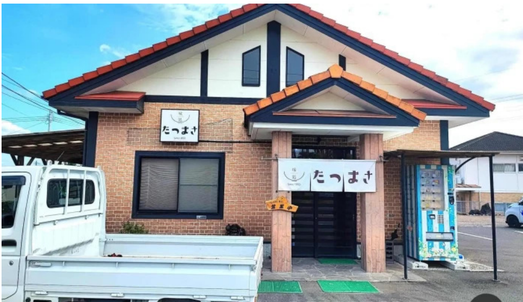
味処 たつまさ 最新