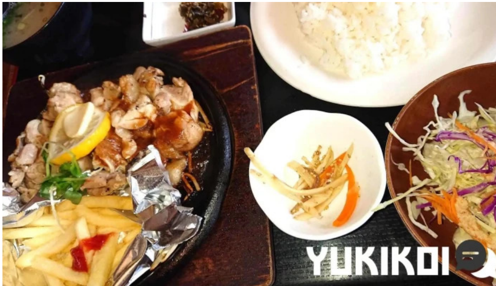
味処 たつまさ から揚げ