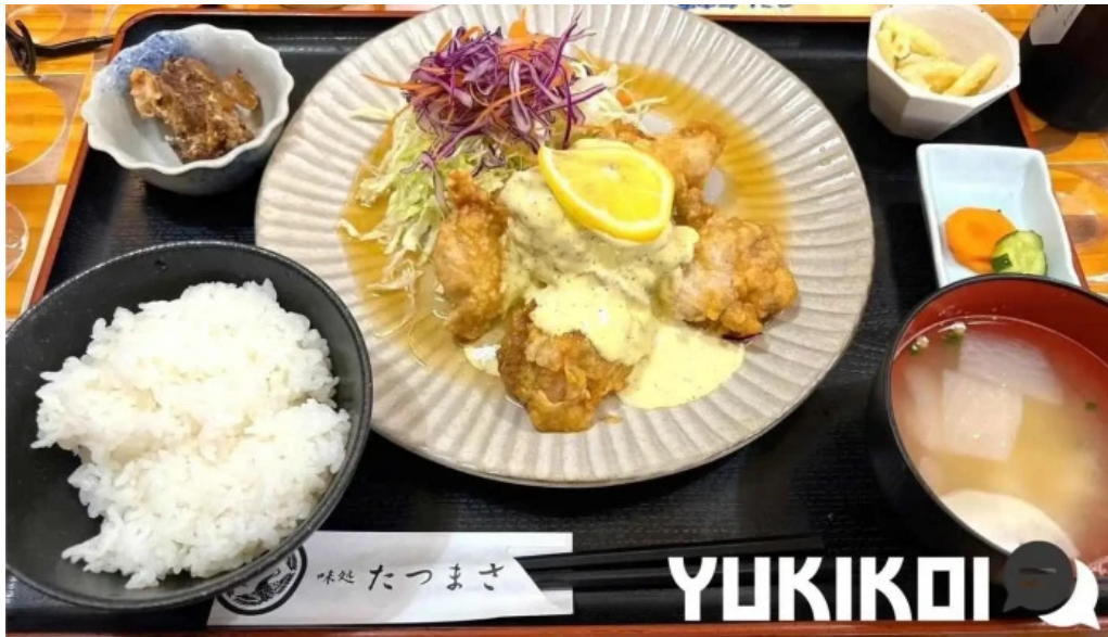
味処 たつまさ 料理飲み物