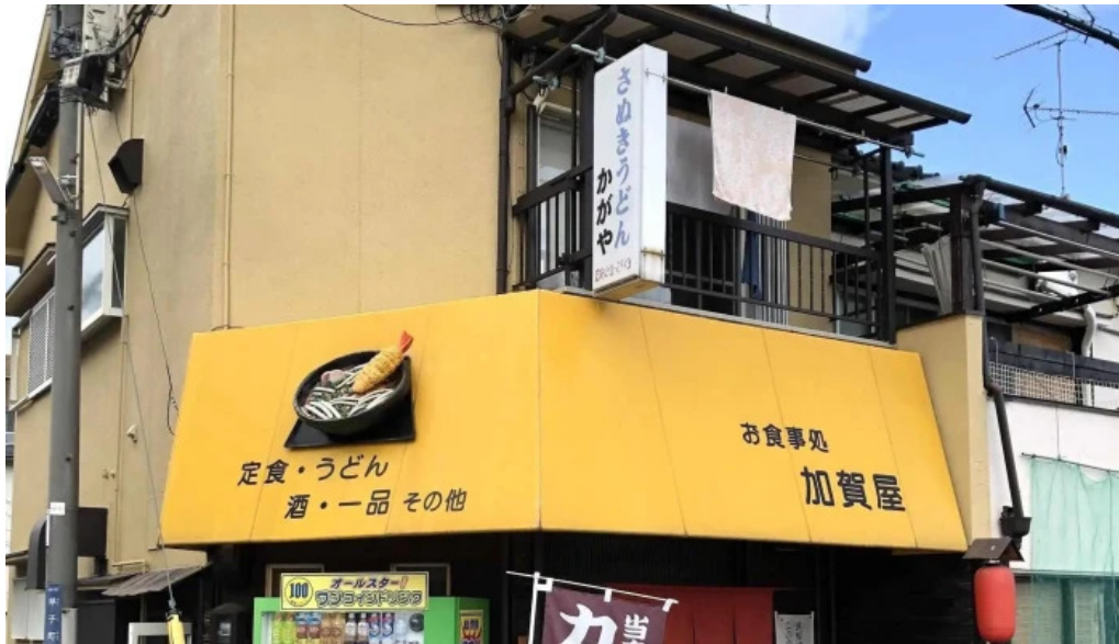
お食事処 加賀屋 エリア