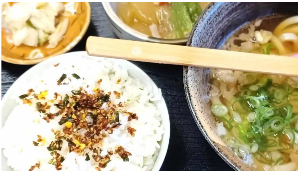
お食事処 加賀屋 電話