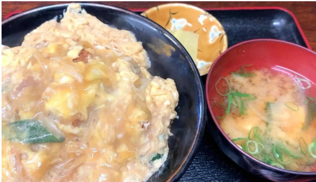
お食事処 加賀屋 口コミ