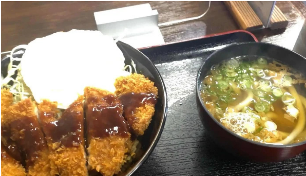
お食事処 加賀屋 スコア