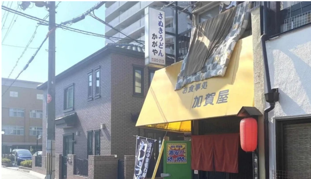
お食事処 加賀屋 行き方