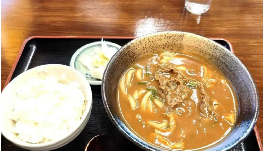
お食事処 加賀屋 スープ