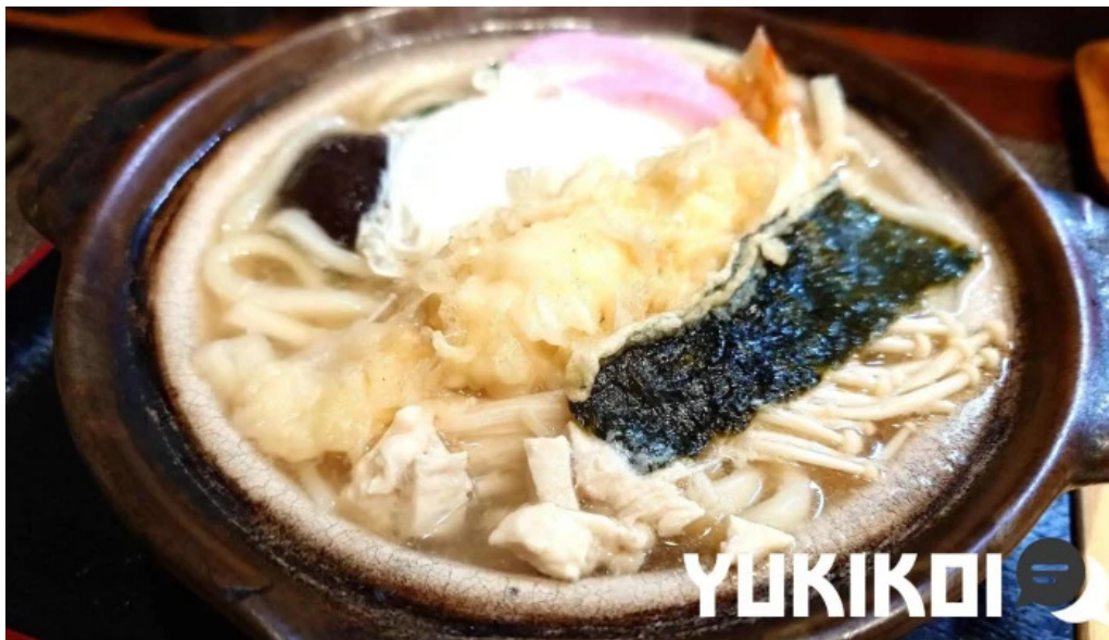
お食事処 加賀屋 料理飲み物