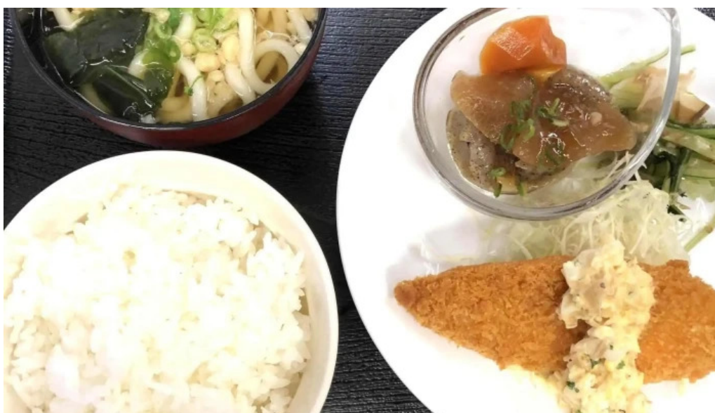
お食事処 加賀屋 近く