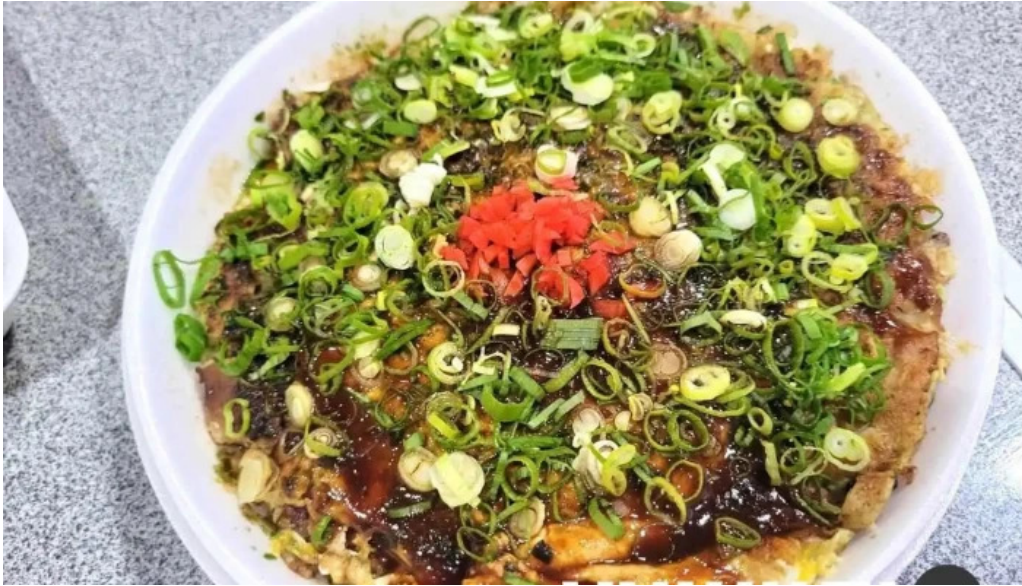
かどや 料理飲み物