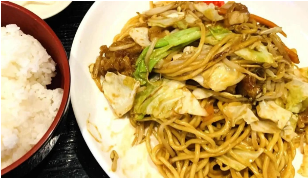
千門食堂 営業時間