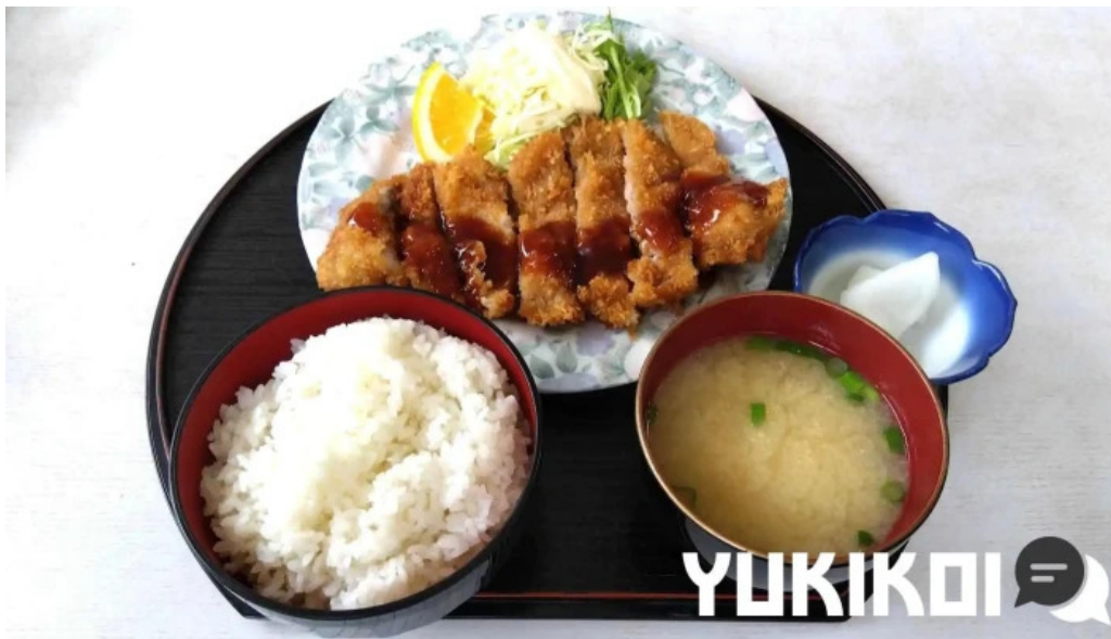
千門食堂 料理飲み物