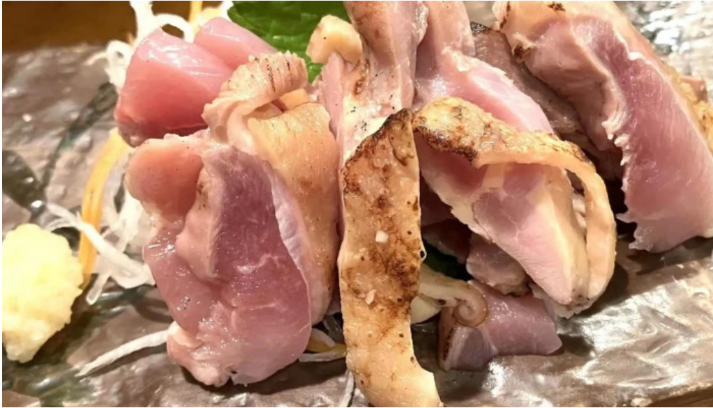
むさし屋 カタログ