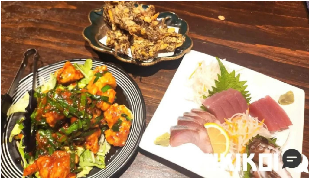
むさし屋 料理飲み物