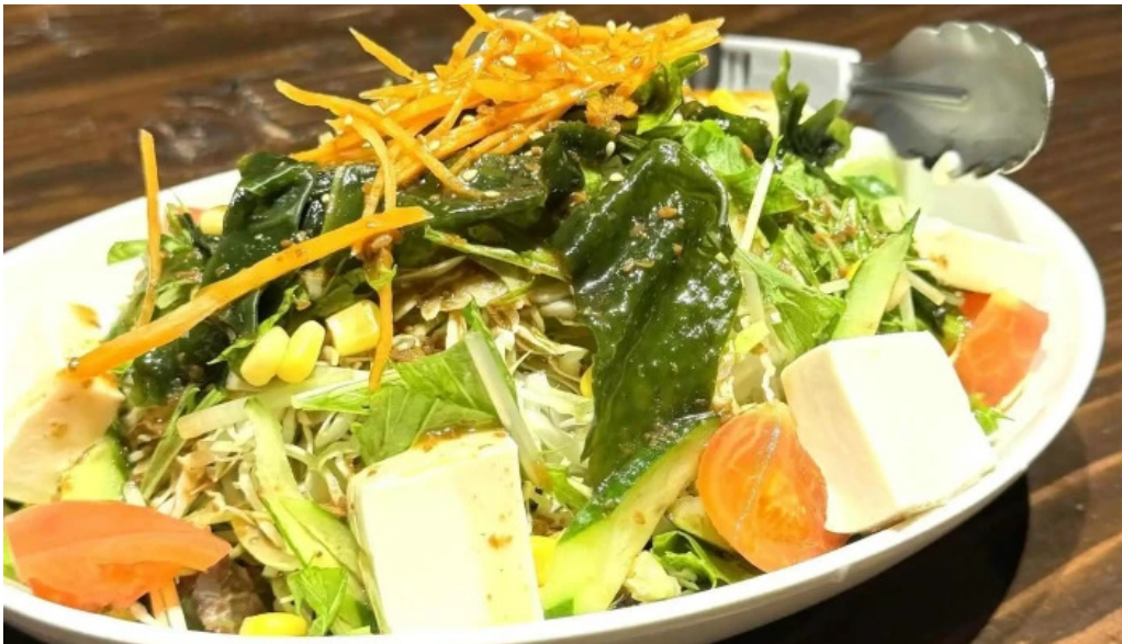
むさし屋 ウェブサイト