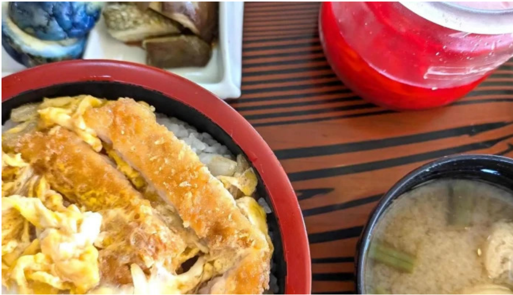
食事処 八千代 近く