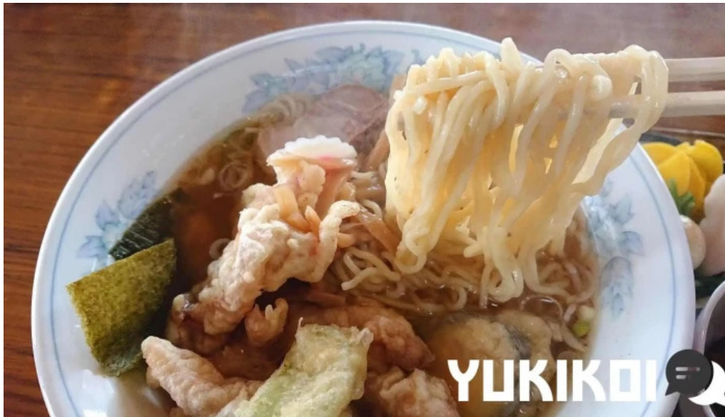
食事処 八千代 ラーメン