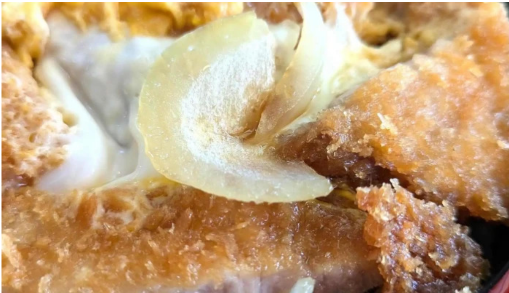
食事処 八千代 写真