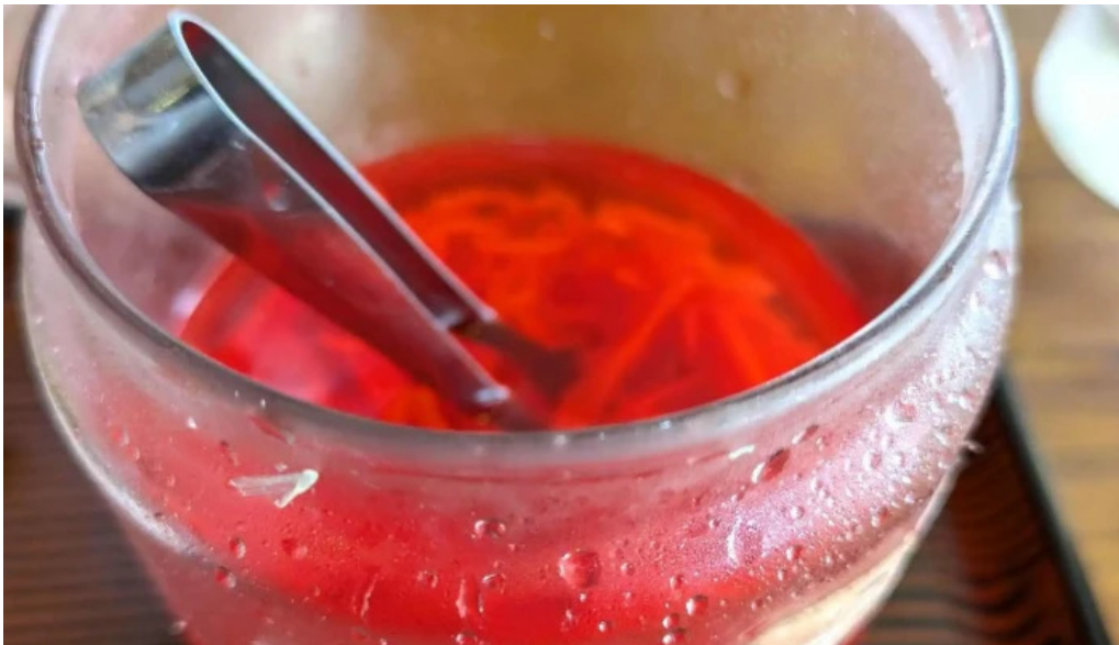
食事処 八千代 口コミ