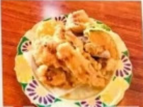
食事処 八千代 メニュー