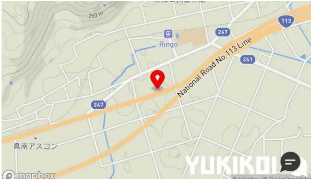
食事処 八千代 地図