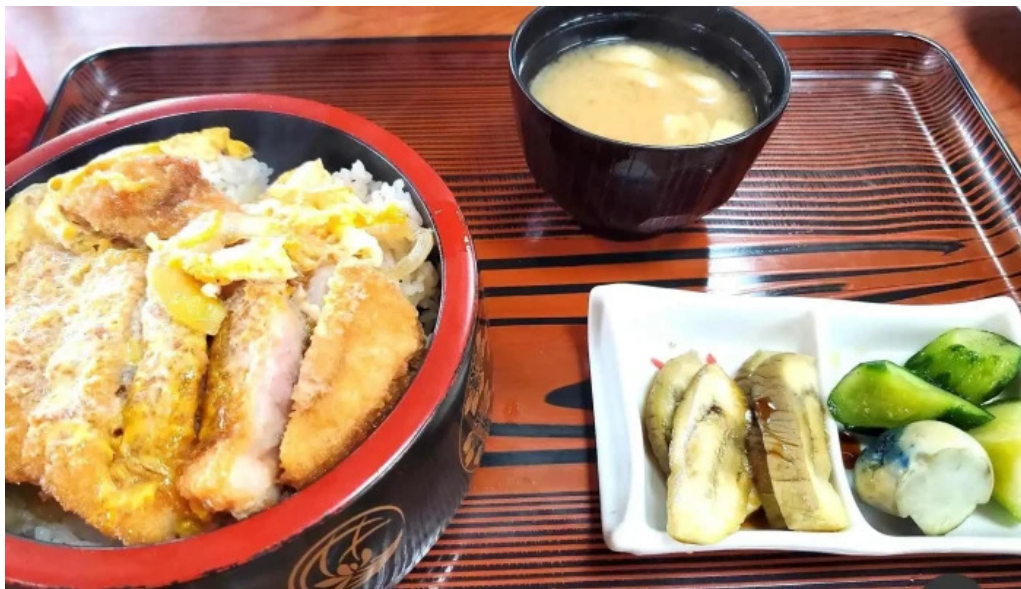
食事処 八千代 カツ丼