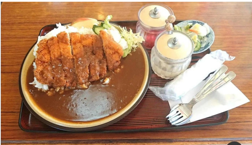
食事処 八千代 豚カツ