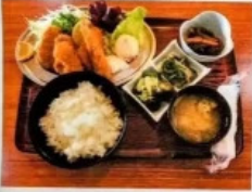
食事処 八千代 メニュー