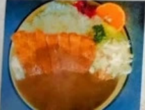
食事処 八千代 メニュー