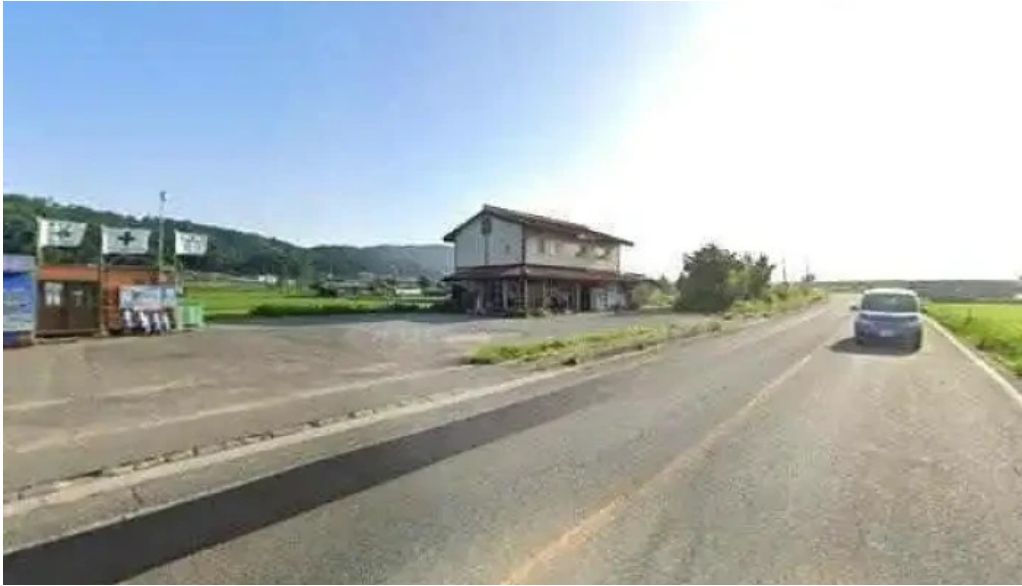
食事処 八千代 南陽市