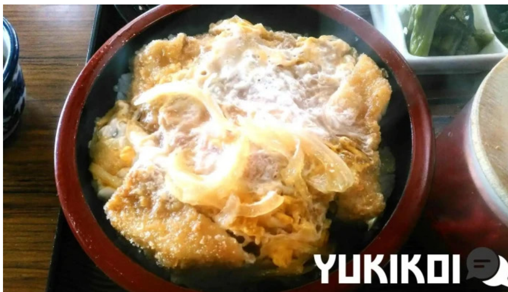
食事処 八千代 麺