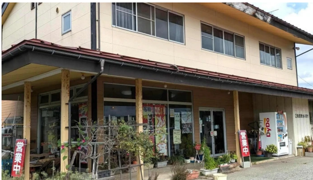
食事処 八千代 エリア