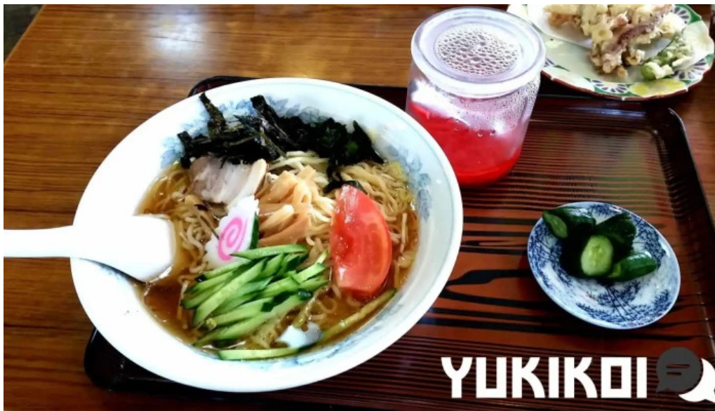
食事処 八千代 料理飲み物