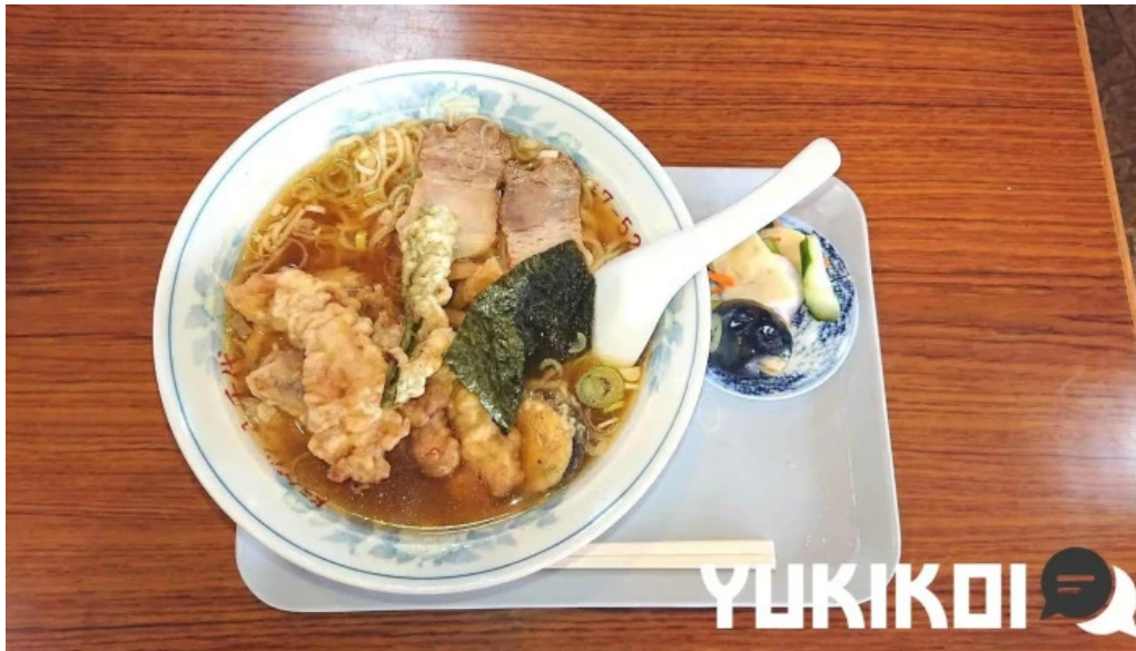
食事処 八千代 カレー