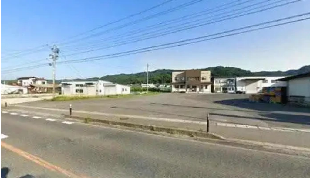
ドライブインひろ 南陽市