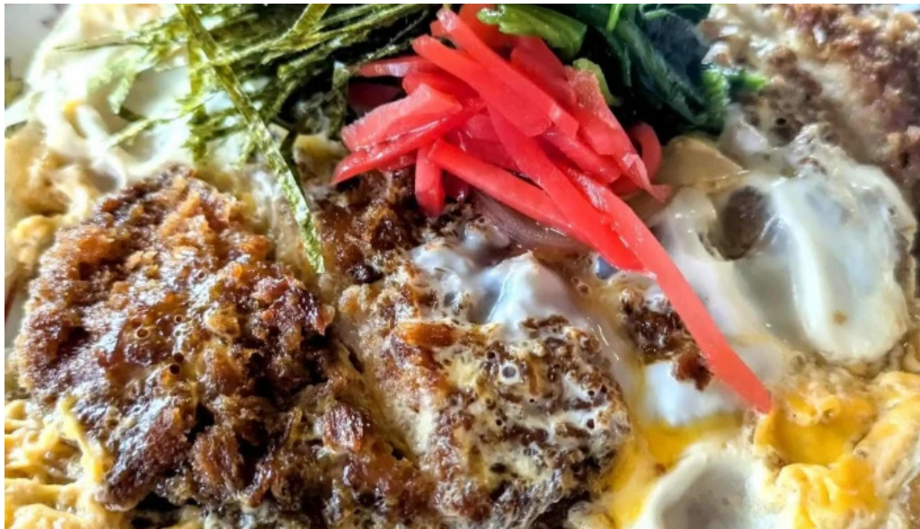
ドライブインひろ ウェブサイト