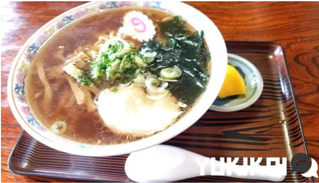
ドライブインひろ ラーメン