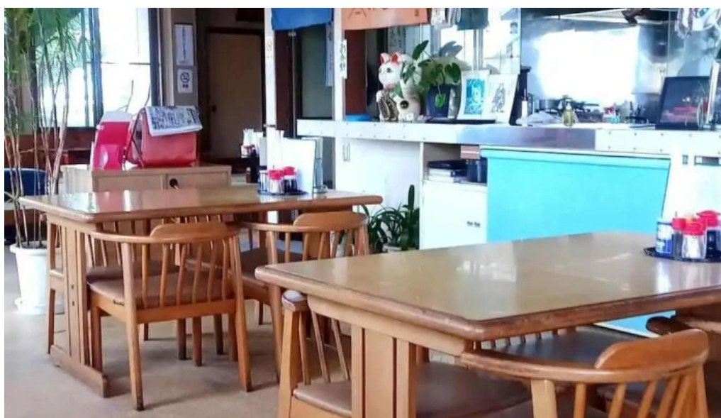
ドライブインひろ 雰囲気