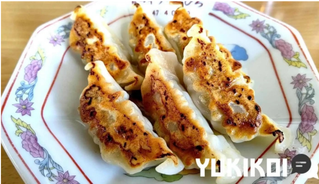
ドライブインひろ 料理飲み物