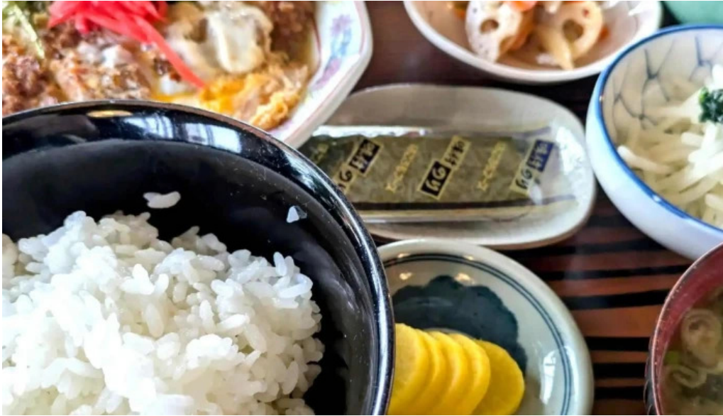
ドライブインひろ instagram