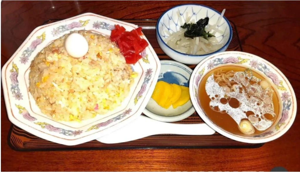
ドライブインひろ スープ