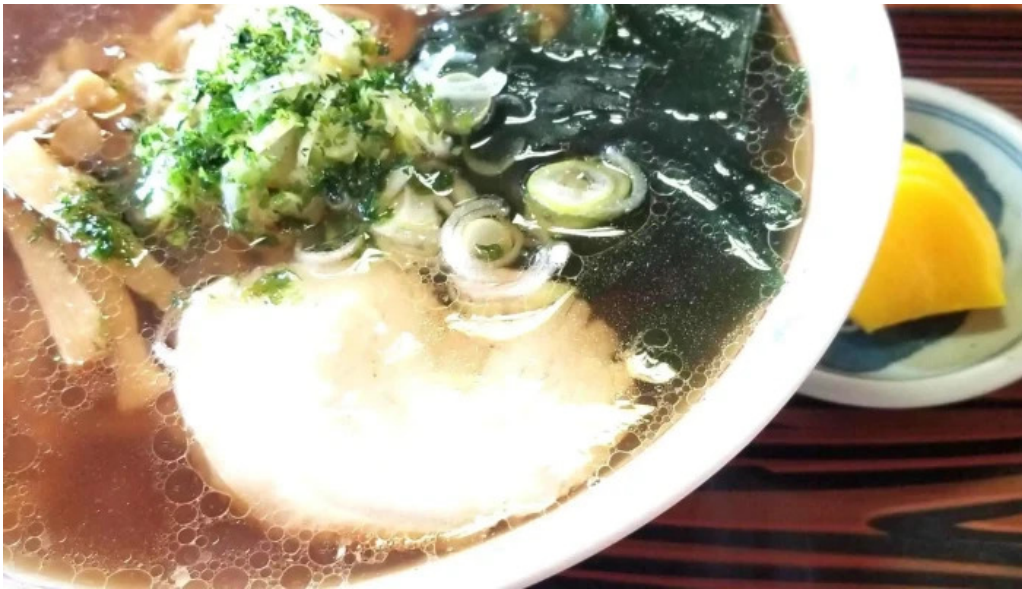
ドライブインひろ 写真