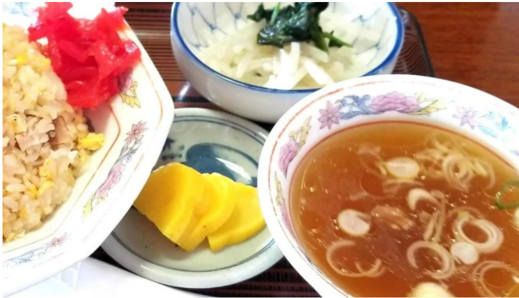
ドライブインひろ カタログ