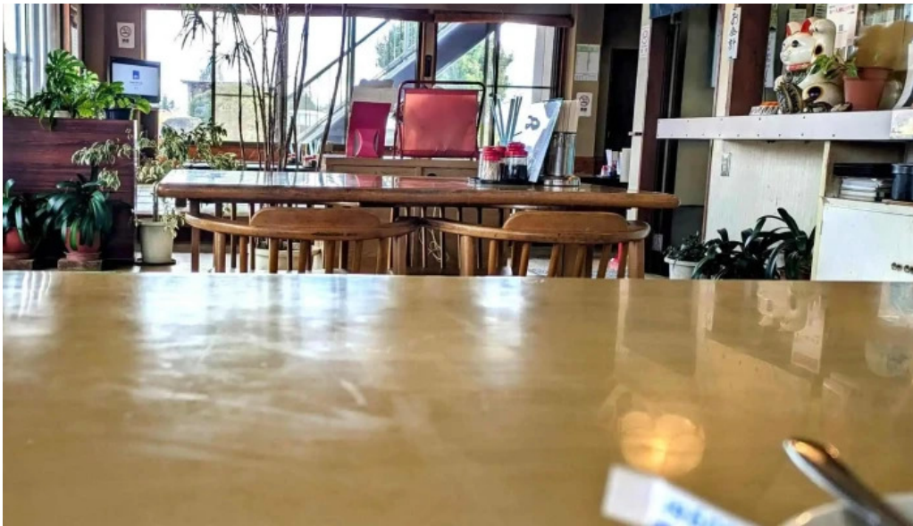
ドライブインひろ コメント