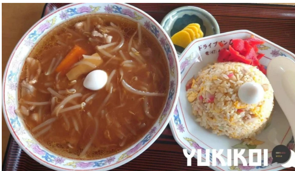
ドライブインひろ 麺