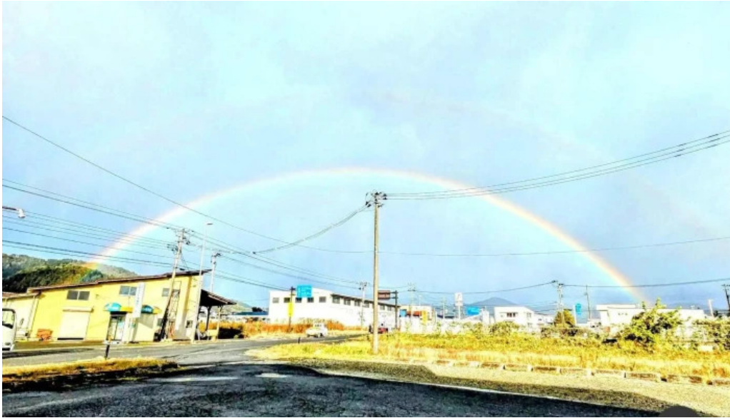
ドライブインひろ 最新