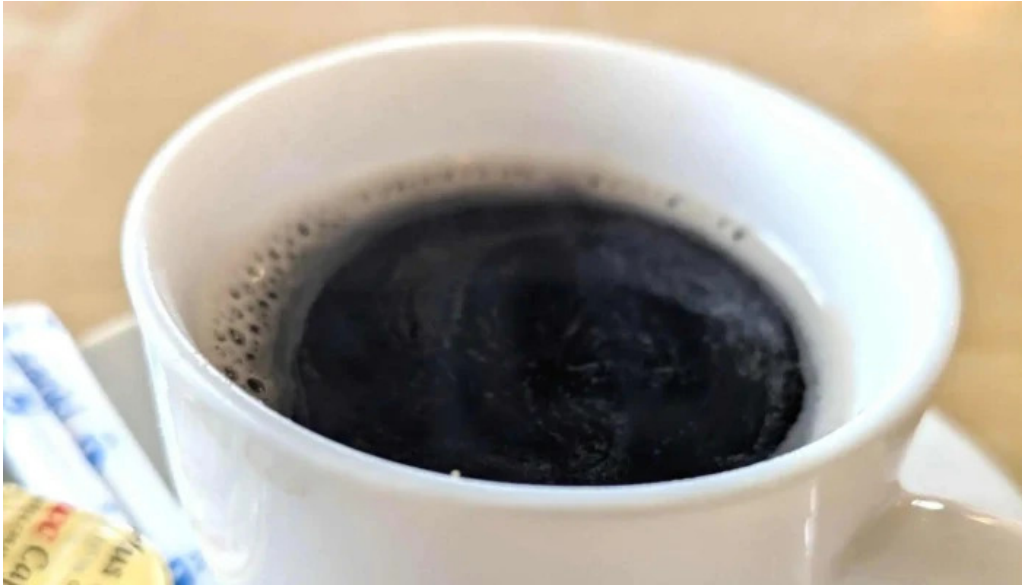
ドライブインひろ 所在地