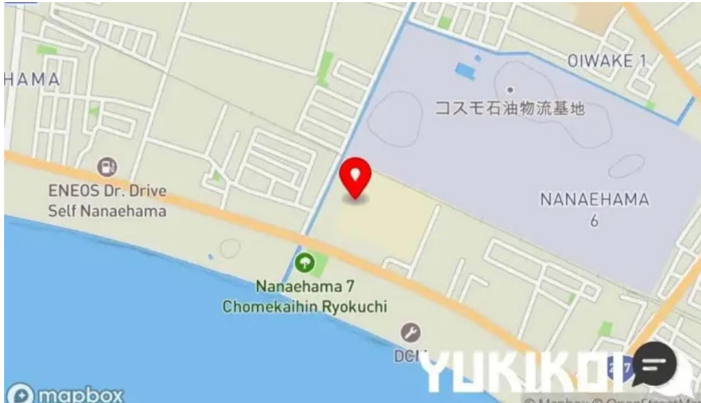
めん六や 上磯店 地図