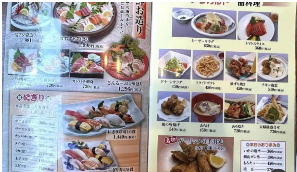
和食乃さんるーぷ メニュー