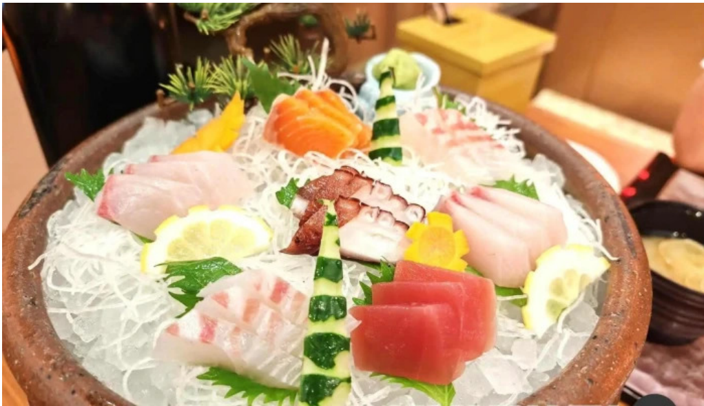
和食乃さんる一ぷ 刺身