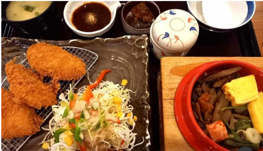
和食乃さんるーぷ 豚カツ