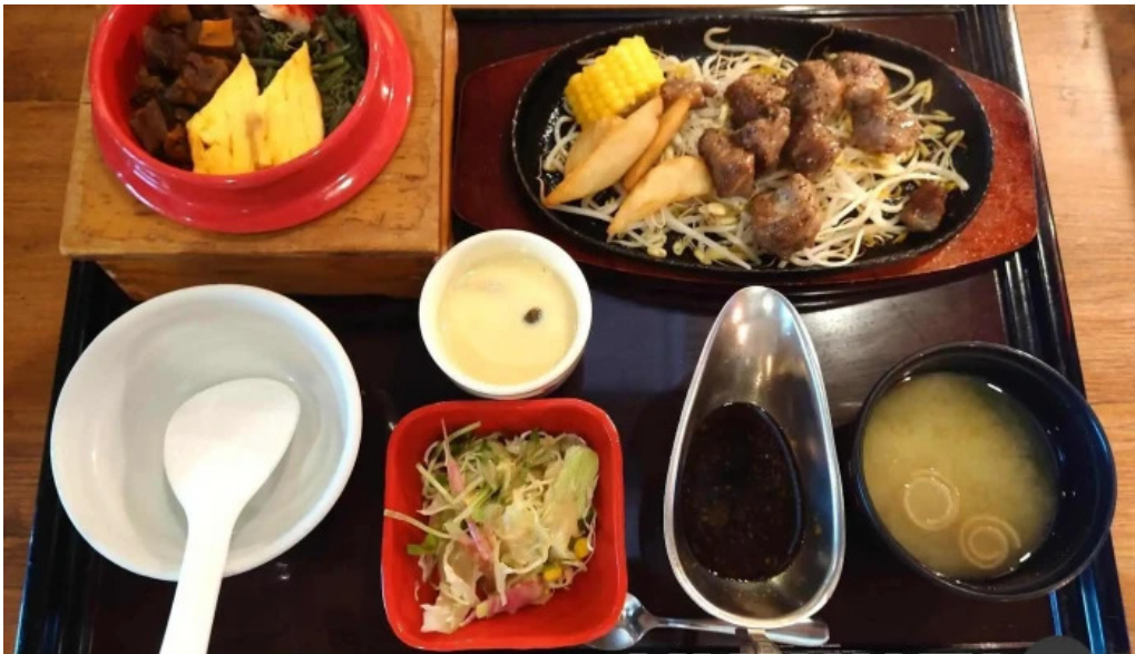
和食乃さんる一ぷ 料理飲み物