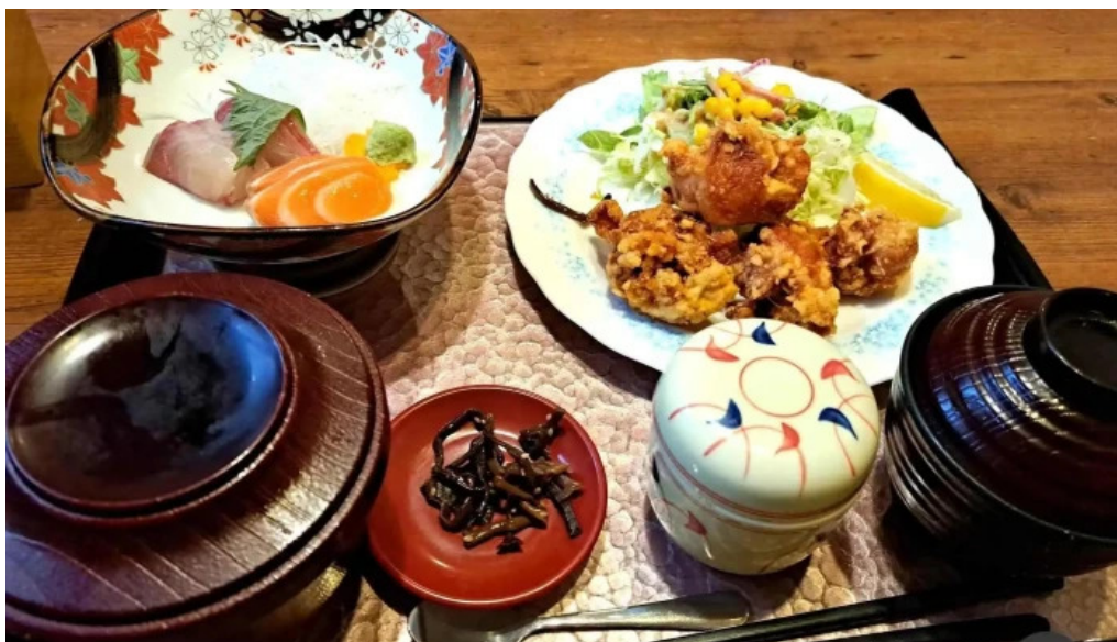
和食乃さんるーぷ から揚げ