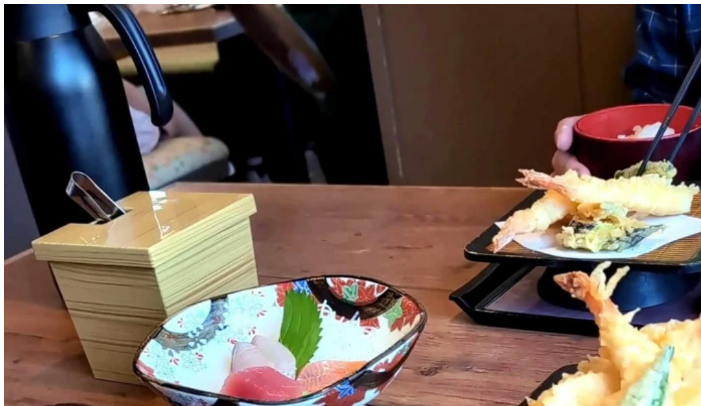
和食乃さんるーぷ コメント