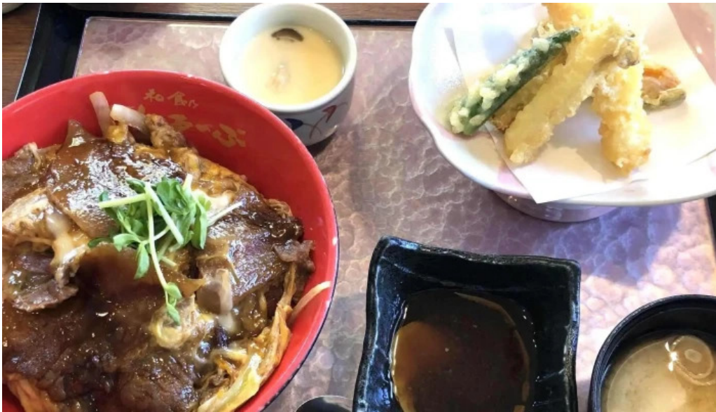
和食乃さんるーぷ 人吉市