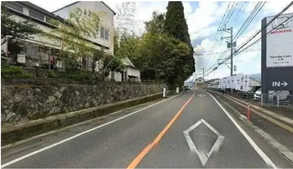
和食乃さんるーぷ 最新