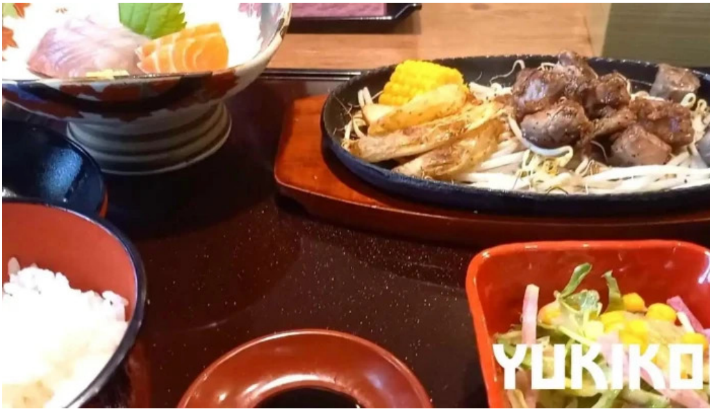
和食乃さんる一ぷ 動画