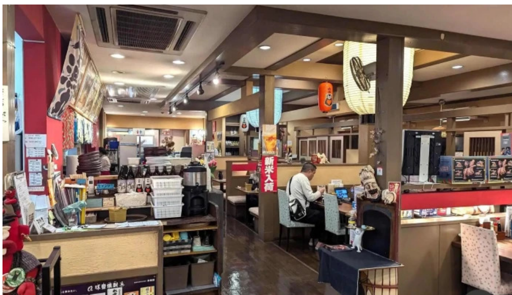
和食乃さんるーぷ 雰囲気