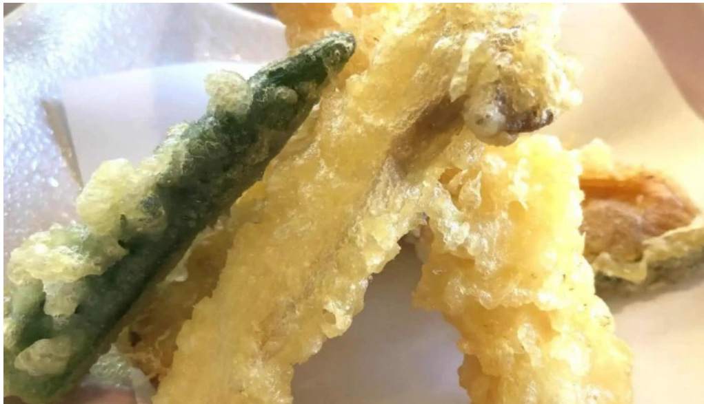
和食乃さんるーぷ 行き方