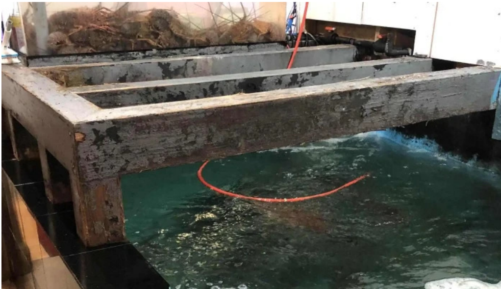
和食乃さんるーぷ 料金