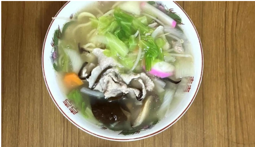
友部食堂 コメント