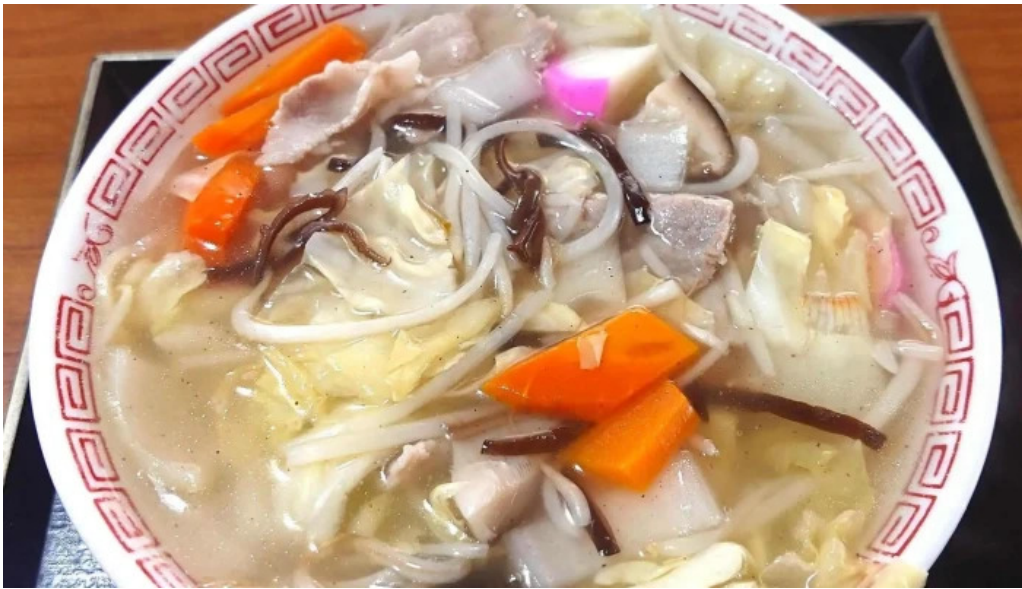
友部食堂 料理飲み物