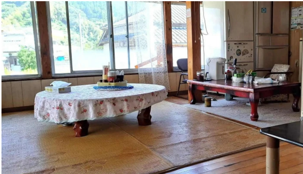
友部食堂 カタログ