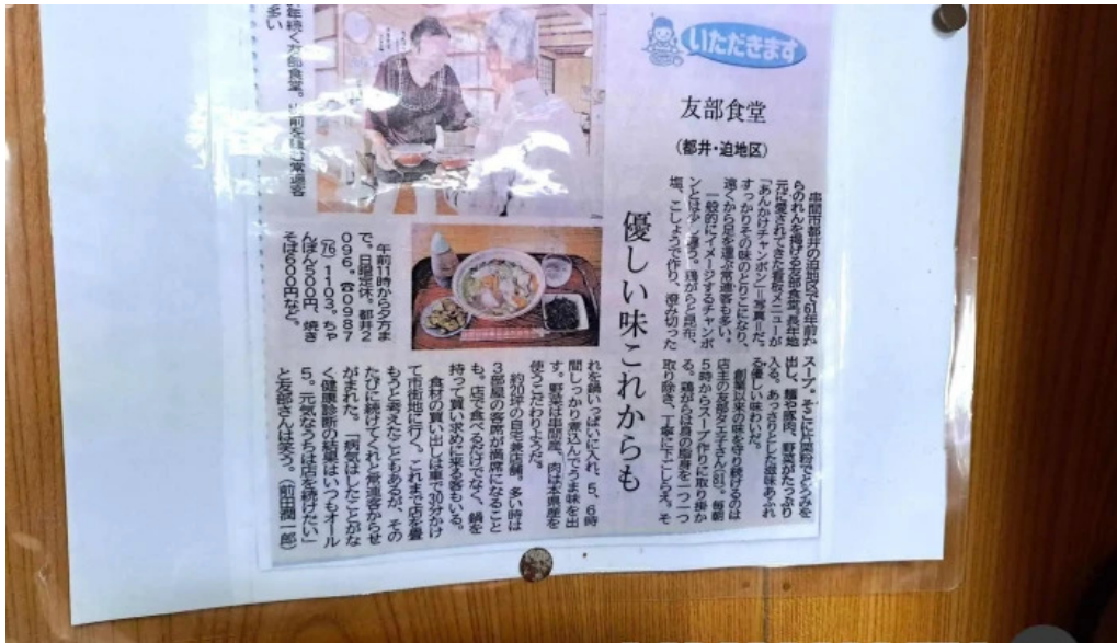
友部食堂 メニュー