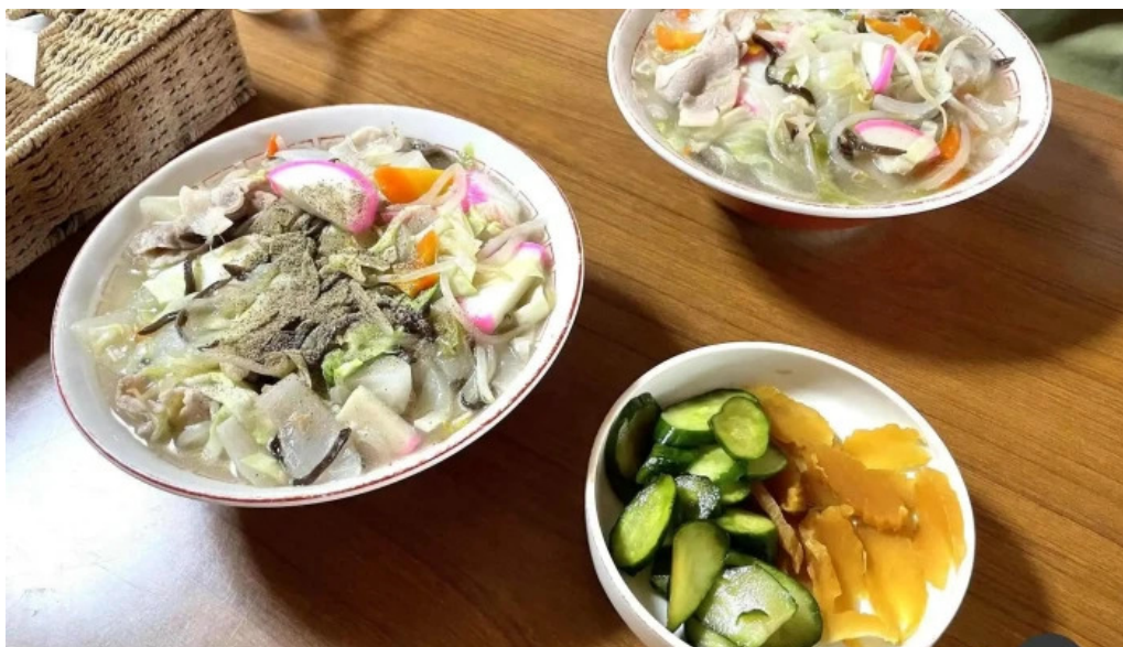
友部食堂 ちゃんぽん