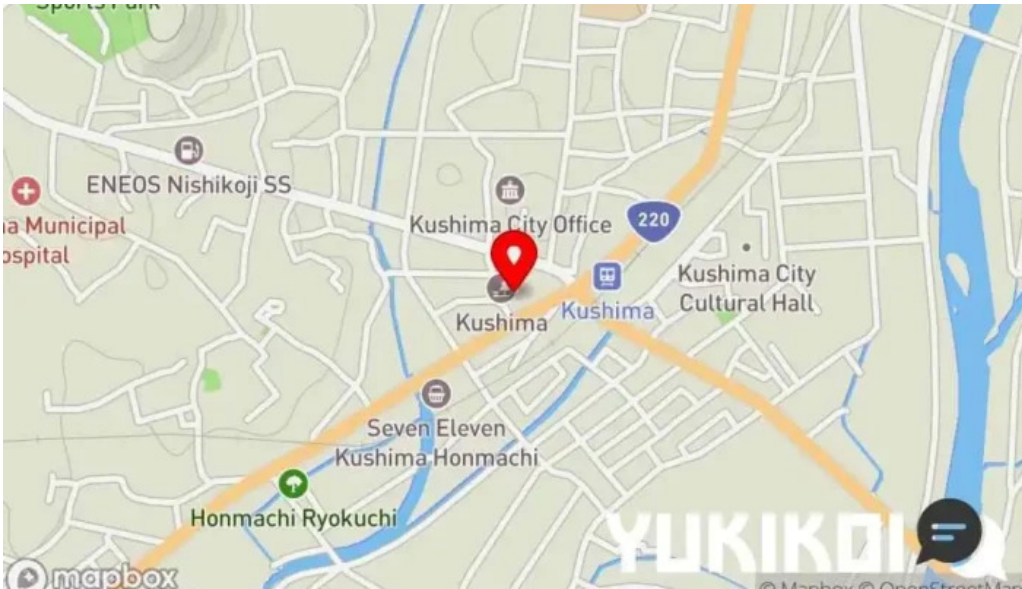
ウミヤマショクドウ 地図