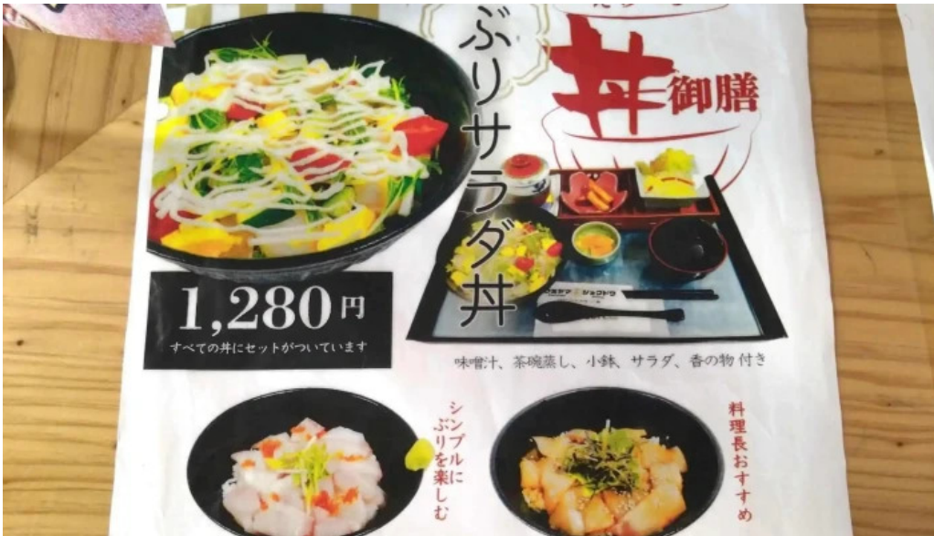
ウミヤマシヨクドウ ウェブサイト