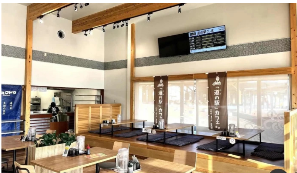
ウミヤマシヨクドウ 霧田気