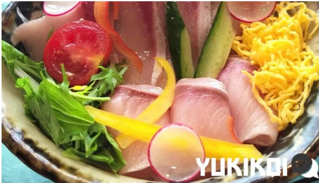
ウミヤマシヨクドウ 刺身