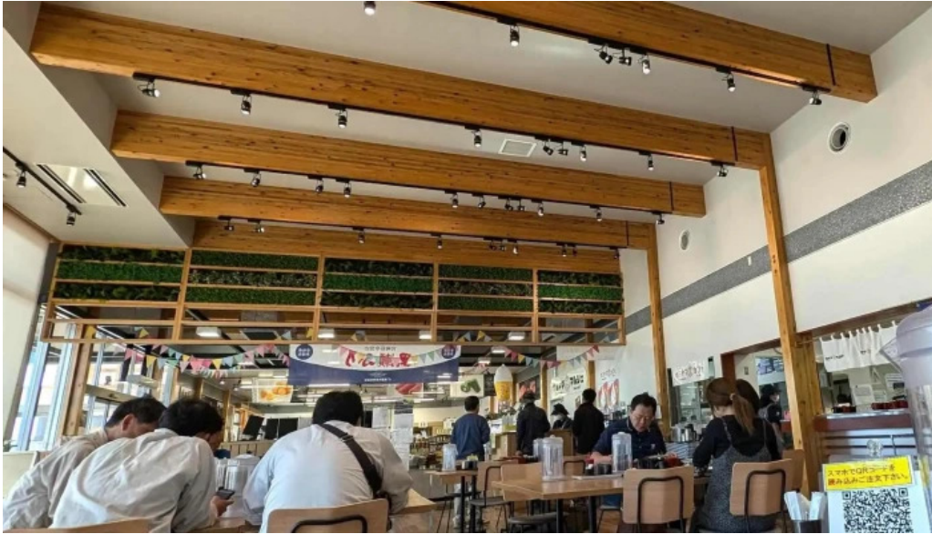
ウミヤマシヨクドウ エリア