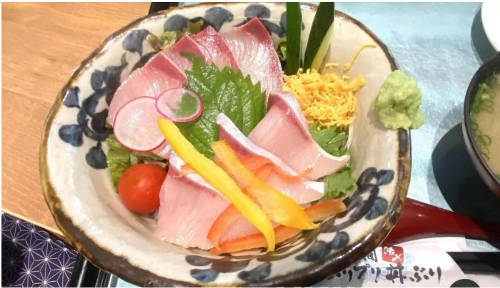
ウミヤマショクドウ 料理飲み物