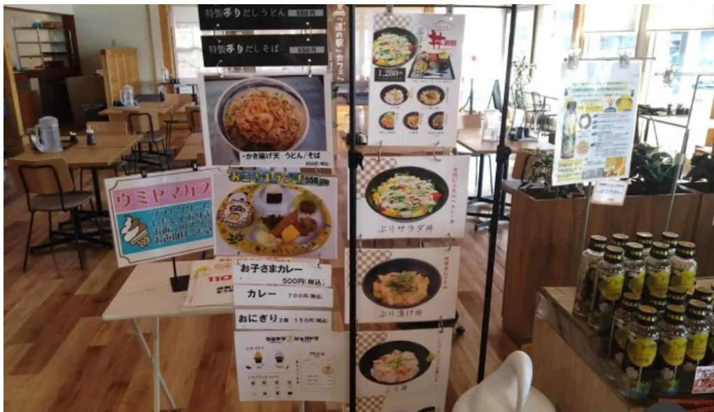
ウミヤマシヨクドウ 最新