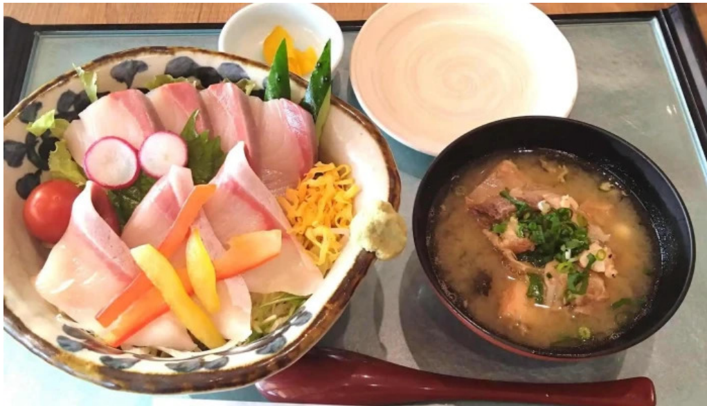
ウミヤマシヨクドウ instagram