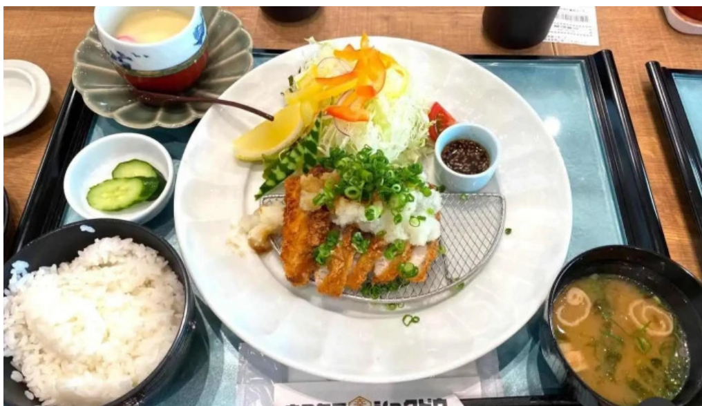
ウミヤマシヨクドウ 豚カツ