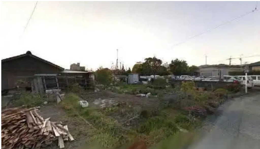
ウミヤマシヨクドウ 串間市