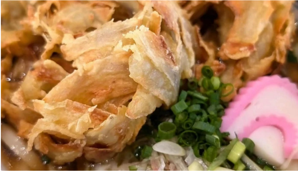
ウミヤマシヨクドウ 営業中