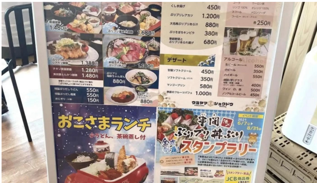
ウミヤマシヨクドウメニュー