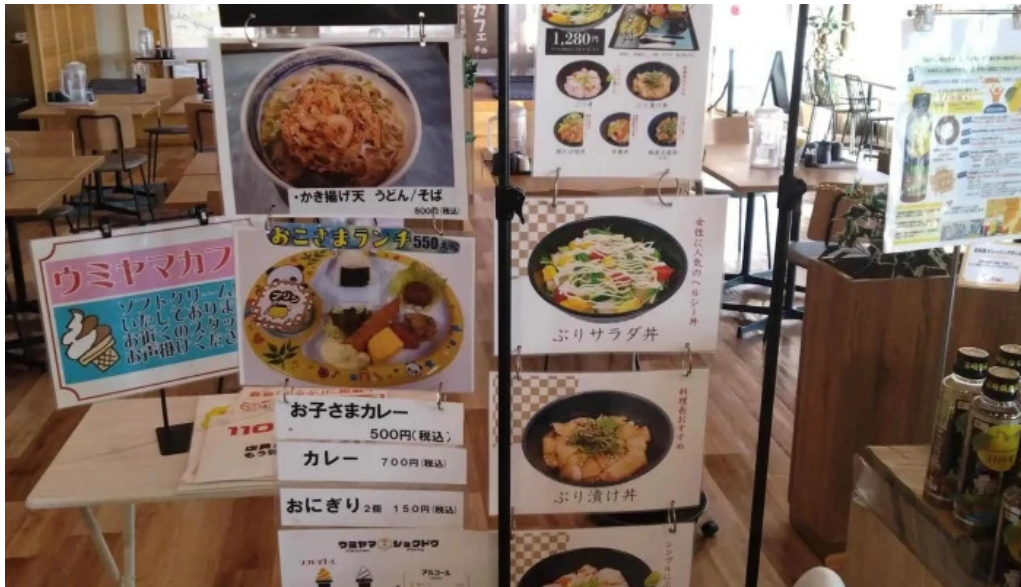
ウミヤマシヨクドウ 行き方