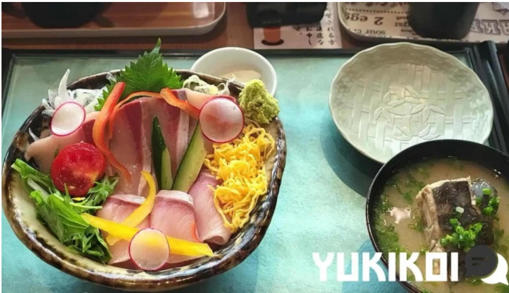
ウミヤマシヨクドウ 動画