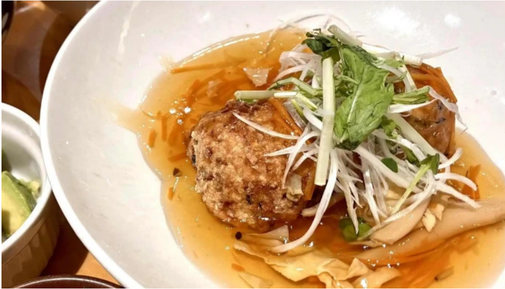
おぼんdeごはん アトレ浦和店 近く