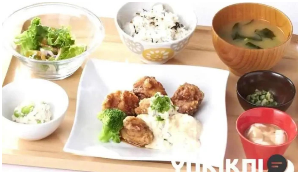
おぼんdeごはん アトレ浦和店 オーナー提供