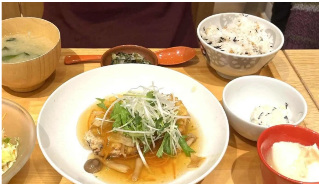
おぼんdeごはん アトレ浦和店 プロモーション