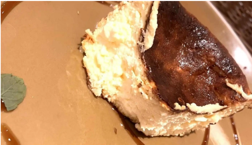
おぼんdeごはん アトレ浦和店 行き方