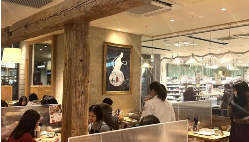
おぼんdeごはん アトレ浦和店 動画