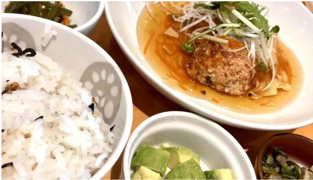
おぼんdeごはん アトレ浦和店 番号