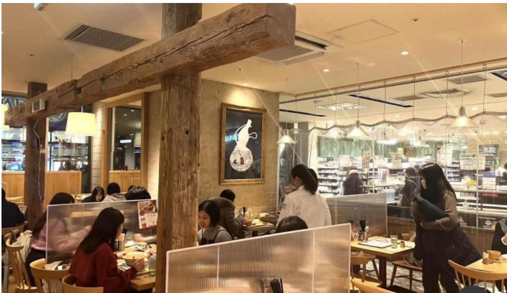
おぼんdeごはん アトレ浦和店 雰囲気