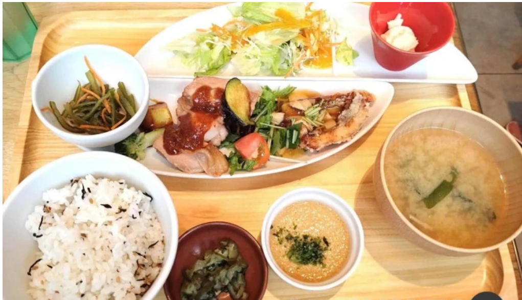
おぼんdeごはん アトレ浦和店 スープ