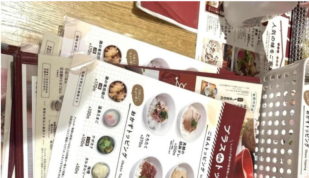
おぼんdeごはん アトレ浦和店 住所