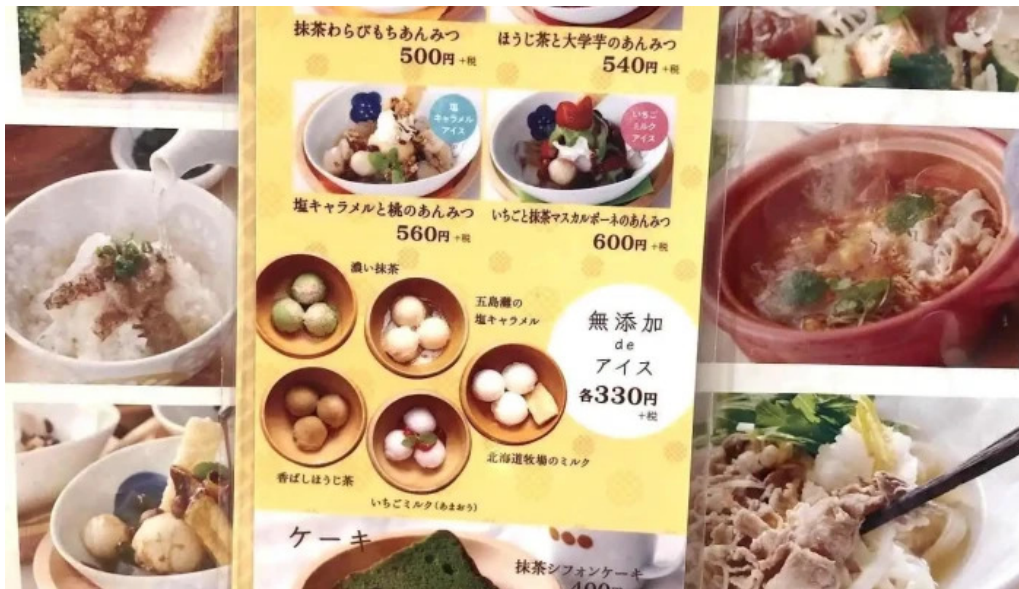
おぼんdeごはん アトレ浦和店 メニュー