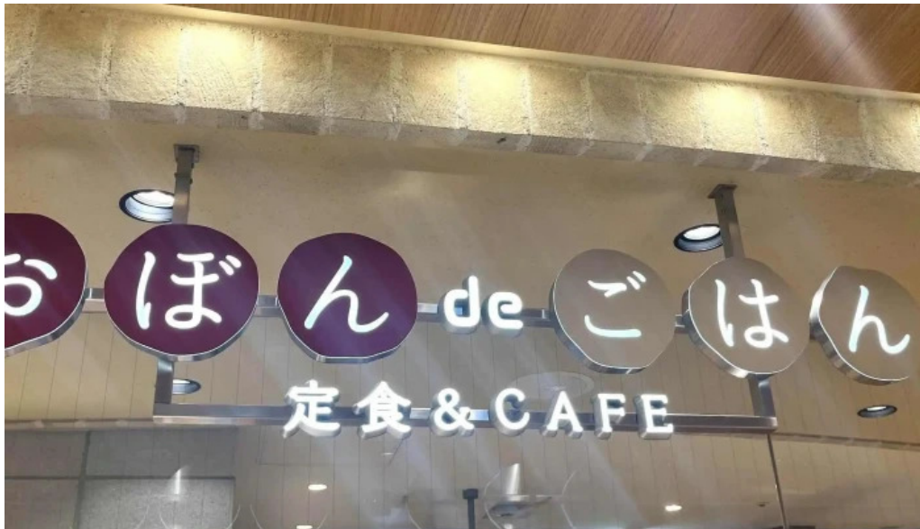
おぼんdeごはん アトレ浦和店 コメント