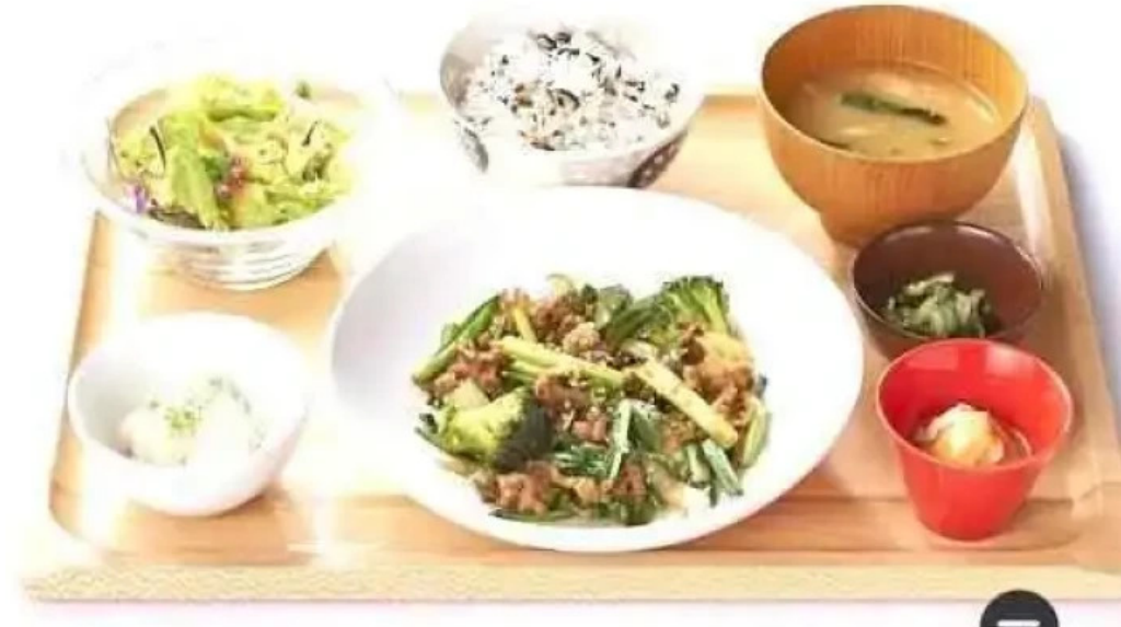
おぼんdeごはん アトレ浦和店 料理飲み物