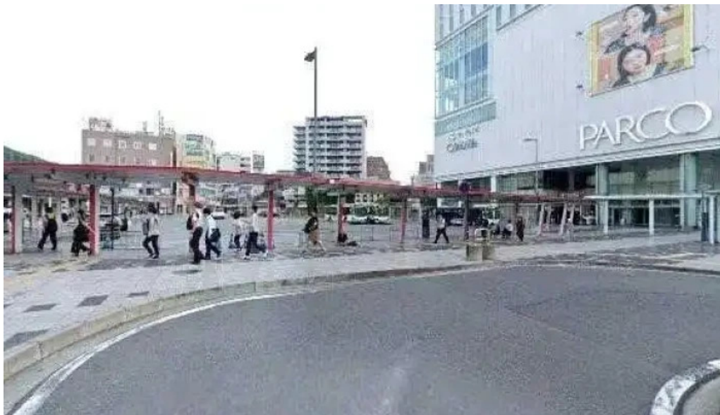
おぼんdeごはん アトレ浦和店 さいたま市