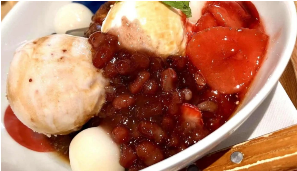
おぼんdeごはん アトレ浦和店 営業中