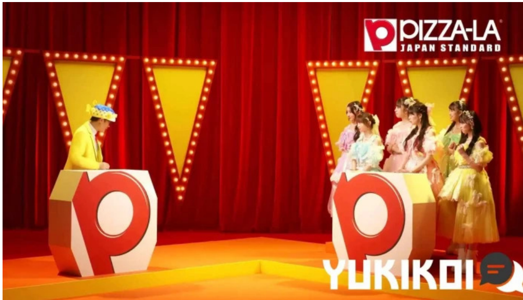
ピザーラ 長岡京店 最新