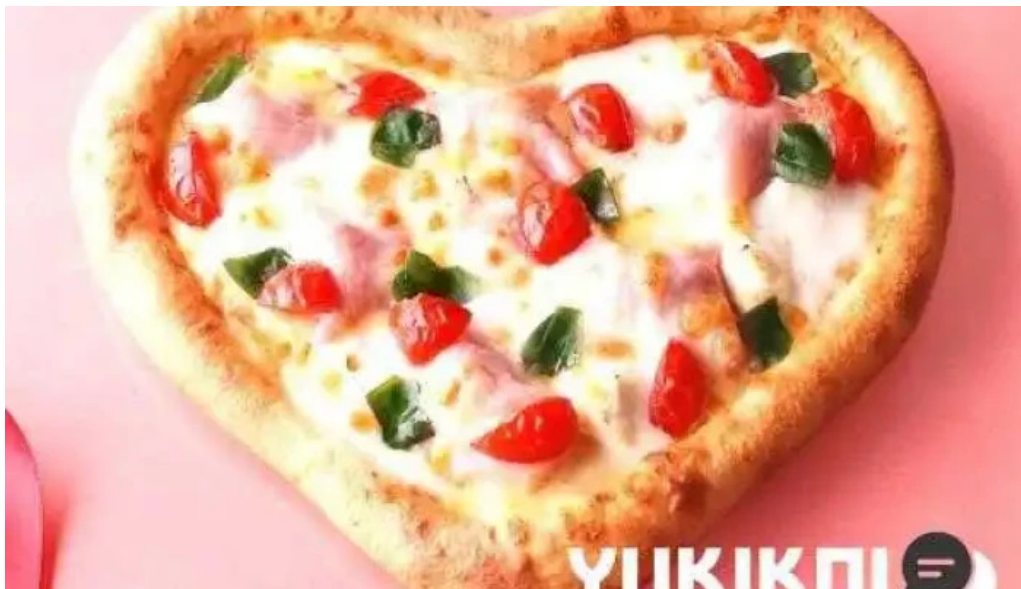
ピザーラ 長岡京店 ピザ