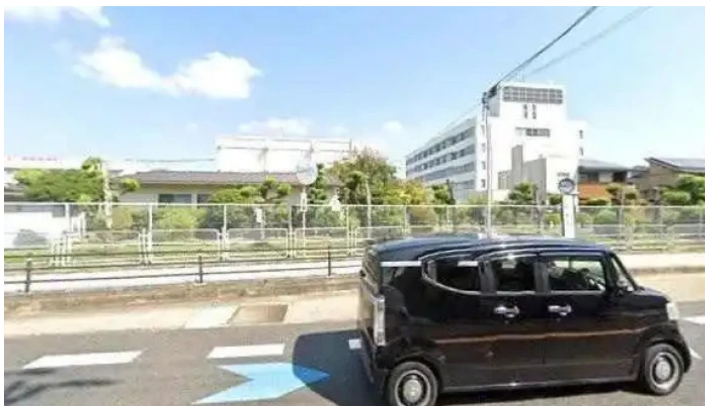
ピザーラ 長岡京店 長岡京市