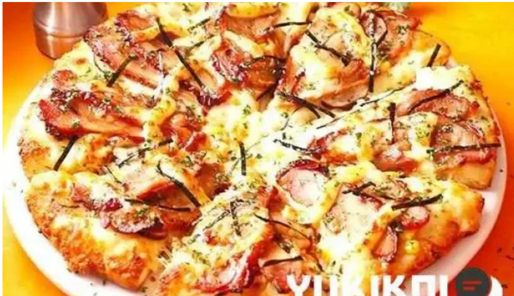
ピザーラ 長岡京店 料理飲み物