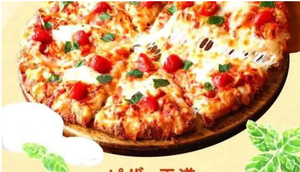
ピザーラ 長岡京店 メニュー