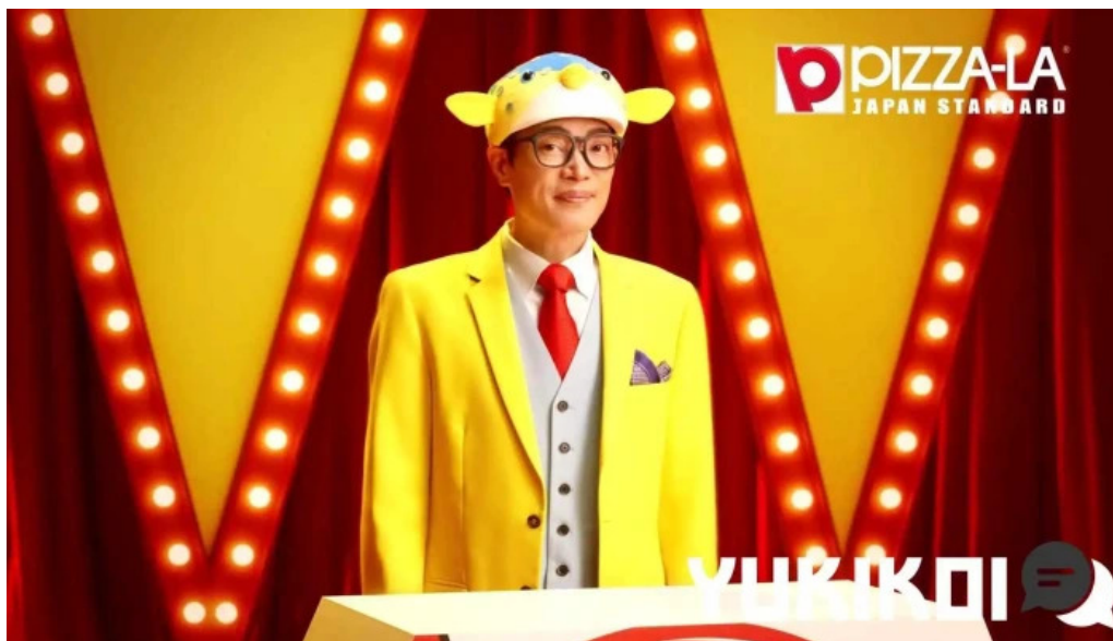
ピザーラ 長岡京店 動画